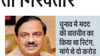
चुनाव में मदद की बातचीत का किया था रिटिंग, मांगे थे दो करोड़ रुपये