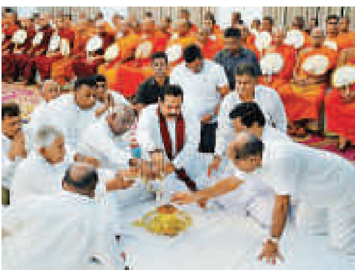
श्रीलंका में ईस्टर पर धमाकों में मारे गए लोगों को श्रद्धांजलि देने के लिए रविवार को आयोजित बौद्ध समारोह में शामिल पूर्व राष्ट्रपति महिंद्रा राजपक्षे और अन्य।