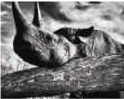
यह पास से ली गई गैंडे की तस्वीर है। जो बोत्सवाना में इस विशालकाय जानवर को नशीली दवा देने के बाद ली गई है।