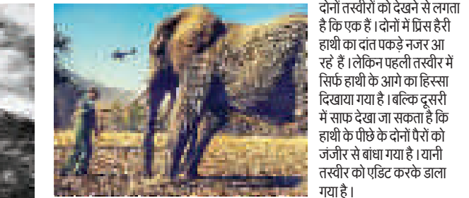
दोनों तस्वीरों को देखने से लगता है कि एक है। दोनों में प्रिंस हैरी हाथी का दांत पकड़े नजर आ रहे हैं। लेकिन पहली तस्वीर में सिर्फ हाथी के आगे का हिस्सा दिखाया गया है। बल्कि दूसरी में साफ देखा जा सकता है कि हाथी के पीछे के दोनों पैरों को जंजीर से बांधा गया है। यानी तस्वीर को एडिट करके डाला गया है।