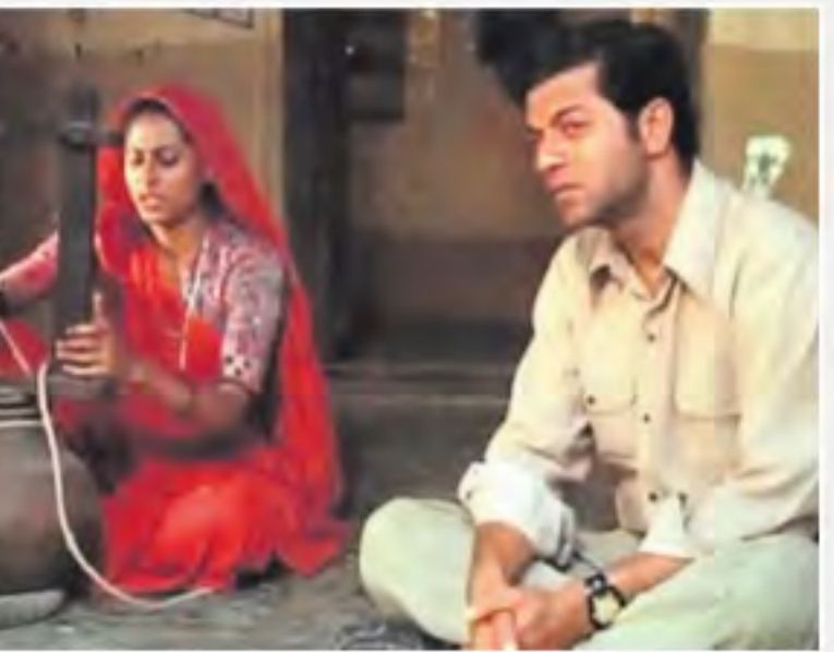
● 'మండన్' (1976-హిందీ)