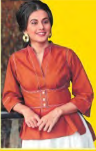
పిల్లలు కావాలనుకున్నప్పుడే పెళ్లి సినిమా వేటలో...