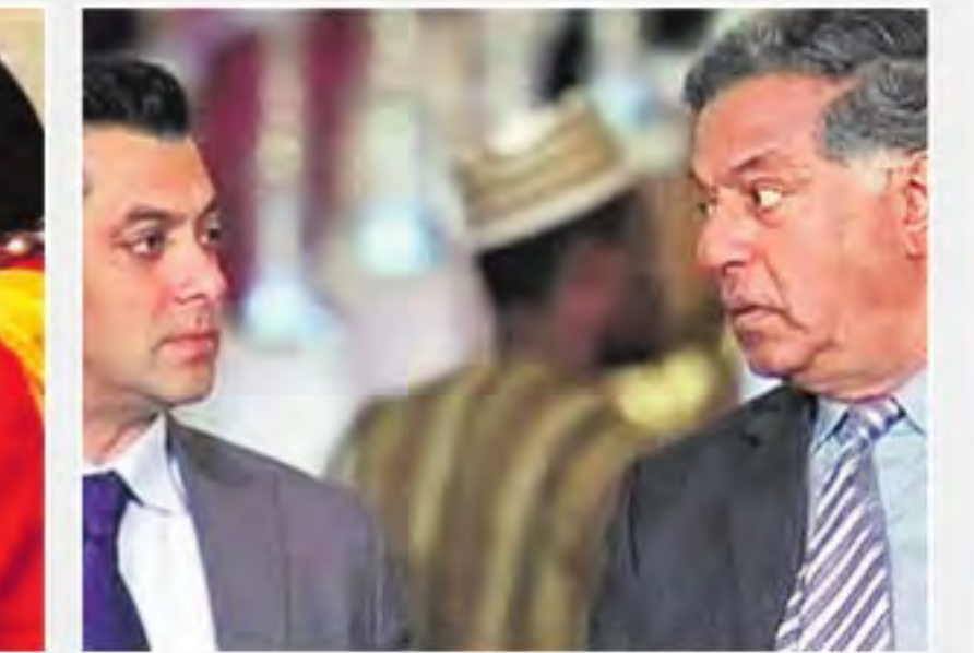
● టైగర్ జిందా హై (హిందీ)