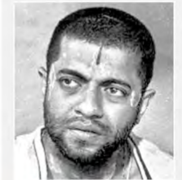
● తొలి చిత్రం 'సంసార్' (1970 - కన్నడ)