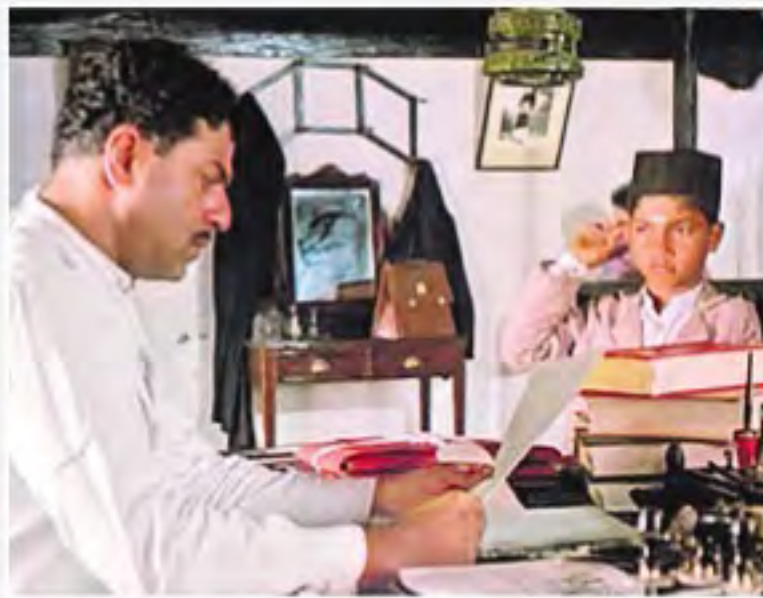
● మార్లాడి డేస్