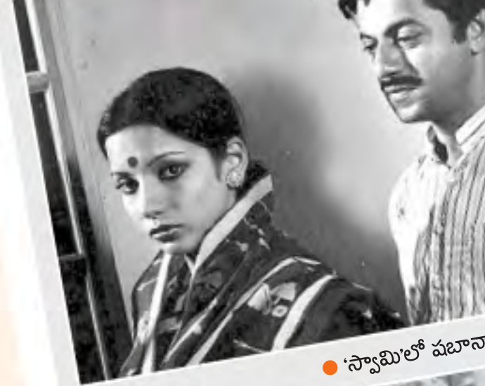
● 'సామి'లో పటానా అంజ్జీతో...