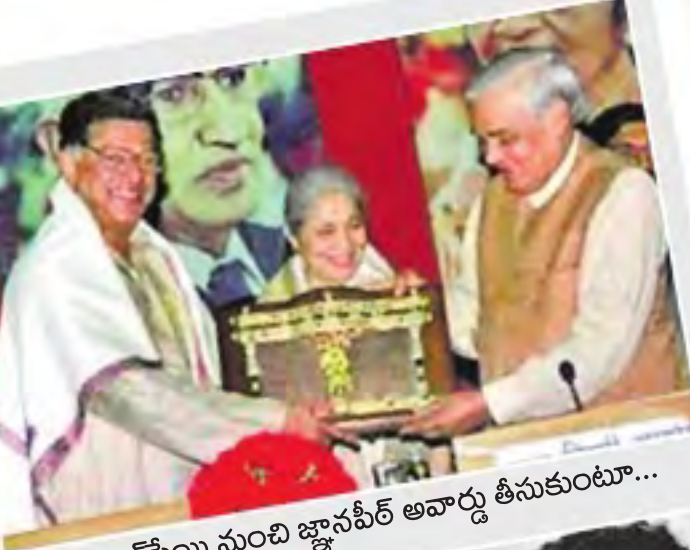
● జాపీపై నుంచి జ్ఞానపీఠ్ అవార్డు తీసుకుంటూ...