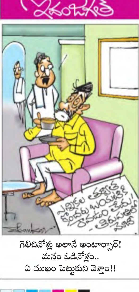
గెలిచిపోళ్లు అలానే అంబారాన్! మనం ఓడిపోళ్లం.. ఏ ముఖం పెట్టుకుని వెళ్తాం!!