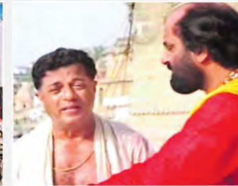
● ప్రేమకుడు (తెలుగు)