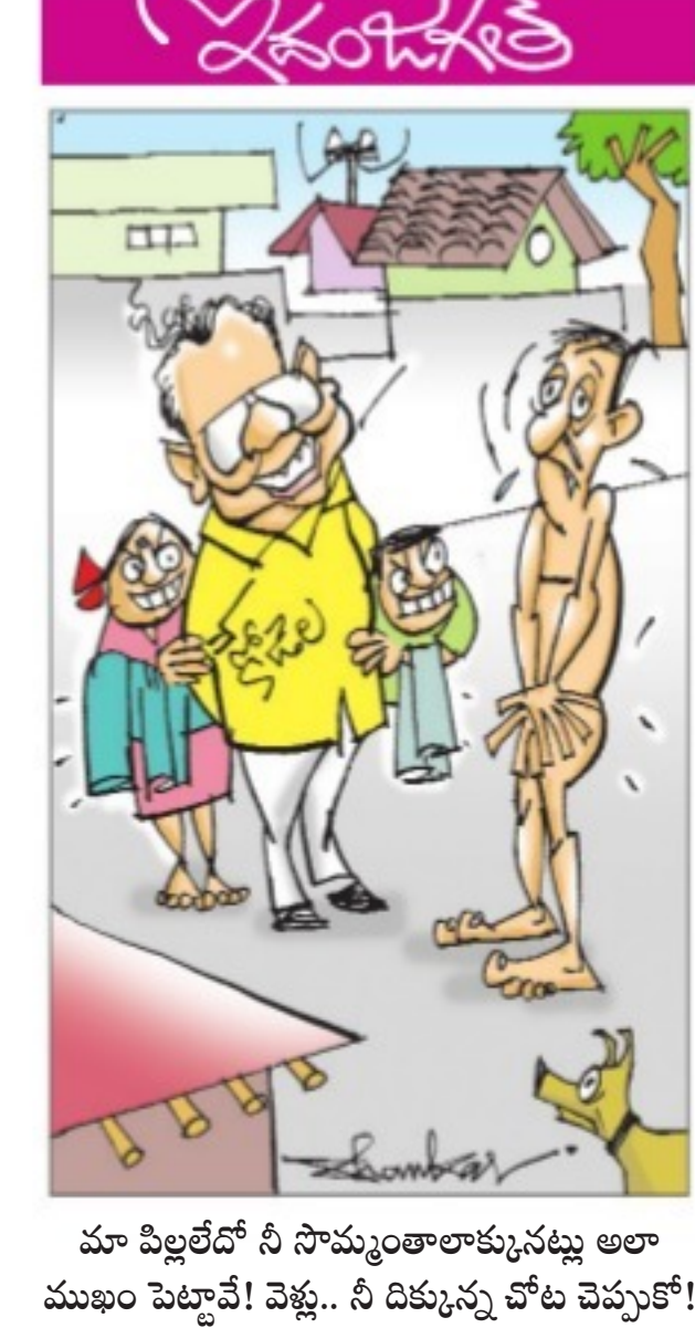
మా పిల్లలేదో నీ సొమ్ముంతా కుక్కనట్లు అలా ముఖం పెట్టావే! వెళ్ళే, నీ దిక్కున్న చోట చెప్పకో!

ద్లోనే ఉండి మరికొందరిని కలువనున్నారు బీజేపీ వర్గాలు చెబుతున్నాయి. రాంమాధవ్ కలసిన నేతలంతా దాదాపు బీజేపీలో చేరుతున్నట్లు సమాచారం. ఈ సందర్భంలో త్వరలోనే బీజేపీలో చేరుతున్న నేతల కేంద్ర కార్యక్రమం పెద్ద ఎత్తున నిర్వహించేందుకు ఏర్పాట్లు చేస్తున్నారు. మొత్తం మీద ఆపరేషన్ ఆకర్స్ భాగంగా ఒక్కొక్కరు కాంగ్రెస్ ఎంపీలు కూడా రాంమాధవ్ టవర్లోకి వెళ్లారని బీజేపీ వర్గాలు చెబుతున్నట్లు బీజేపీ అంపీలు, టీపీసీఎల్ వర్గాలు ఖండిస్తున్నాయి. రాంమాధవ్ నేతృత్వంలో ఎవరెవరు చేరతారనేది ఒకదెండ్లు రోజుల్లో తేలనుంది. రాంమాధవ్ పూర్తిగా చిల్లినా, 2020 పూర్వంలో రాంమాధవ్ అదుగులు వేస్తున్నట్లు సమాచారం. బుధవారం పలువురు నేతలను కలిసిన ఆయన గురువారం కూడా హైదరాబా