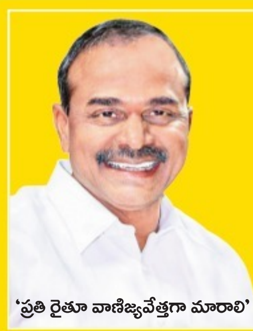
'ప్రతి రైతు వాణిజ్యవేత్తగా మారాలి'