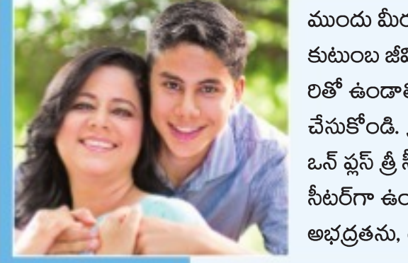
ముందు మీరు మీ పుత్రులకు జీవితాన్ని నిర్ధారణ చేసుకోండి. కుటుంబ జీవితాన్ని నిర్ధారణ చేసుకోండి. ఒకటితో మరోకటితో ఉండాలి బంధాన్ని. ఇప్పుడు స్పేస్ మీదే డైవోర్స్ చేసుకోండి. డ్రాయింగ్ రూమ్లో సోఫానులే కూడా ఒక ఫ్లస్ ఒక ఫ్లస్ నీటి సీటర్ గా డిజైన్ అయి ఉంటుంది. అంతే తప్ప ఫైవ్ నీటి సీటర్ గా ఉండదు. ఆ విభజన అర్థం చేసుకుంటే మీ ముగ్గురు అభ్యర్థకులు, గందరగోళాన్ని వదిలి వాస్తవికంగా జీవించడం

అమె తల ఊపి వెళ్లిపోయింది. పదిరోజులు గడిచిపోయాయి. అమె రాలేదు. సైకియాట్రిస్టులు తెలుసు - అమె తిరిగి రావడం ముఖ్యమని. కానీ అమె అరు నెలల తర్వాత వచ్చింది. అదే డిప్రెషన్ తో. 'ఏమయ్యారు మీరు?' అడిగాడు సైకియాట్రిస్ట్. 'సారీ డాక్టర్, బిజీ వల్ల రాలేకపోయాను. మళ్ళీ పెళ్లి చేసుకున్నాను' అంటామి. 'అవును... మంచి అలోచన. కానీ అందుకు అవసరమైన ప్రీ కౌన్సిలింగ్ తీసుకుని ఉంటే బాగుండేది' అన్నాడు సైకియాట్రిస్ట్. 'అదే తప్పయ్యింది. ఇంకా డిప్రెషన్ తోకి వెళ్లాను' అంటామి. 'ఆ తర్వాత ఏం జరిగిందో చెప్పింది. 'మీ దగ్గరి నుంచి వెళ్లక మా అబ్బాయి నా గురించి ఎక్కువ అలోచించాడు. అమ్మా... నువ్వు నా విషయంలో ఇన్ సెక్యూర్ అవుతున్నావు. నేను బిజీనే చేశాక యు.ఎస్ వెళ్లాలనుకుంటున్నాను. అప్పుడైనా వెళ్లండి. నువ్వు పెళ్లి చేసుకో. మనిషికి సర్కస్ వ్యక్తివే తెలుసుకొందా. నేను యు.ఎస్ వెళ్లాలేపు ఒకటి రెండేళ్లలో నువ్వు కూడా నీ లైఫ్ లను ఆర్గనైజ్ చేసుకోవచ్చు అన్నాడు. బంధువులకు ఈ విషయం చెప్పి డైవోర్స్ అయిన ఒకతన్ని చూపించారు. మాకు నచ్చాడు. చేసుకున్నాను. ఎప్పుడైతే పెళ్లి చేసుకున్నానే ఆ క్షణం నుంచి నడవగా నాకు కొత్త భయం