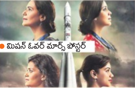
మిషన్ ఓవర్ మార్క్ షోస్టర్