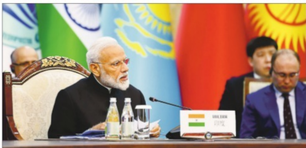
बिश्केक में शुक्रवार को शंघाई सहयोग संगठन के शिखर सम्मेलन को संबोधित करते नरेंद्र मोदी।

किर्गिस्तान की राजधानी बिश्केक में शंघाई सहयोग संगठन (एससीओ) के शिखर सम्मेलन में प्रधानमंत्री नरेंद्र मोदी ने आतंकवाद को प्रोत्साहन, समर्थन और वित्तीय मदद मुहैया कराने वाले देशों को जोरदार आलोचना की। उन्होंने कहा कि सीमा पार आतंकवाद को प्रश्रय दे रहे ऐसे देशों को जवाबदेह ठहराया जाना चाहिए। पाकिस्तान का नाम लिए बगैर मोदी ने यह मुद्दा उठाया। उनके संबोधन के दौरान पाकिस्तान के प्रधानमंत्री इमरान खान भी वहां उपस्थित थे। एससीओ के शिखर सम्मेलन में प्रधानमंत्री का यह पाकिस्तान को कड़ा कूटनीतिक संदेश माना जा रहा है।