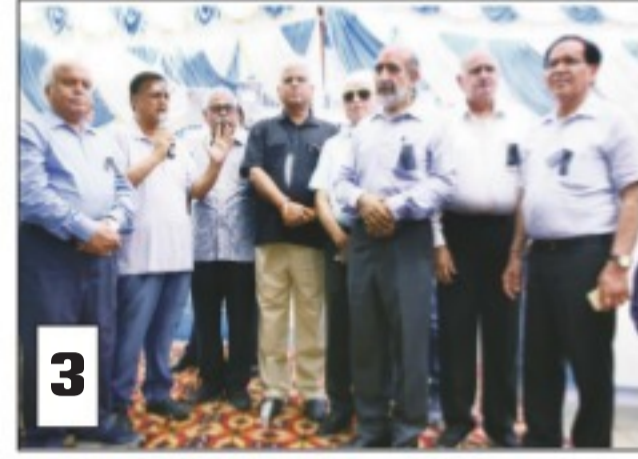
इलाज न होने पर एक अस्पताल के बाहर मायूस बैठे मरीज (1), डॉक्टरों ने टप किया कामकाज (2) और डॉक्टरों ने संगठन ने डॉक्टरों को संबोधित किया (3)।

जाए। उन्होंने कहा कि केंद्रीय मंत्री ने मौखिक आश्वासन दिया है। लेकिन हम इस पर मानने वाले नहीं हैं लिहाजा हमने कल से दिल्ली सरकार के सभी अस्पतालों में भी हड़ताल का फैसला किया है। अस्पतालों में आपातकालीन सेवाओं को छोड़कर ओपीडी और नियमित ओटी सेवाएं पूरी तरह बंद रही। नए पंजीकरण नहीं किए गए। जांच व नियमित ऑपरेशन नहीं किए जा सके। दिल्ली मेडिकल एसोसिएशन ने दरियागंज से राजघाट तक मार्च निकाला। इसके अध्यक्ष डॉ