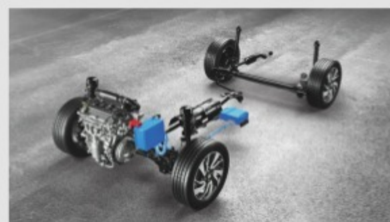
New Smart Hybrid Technology