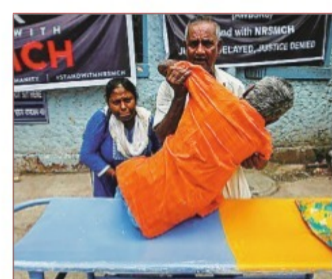
डॉक्टरों की हड़ताल के कारण शुक्रवार को बौर इलाज सरकारी अस्पताल से घर लौटता मरीज।

● कलकत्ता हाई कोर्ट ने सरकार से कहा, चिकित्सकों से बात कर उन्हें मनाएं