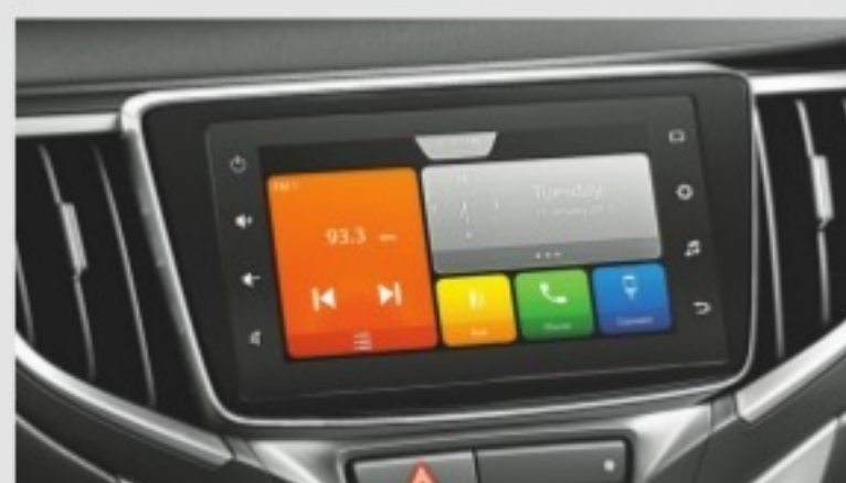
New Smartplay Studio