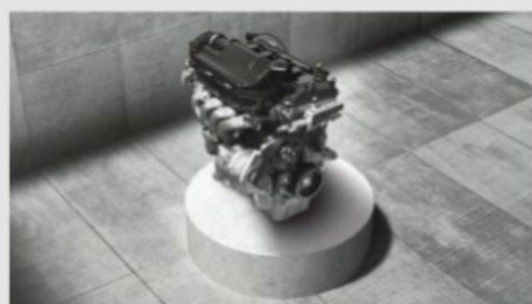
New Dual Jet, Dual VVT Engine