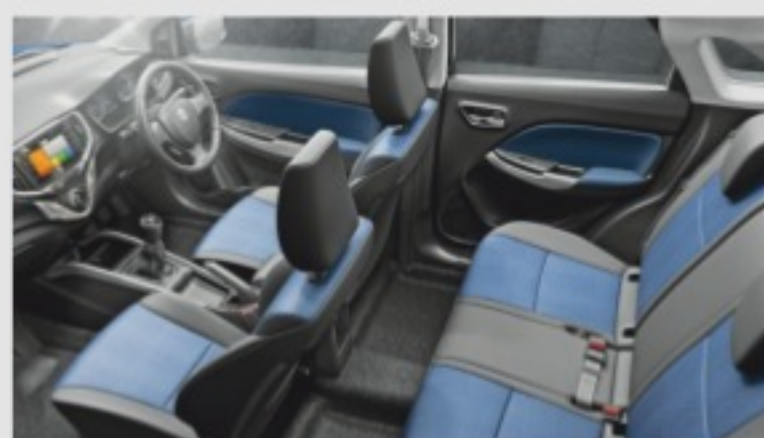
New Dual Tone Interiors