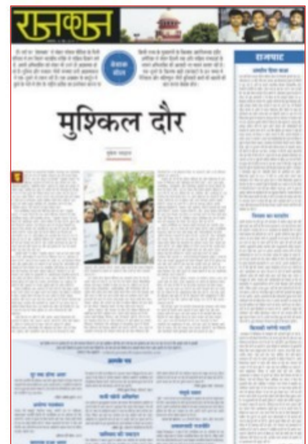
विशेष पन्ना राजकाज पेज 7 पर