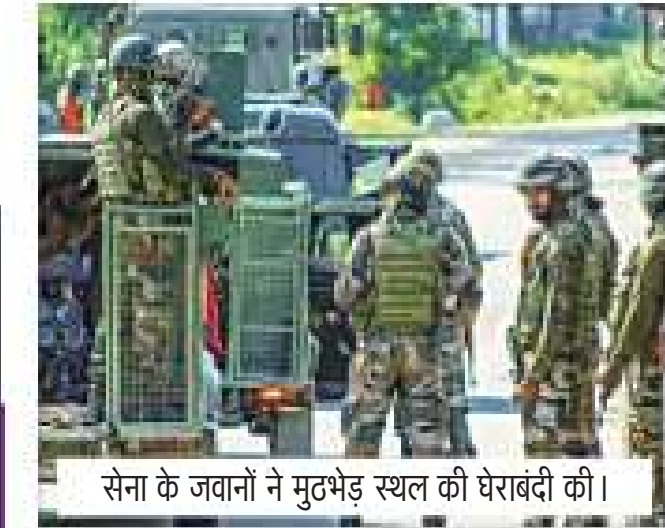
सेना के जवानों ने मुठभेड़ स्थल की घेराबंदी की।

सुरक्षाबलों ने आतंकीयों के एक समूह को विदुरा गांव के पास घेरा था। सेना के प्रवक्ता के मुताबिक, सोमवार सुबह अनंतनाग के अचलल में आतंकीयों के छिपे होने की सूचना मिली थी। इसके बाद राष्ट्रीय राइफल, सीआरपीएफ व एसओजी के संयुक्त दल ने तलाशी अभियान शुरू कर दिया। इस दौरान आतंकीयों ने सुरक्षाबलों पर गोलीबारी शुरू कर दी। आतंकी हमले में शहीद और घायल जवान सेना की 19 राष्ट्रीय राइफल से जुड़े हुए हैं।