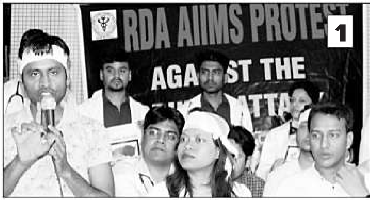
आरडीए के पदाधिकारियों की ओर से प्रेसवार्ता की गई (1) और एम्स में हड़ताल के बाद परेशान घूमते नजर आए मरीज और तीमारदार (2)।

डॉक्टरों ने बताया कि ओपीडी सेवा, नियमित आपरेशन थियेटर और वार्ड राउंड सेवाएं सोमवार को दोपहर से मंगलवार की सुबह छह बजे तक बंद कर दी गई हैं, लेकिन इमरजेंसी सेवाएं, गहन चिकित्सा कक्ष (आईसीयू) और प्रसूति कक्ष सेवाओं को इस हड़ताल से बाहर रखा गया है। कई डॉक्टरों ने सिर पर सफेद पट्टी और बाजू पर काली पट्टी बांधकर मरीजों को देखा। एम्स