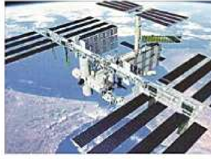
अंतरराष्ट्रीय अंतरिक्ष स्टेशन

इसरो की योजना 20 टन वजनी अंतरिक्ष स्टेशन को पृथ्वी से 400 किमी की ऊंचाई पर स्थापित करने की है। इसमें अंतरिक्ष यात्री 15 से 20 दिन रह सकेंगे।