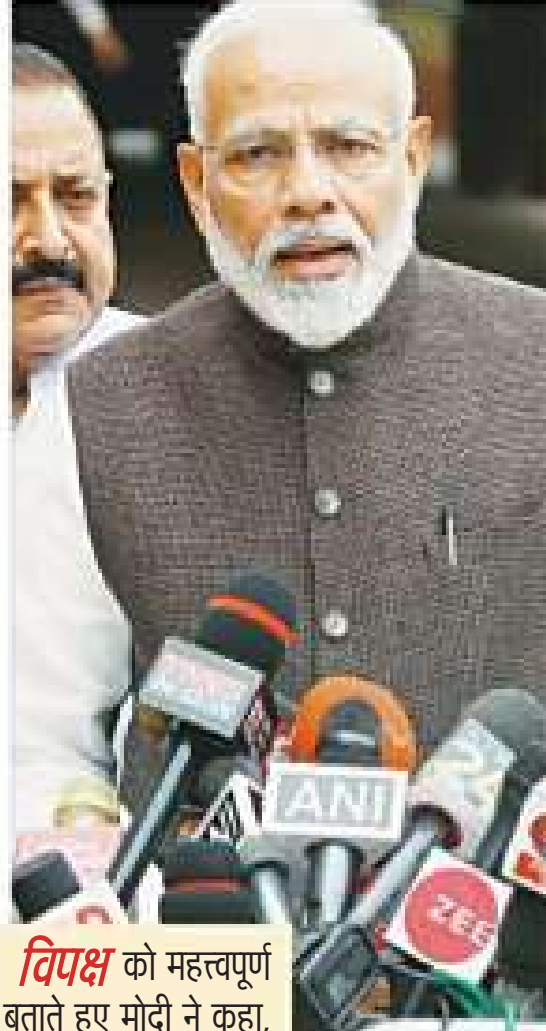
विपक्ष को महत्वपूर्ण बताते हुए मोदी ने कहा, संख्या की विला न करें, आपका हर शब्द मूल्यवान सांसदों से कहा, सकारात्मक रुख के साथ जनता की आवाज उठाने रहें

संसद भवन परिसर में मीडियाकार्मियों से बातचीत में उन्होंने कहा, 'नई लोकसभा के गठन के बाद आज प्रथम सत्र प्रारंभ हो रहा है। अनेक नए साधियों के परिचय का यह अवसर है। नए साथी जब जुड़ते हैं तो नया उमंग, नया उत्साह, नए सपने भी जुड़ते हैं। भारत के लोकतंत्र की विशेषता और ताकत का अनुभव हम हर चुनाव में करते हैं। इस बार खास यह रहा कि आजादी के बाद सबसे ज्यादा महिला प्रतिनिधियों को चुना गया और सबसे अधिक मतदान हुआ। कई दशक के