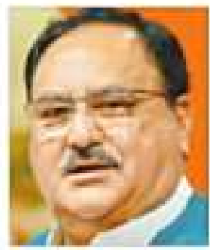
प्रमुख अमित शाह शामिल हुए। नड्डा ने कहा, वे पार्टी कार्यकर्ता के तौर पर उसकी मजबूती के लिए काम करेंगे। शाह को धन्यवाद देते हुए नड्डा ने कहा कि उनकी अगुआई में पार्टी ने नई ऊंचाइयों को छुआ। सिंह ने ट्वीट किया, 'भाजपा संसदीय बोर्ड की आज बैठक हुई और नड्डा को कार्यकारी अध्यक्ष चुना गया। वे संगठनात्मक चुनाव होने तक कार्यकारी अध्यक्ष बने रहेंगे।' नड्डा को बधाई देते हुए प्रधानमंत्री मोदी

भाजपा के वरिष्ठ नेता और पूर्व केंद्रीय मंत्री जेपी नड्डा को सोमवार को पार्टी का कार्यकारी अध्यक्ष नियुक्त किया गया है। हालांकि अमित शाह फिलहाल पार्टी के अध्यक्ष बने रहेंगे। पार्टी की संसदीय बोर्ड की बैठक में यह फैसला किया गया। संसदीय बोर्ड की बैठक के बाद रक्षा मंत्री राजनाथ सिंह ने बोर्ड के इस निर्णय की घोषणा की। बैठक में प्रधानमंत्री नरेंद्र मोदी और भाजपा