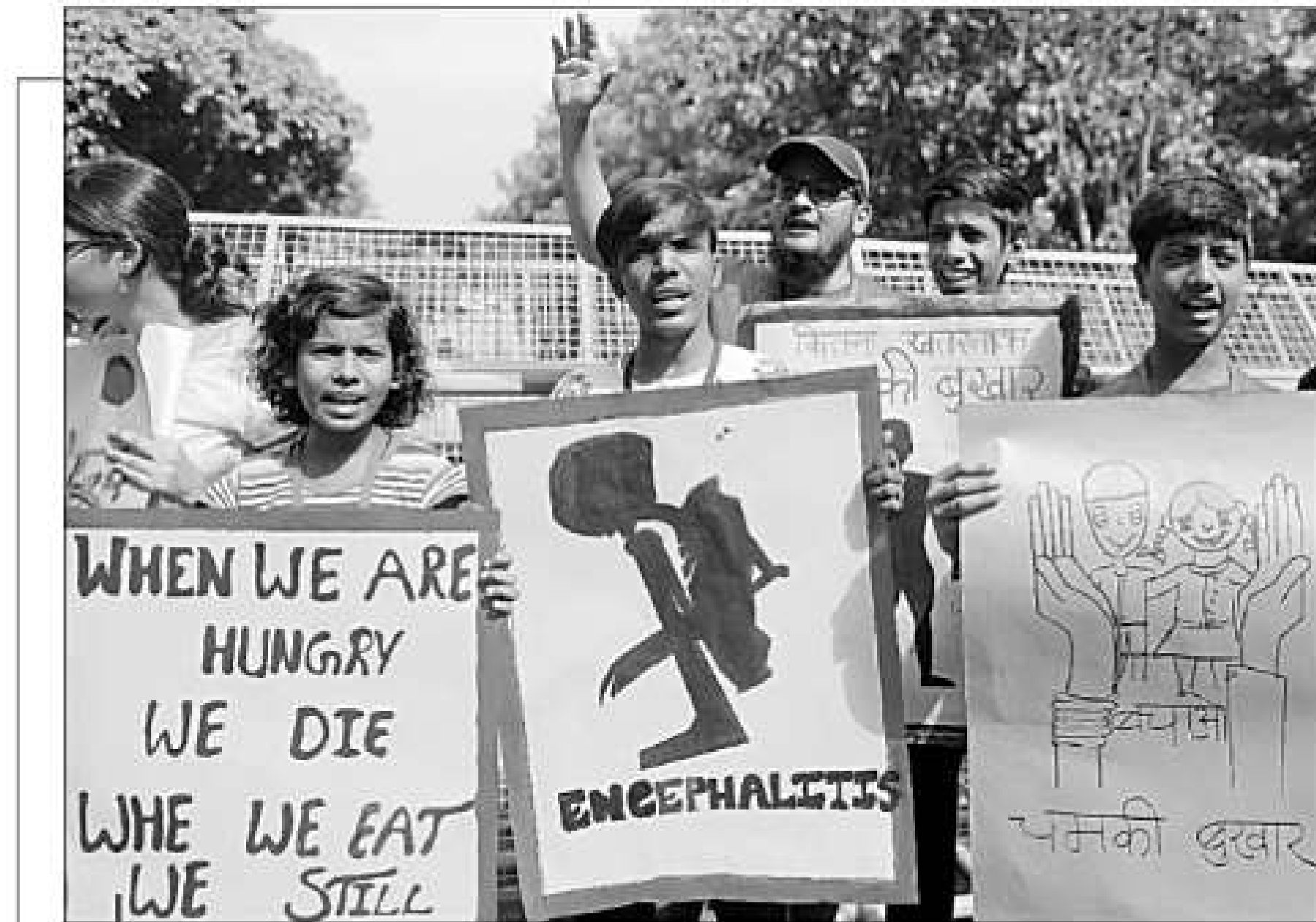
विरोध बिहार के मुजफ्फरपुर में चमकी बुखार से हो रही बच्चों की मौत पर दिल्ली में हुए प्रदर्शन में बच्चों भी हुए शामिल