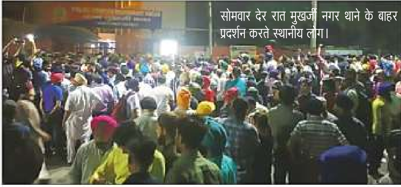
सोमवार देर रात मुखर्जी नगर थाने के बाहर प्रदर्शन करते स्थानीय लोग।

प्रवक्ता ने बताया कि घटना के बाद बड़ी संख्या में स्थानीय लोग मुखर्जी नगर थाने के बाहर पहुंचे और रविवार देर रात तक जमकर हंगामा किया। इस दौरान जब बातचीत करने