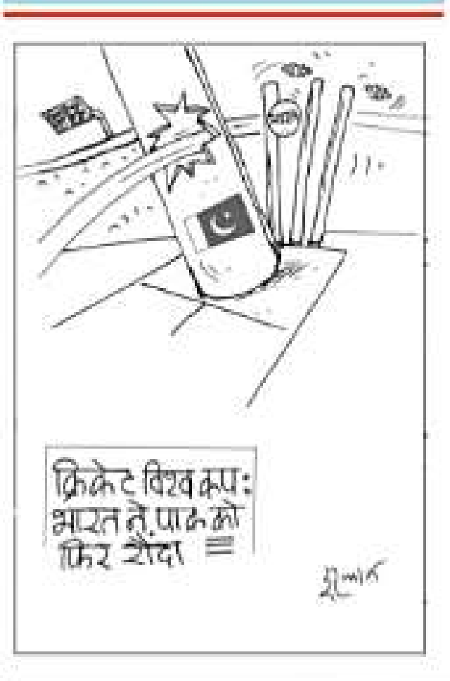
क्रिकेट विश्वकप: भारत ने पाक को फिर से हराया