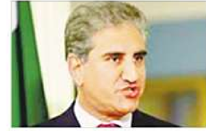
शाह महमूद कुरैशी

मंगलवार, 11 जून : ईरान के विदेश मंत्री ने अमेरिका को आगाह किया कि तेहरान के खिलाफ आर्थिक युद्ध छेड़ने के बाद वह सुरक्षित बने रहने की उम्मीद नहीं कर सकता। खाड़ी में तनाव के मद्देनजर ईरान के विदेश मंत्री जवाद जरीफ ने कड़े शब्दों में अपनी बात रखी।