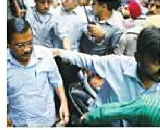
चालक से मिलने पहुंचे दिल्ली के मुख्यमंत्री अरविंद केजरीवाल।

इस बीच, गृह मंत्रालय ने दिल्ली पुलिस से एक रिपोर्ट सौंपने को कहा है। केंद्रीय गृह राज्य मंत्री