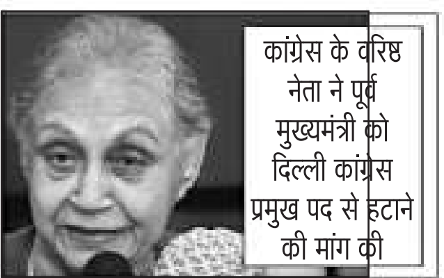
कांग्रेस के वरिष्ठ नेता ने पूर्व मुख्यमंत्री को दिल्ली कांग्रेस प्रमुख पद से हटाने की मांग की