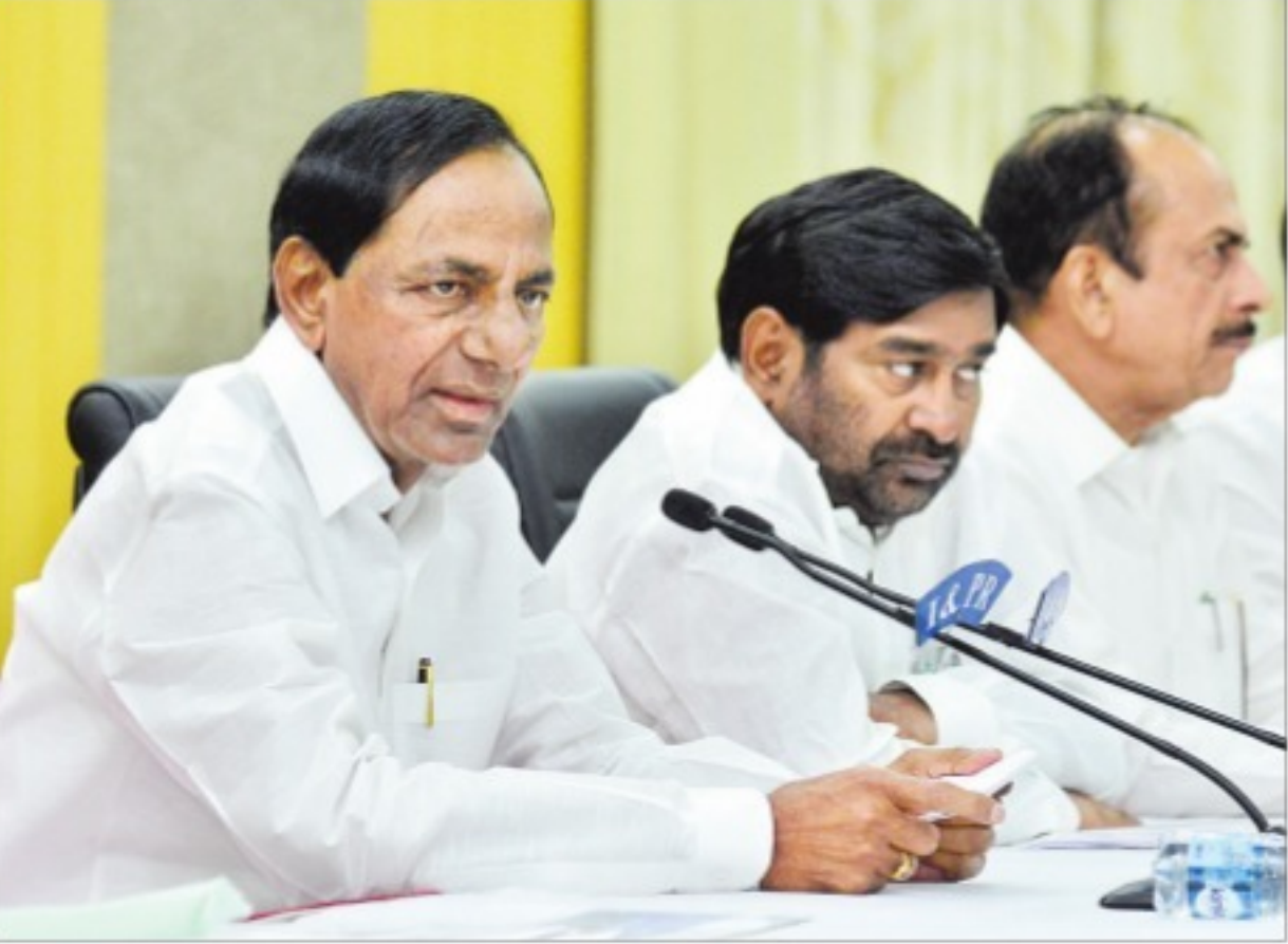
మంగళవారం ప్రగతిభవనంలో కేబినెట్ నిర్ణయాలను మీడియాకు వెల్లడిస్తున్న సీఎం కేసీఆర్. చిత్రంలో విద్యా శాఖ మంత్రి జగదీశ్ రెడ్డి, హోం మంత్రి మహమూద్ అలీ