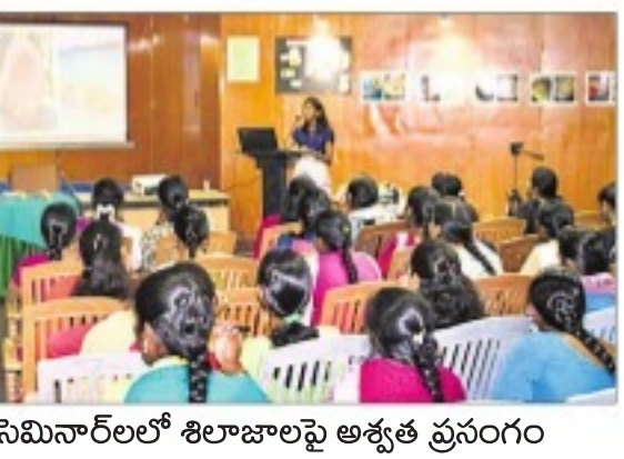
సెమినార్ లో శిలాజాలపై ఆసక్త ప్రసంగం