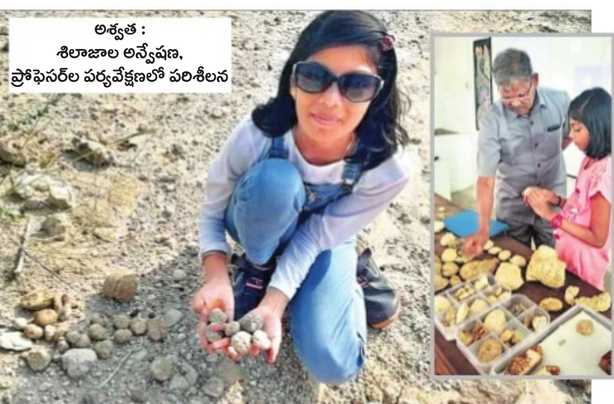
అక్కడ : శిలాజాల అన్వేషణ, ప్రోఫెసర్ల పర్యవేక్షణలో పరిశీలన

గువ్వలంటి ఈ పాపాయి గవ్వలతో ఆడుకుని అక్కడితో ఆగిపోయి ఉంటే.. ఇప్పుడు ఆమె గురించి చెప్పకోవడానికి ఏమీ ఉండకపోయేది. గవ్వల గానీ కనిపిస్తూనే గవ్వ కానిదేదో అక్కడ ఆకర్షించింది. అది శిలాజం అని చెప్పింది అమ్మ. అలాంటి శిలాజాల కోసం వెతకడం మొదలు పెట్టింది. శిలాజాల శోధన అంత సులువు కాదని అప్పట్లో అక్కడకు తెలియనిది. అలాగే నాటి కోసం వెతకడం మాననూ లేదు.