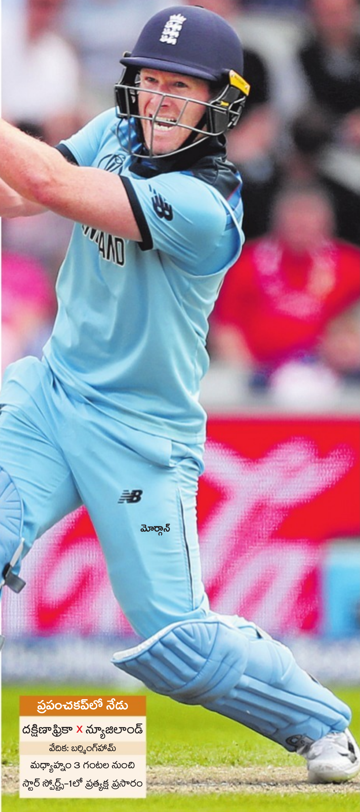
ప్రపంచకప్లో నేడు దక్షిణాఫ్రికా X న్యూజిలాండ్ వేదిక: బర్మింగ్హామ్ మధ్యాహ్నం 3 గంటల నుంచి స్టార్ స్పోర్ట్స్-1లో ప్రత్యేక ప్రసారం

దాదాపు అసాధ్యమైన లక్ష్య వేదనలో అఫ్ఘాన్ ఏ దశలోనూ గట్టిగా నిలబడలేకపోయింది. రెండో ఓవర్లో నూర్ అలి (0) ఔట్ కావడంతో సరైన ఆరంభమే అభివందలేదు. కెప్టెన్ గల్బాద్దీన్ నైట్ (28 బంతుల్లో 37; 4 ఫోర్లు, 1 సిక్స్) ధాటిగా ఆడి ప్రయత్నం చేయగా, రహమాత్ షా (74 బంతుల్లో 46; 3 ఫోర్లు, 1 సిక్స్) రాజీనామా. ఆ తర్వాత హుషారులూ, అఫ్ఘాన్ (48 బంతుల్లో 44; 3 ఫోర్లు, 2 సిక్స్) నాలుగో వికెట్కు 90 బంతుల్లోనే 94 పరుగులు జోడించి కొద్దిగా ప్రతిఘటించే ప్రయత్నం చేసినా పెద్దగా ప్రయోజనం లేకపోయింది. సబీ (9) కూడా విఫలం కావడంతో విజయంపై అఫ్ఘాన్ ఆశలు కోల్పోయింది.