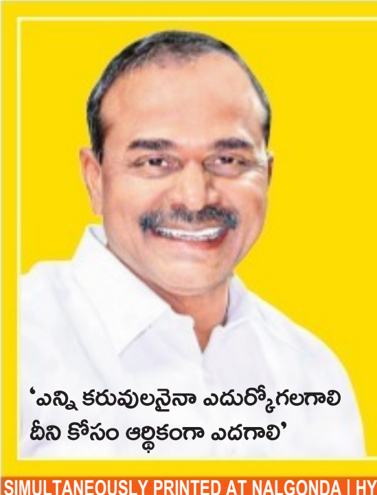
'ఎన్ని కరువులైనా ఎదుర్కోగలగాలి దీని కోసం అర్థికంగా ఎదగాలి'