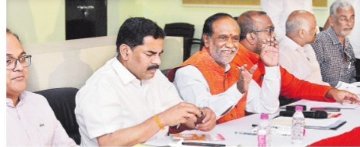
ఫీజులు పెంపు అంశంపై మంగళవారం హైదరాబాద్ లో జరిగిన రౌండ్ టేబుల్ సమావేశంలో మాట్లాడుతున్న బీజేపీ రాష్ట్ర అధ్యక్షుడు కె. లక్ష్మణ్.

ప్రస్తుత పరిస్థితుల్లో డబ్బు తేలికే విద్య లేదని బీజేపీ తెలంగాణ అధ్యక్షుడు డాక్టర్ కె.లక్ష్మణ్ అన్నారు. ఫీజులు పెంపు అంశంపై మంగళవారం అబ్దుల్ గాఫర్ మెదక్కి ఇంజనీరింగ్ కళాశాలలో భారతీయ జనతా యువమోర్చా అధ్యక్షులతో నిర్వహించిన రౌండ్ టేబుల్ సమావేశంలో ఆయన మాట్లాడారు. దేశంలోనే అత్యధిక ఫీజులు కలిగిన నగరంగా హైదరాబాద్ ఉందని తెలిపారు. రాష్ట్రంలో ఫీజులు నియంత్రణ లేకపోవడం వల్ల ప్రైవేటు యాజమాన్యాల ఇష్టానుసారంగా వ్యూహనిర్వహణను పెట్టారు. ప్రభుత్వ పాఠశాలలను ప్రోత్సహించాలిని రాష్ట్ర ప్రభుత్వం ఆ దిశగా చర్యలు చేపట్టాలని ప్రైవేటు పాఠశాలలకు ఊతమివ్వడం ద్వారా అన్నారు. విద్యార్థులు, ఉపాధ్యాయులు లేదా సాకుతో దాదాపు 4 వేల ప్రభుత్వ పాఠశాలలను మూసివేసేందుకు ప్రభుత్వం ప్రయత్నిస్తోందని ఆరోపించారు. 50 వేల ఉపాధ్యాయ పోస్టులు జాగ్రత్తగా ఉన్నాయని, 8,792 పోస్టుల భరతీ తీయడం ద్వారా అభ్యర్థులను ఎంపిక చేసేందుకు రెండేళ్లుగా వారికి పోస్టింగ్ ఇవ్వలేకపోవడంలో అంతర్గత ఏమీటని ప్రశ్నించారు. ప్రశ్నలపై అనుమతించిన మూల్యాంకనం చేసే నిబంధన అద్దుతో కాక కూడా చూసుకోవడం వల్ల పలువురు ఉంటు