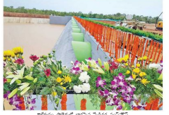
కాళిగిరి ప్రాజెక్టులో అభివృద్ధి పనులు