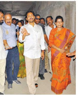
పాలవరం ప్రాజెక్టు పనులు అనుచు ఉన్నాయి.

పాలవరం ప్రాజెక్టు పాలవరం ప్రాజెక్టు పనులు అనుచు ఉన్నాయి.