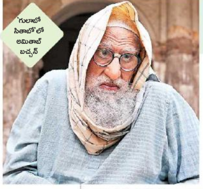
గులాబారీ సినిమాలో అమితాబ్ బచ్చన్