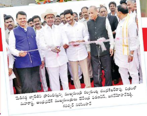
మేడిగడ్డ బ్యారేజీ ప్రారంభోత్సవం ముఖ్యమంత్రి కల్యాణంపట్ల పంపిణీకరణ, చిత్రంలో మహారాష్ట్ర, ఆంధ్రప్రదేశ్ ముఖ్యమంత్రులు దేవేంద్ర ఫడణవీస్, జగన్మోహన్ రెడ్డి, గవర్నర్ నరసింహాన్