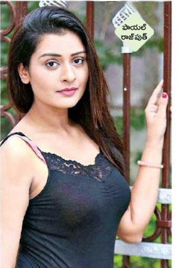
పాయల్ రాజ్ పుత్

అమితాబ్ బచ్చన్ కు వయసు పెరుగుతున్నా విషయం పాత్రల్లో కనిపించాలన్న భ్రష్ట విమాత్రం తగ్గడం లేదు. తాజాగా ఆయన నటిస్తున్న 'గులాబారీ' సినిమాలో చిత్రమే అయినా నిద్రవ్వకుండా ఇంకంటే అమితాబ్ ఇంతవరకూ చేయని ఓ సరికొత్త పాత్రలో కనిపిస్తూ నవ్వులు పూయించనున్నారు. దానికి సంబంధించిన లాక్ బయటికి కొచ్చింది. అందులో నెలసిన గుబురు గడ్డం, కళ్ళజోడుతో, తలమట్టా గుడ్ల కప్పుకుని, మరుమా అంటే కొక్కాల్లో పుష్పాన్ని వాయిలు ఎక్కువగా ఉన్న పాత్రలో కనిపిస్తున్నాడు అమితాబ్. ఆయన గెటప్ కెటేజింగ్ నుంచి అనూహ్య స్పందన వస్తోంది. ప్రముఖ దర్శకుడు సూజిత సర్కార్ తెరకెక్కిస్తున్న ఈ కుటుంబ వ్యాస చిత్రంలో అమితాబ్ పాత్ర అయిపోవడం బుర్రానా సటిస్టున్నారు. వచ్చే ఏడాది ఏప్రిల్ లో ఈ చిత్రాన్ని విడుదల చేయనున్నారు.