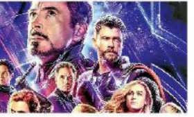
'అవెంజర్స్: ఎండ్ గేమ్'

"అవతార్" రికార్డును 'అవెంజర్స్' బ్రాండు కొట్టిగలగా లేదా అంటూ 'అవెంజర్స్ ఎండ్ గేమ్' విడుదలకు ముందు చర్చ వినిపించింది. భారీ అంచనాలతో వచ్చిన 'ఎండ్ గేమ్', అత్యధిక వసూళ్ళు సాధించిన చిత్రంగా 'అవతార్' పేరిట ఉన్న రికార్డును (2.788 బిలియన్ డాలర్లు) బ్రాండు కొట్టడం భావించుకుంటే ట్రేడ్ విశ్లేషకులు ఊహించారు. అది సాధ్యమే అనిపించేలా 'అవెంజర్స్' అనూహ్యమైన ప్రక్షాళనలతో, భారీ వసూళ్ళతో ఈ సినిమా బాక్సాఫీస్ వద్ద ధూసుకున్నది. ఆ తర్వాత విడుదలైన చిత్రాల నుంచి ఎదురైన పోటీతో వసూళ్ళు నెమ్మదిగా వచ్చాయి. చివరకు 2.744 బిలియన్ డాలర్లు సాధించింది. టీకెట్ 'అవతార్' కన్నా 41 బిలియన్ డాలర్లు వెనకబడింది. అయితే 'ఎండ్ గేమ్'ను మరోసారి ప్రక్షాళన ముందుకు తీసుకురావాలని మార్కెట్ సంస్థలూ, అభిమానులూ అంటుంది. అందులో ఓ టిబీటీవీ సీన్స్ తోడిదినిపెట్టు తెలిపింది. ఈ నెల 28న 'ఎండ్ గేమ్'ను విడుదల చేయనుంది. ఈ రీలీజ్ తర్వాత అయినా 'అవతార్' వసూళ్ళను అధిగమిస్తుందేమో చూడాలి.