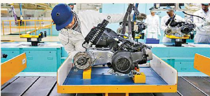
విదేశీ మారకపు నివ్వలో స్వల్ప క్షీణత

వచ్చే కంపెనీలకు ప్రాతినిధ్యం వహించే సెన్సెక్స్, నిస్పీ