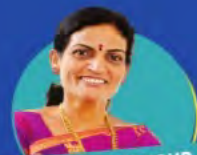
GUEST OF HONOUR