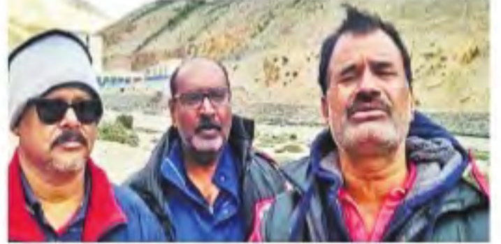
హిల్స్ స్టేషన్ వద్ద చిక్కుకుపోయిన తెలంగాణ యాత్రికులు