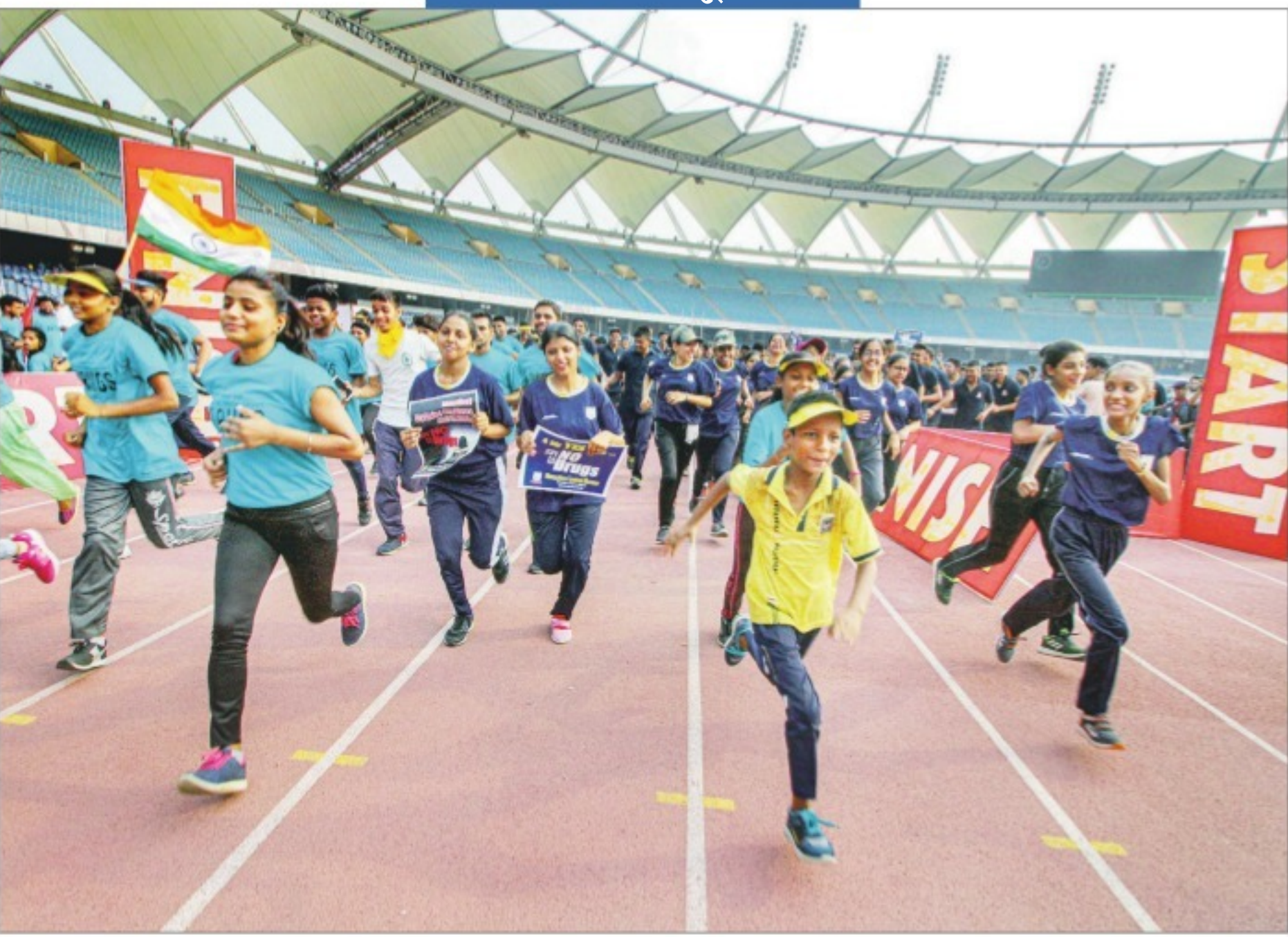
नई दिल्ली में बुधवार को आयोजित एक जागरूकता दौड़ में भाग लेते प्रतिभागी।