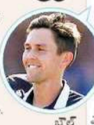
...పూర్తి వివరాలు టెలివిజన్ లో

ప్రపంచవేదికలో ధనవత్తర పోరు. వరుస విజయాలతో ధూనుకె త్తన్న భారత్. ఆదివారం ఆతిష్ఠ ఇంగ్లాండ్ తో తలపడనుంది. ఈ మ్యాచ్ లోనూ గెలిస్తే కోహ్లా సేన సమీకరణాలతో సంబంధం లేకుండా సెమీ ఫైనల్ జెర్నసు బారూ చేసుకుంటుంది. గత మ్యాచ్ లో వెస్ట్ ఇండీస్ ను చిత్తుగా ఓడించిన భారత్. మరో మస విజయంపై కోస్తాసింది. మరోపైపు సెమీస్ అవకాశాలు మరింత సంక్లిష్టం కాకుండా ఉండాలంటే ఇంగ్లాండ్ కు ఈ మ్యాచ్ లో నెగ్గడం ఎంతో అవసరం. పోరు ఇంగ్లాండ్, భారత్ మధ్యనే అయినా. పాకిస్థాన్, బంగ్లాదేశ్, శ్రీలంక ప్రజలు కూడా ఈ మ్యాచ్ పై చాలా ఆసక్తి పెట్టుతున్నారు. ఎందుకంటే ఇంగ్లాండ్ కు భారత్ ఓడిస్తే, మెగా టోర్నీలో ఈ మూడు దేశాల సెమీస్ అవకాశాలు మెరుగువుతాయి.