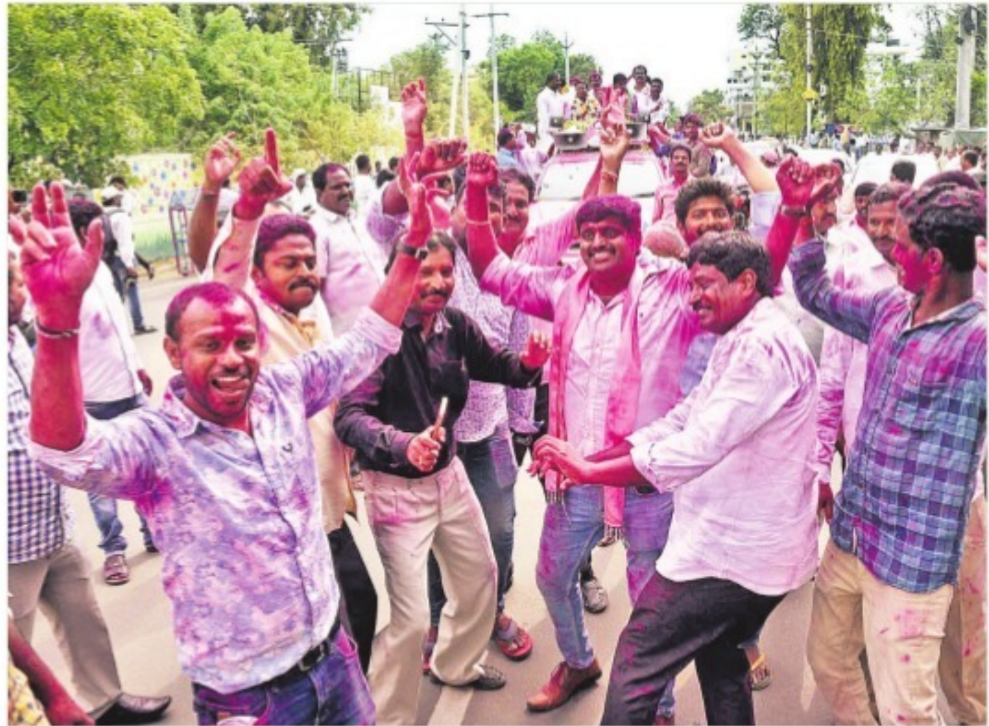
నిజామాబాద్లో జెడ్పీ వైర్లను, వైస్ చైర్మన్లను ఎన్నుకున్న తరువాత నిర్వహించిన విజయాత్మక రాష్ట్రంలో న్యూస్ కార్యక్రమం

మొత్తం 32 జిల్లా పరిషత్ అధ్యక్షస్థానాల్లోనూ టీఆర్ఎస్ అభ్యర్థుల ఎన్నిక