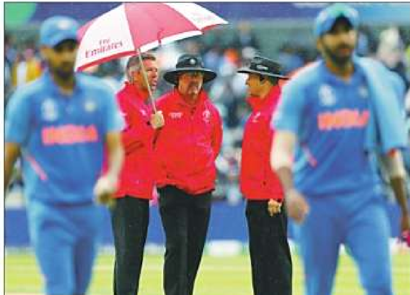
बारिश के बाद पिच का निरीक्षण करते अंपायर।

न्यूजीलैंड ने जब 46.1 ओवर में पांच विकेट पर 211 रन ही बनाए थे तभी बारिश आ गई जिसके बाद दिन में आगे का खेल नहीं हो पाया। अंपायरों ने भारी बारिश के कारण आउटफील्ड गीली होने से मैच रिजर्व दिन को पूरा करने का फैसला किया। सेमी फाइनल और फाइनल के लिए रिजर्व दिन रखा गया है लेकिन इसमें मैच नए सिर से शुरू नहीं होगा। इस तरह से बुधवार को न्यूजीलैंड बाकी बचे 3.5 ओवर खेलेगा और उसके बाद भारतीय पारी शुरू होगी। अगर बुधवार को भी बारिश खलल डालती है और न्यूजीलैंड आगे बल्लेबाजी नहीं कर पाता है तो डकवर्थ लुईस पद्धति से भारत को 46 ओवरों में