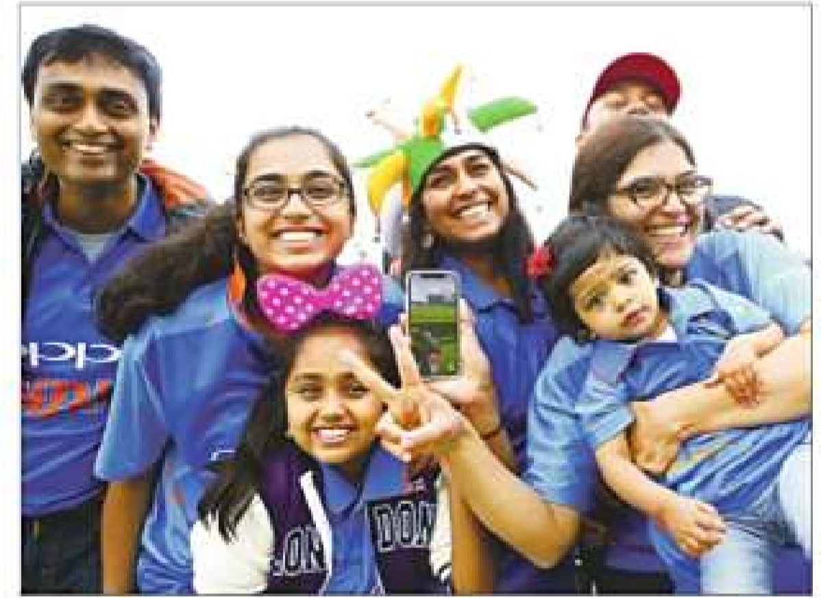
मैनचेस्टर के ओल्ड ट्रैफर्ड में भारतीय प्रशंसक टीम का उत्साह बढ़ाते हुए।

विश्व कप के लीग मुकाबले से पहले आस्ट्रेलिया ने अभ्यास मैच में भी इंग्लैंड को हराया था लेकिन इससे पहले इंग्लैंड ने उनके घरेलू मैदान पर एकदिवसीय श्रृंखला में 4-1 की जीत दर्ज की जबकि अपने घरेलू मैदान पर उन्हें 5-0 से हराया। रूट ने कहा, अगर आप पिछले 11 मुकाबलों को देखेंगे तो हम नौ बार विजेता रहे। उन्होंने कहा, टीम में खिलाड़ियों का जो समूह है पिछले चार में आस्ट्रेलिया के खिलाफ उसका रिकार्ड सकारात्मक रहा है और उन्हें काफी सफलता मिली है। इंग्लैंड के टैस्ट टीम के इस कप्तान ने कहा, मुझे नहीं लगता कि हमारे लिए यह चिंता की बात है। हम गुरुवार को खेले जाने वाले मैच के लिए आस्ट्रेलिया के खिलाफ पिछले कुछ समय में मिली सफलता से प्रेरणा लेंगे। इंग्लैंड के लिए अच्छी बात यह है कि सलामी बल्लेबाज जैसन राय लय में आ गए।