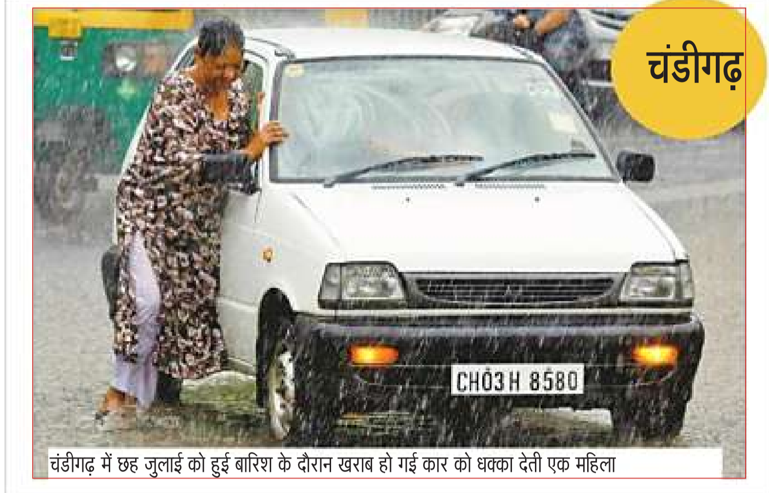
चंडीगढ़ में छह जुलाई को हुई बारिश के दौरान खराब हो गई कार को धक्का देती एक महिला