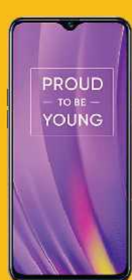
realme 3 Pro