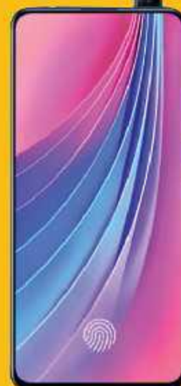
Vivo V15 Pro