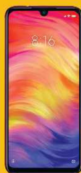
Redmi Note 7 Pro