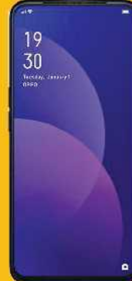
Oppo F11 Pro