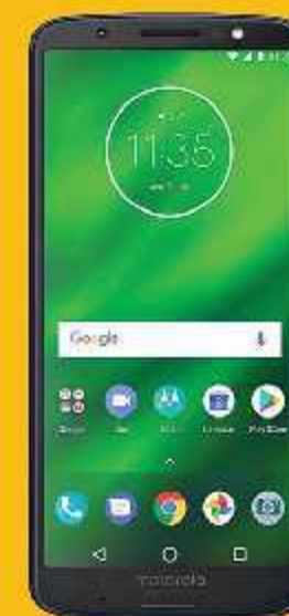
Moto G6 Plus