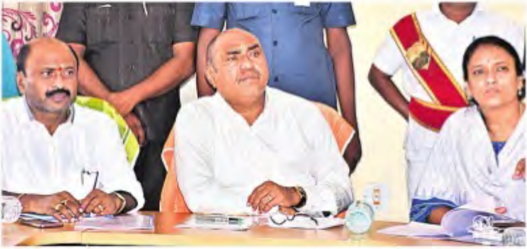
వరంగల్ రూరల్ జిల్లా వరంగల్లో నిర్వహించిన సమీక్ష సమావేశంలో మాట్లాడుతున్న మంత్రి ఎర్రబెల్లి దయాకర్ రావు, చిట్లలో ఎమ్మెల్యే చల్లా ధర్మావర్తి, కలెక్టర్ హరికాళ

వరంగల్ రూరల్ జిల్లా ప్రతినిధి, నమస్తే తెలంగాణ: పట్టణాల అభివృద్ధిపై సీఎం కేసీఆర్ ప్రత్యేక దృష్టి సారించారని పంచాయితీరాజ్ శాఖ మంత్రి ఎర్రబెల్లి దయాకర్ రావు పేర్కొన్నారు. మంగళవారం వరంగల్ పట్టణంలో చిరువ్యాపారుల కోసం ప్రభుత్వం కోటి రూపాయలతో నిర్మించిన భవన సముదాయాలను ప్రారంభించారు. వరంగల్ మున్సిపాలిటీ అభివృద్ధి పనులపై ఎమ్మెల్యే చల్లా ధర్మావర్తి కలిసి సమీక్షించారు. అనంతరం మంత్రి దయాకర్ రావు మాట్లాడుతూ అభివృద్ధి చేసేందుకు డబ్బులు వెచ్చించడానికి ఇబ్బంది లేదన్నారు. సీఎం కేసీఆర్ తో మాట్లాడి వరంగల్ అభివృద్ధికి ప్రత్యేక నిధులు తీసుకొస్తానన్నారు. దేశీ కాలనీలో సమస్యలు ఉన్నట్లు తన దృష్టికి వచ్చిందని.. ఈనెల 15లోగా సమస్యలు పరిష్కరించాలన్నారు. నియోజకవర్గ స్థాయి జాబ్ మేకాను నిర్వహించాలని డీఆర్ డివో పీడి సంవత్సరాల్లో పనిచేస్తానన్నారు. రాష్ట్ర వ్యాప్తంగా హరికాళహర్యాని విజయవంతంగా నిర్వహిస్తున్నామని.. ప్రజల కోరిక మేరకు ఇంటింటికీ మొక్కలను ఉపింపాలి అందిస్తున్నామన్నారు. సమావేశంలో కలెక్టర్ హరికాళ, డివో పీడి సంవత్సరాల్లో పనిచేస్తానన్నారు. రాష్ట్ర వ్యాప్తంగా హరికాళహర్యాని విజయవంతంగా నిర్వహిస్తున్నామని.. ప్రజల కోరిక మేరకు అందింటికీ మొక్కలను ఉపింపాలి అందిస్తున్నామన్నారు. సమావేశంలో కలెక్టర్ హరికాళ, డివో పీడి సంవత్సరాల్లో పనిచేస్తానన్నారు. రాష్ట్ర వ్యాప్తంగా హరికాళహర్యాని విజయవంతంగా నిర్వహిస్తున్నామని.. ప్రజల కోరిక మేరకు అందింటికీ మొక్కలను ఉపింపాలి అందిస్తున్నామన్నారు.