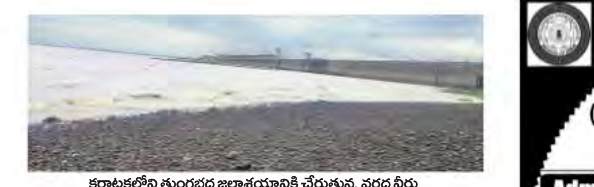
కర్ణాటకలోని తుంగభద్ర జలాశయానికి చేరుతున్న వరద నీరు