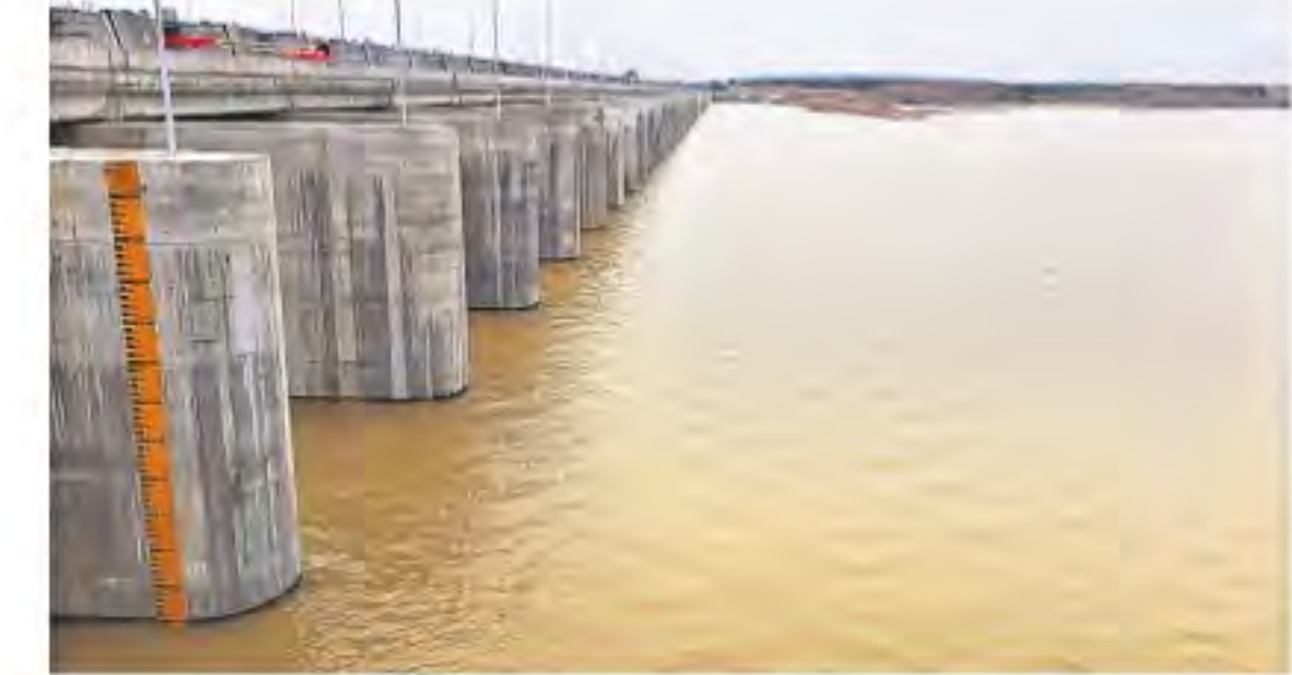
అన్నారం బరాజ్ వద్ద గోదారి నీరు