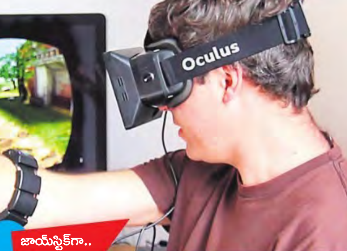
జాయ్ స్టిక్ గా..

ఈ మధ్య కొన్ని వీడియోలు చూస్తున్నాం! సూట్ కేస్ ను చేతితో పట్టుకోక ముందే అది వెనకాలే వస్తుంది. ఎటు వెళ్తే అటు వెంటనే వెళ్తుంటుంది. మరొకటి ఇలాంటిది. వేలి సంజ్ఞలతో మౌస్ పాయింట్ కదులుతుంది. ఆశ్చర్యంగా అనిపిస్తుందా? అదంతా సెన్సర్ల సందడి. ఇలాంటి సెన్సర్ల గాడ్జెట్ల ఇవి..