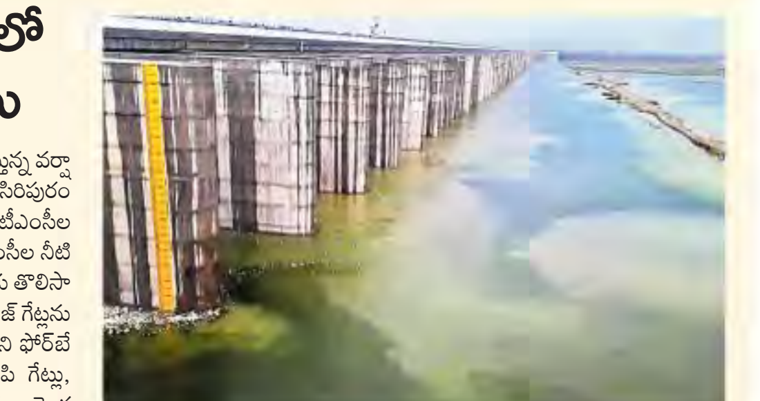
నీటితో కళకలాదుతున్న మంధరి మండలం నిరీపురంలోని సుందీల్ల బరాజ్