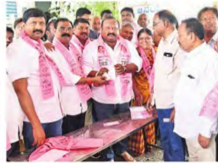
కలీనగర్లోని 23వ డివిజన్లో సభ్యత్వ సమయం రసీదు అందజేస్తున్న ఎమ్మెల్యే గంగుల కమలాక్షి