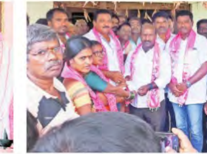
యాదాద్రి భువనగిరి జిల్లా రామన్నపేట మండలం వెల్లంకిలో సభ్యత్వం అందజేస్తున్న సకిరేట్ ఎమ్మెల్యే చిరుమర్తి రంగయ్య