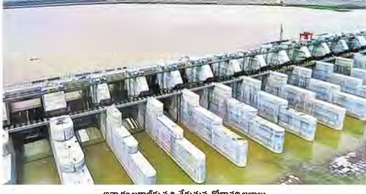
అన్నారం బరాజ్ కు వచ్చి చేరుతున్న గోదారి జలాలు