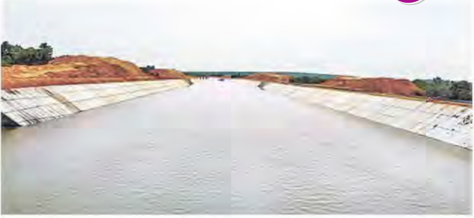
కన్నెపల్లి పంపిణీలో నుంచి గ్రామీణి కెనాల్ ద్వారా అన్నారం బరాజ్ కు తరలివెళ్తున్న గోదారి జలాలు

మహారాష్ట్రలో కురుస్తున్న వర్షాలకు ప్రాణ హిత సదిలోకి వరద నీరు వచ్చి చేరుతున్నది. గత ఐదురోజులుగా కొనసాగుతున్న