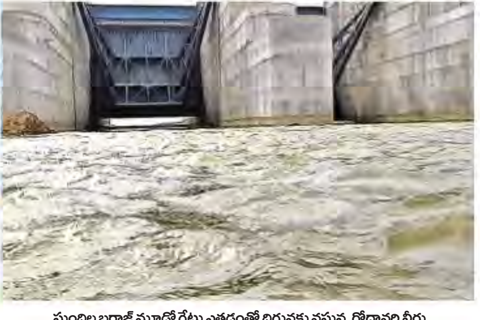
సుందిల్ల బరాజ్ మోటర్ గేటు ఎత్తడంతో దిగువకు వస్తున్న గోదారి నీరు