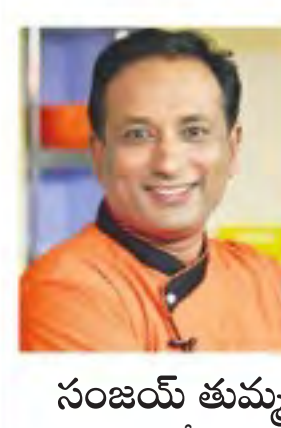
సంజయ్ తుమ్మ సెలెబ్రిటీ చెఫ్