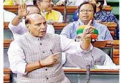
లోక్ సభలో మాట్లాడుతున్న రాజీనాథ్ సింగ్

కేంద్ర రక్షణ మంత్రి రాజీనాథ్ సింగ్ ద్వారా లోక్ సభలో రామోల్ విమర్శలకు దీటుగా స్పందన తామూ - దిల్లీ