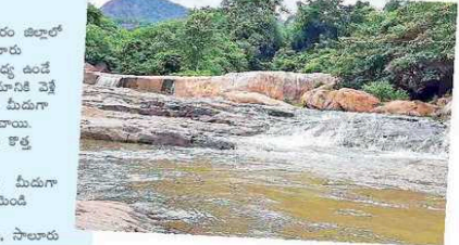
అదరపకే: తాడిగుర్రం, విశాఖపట్నం