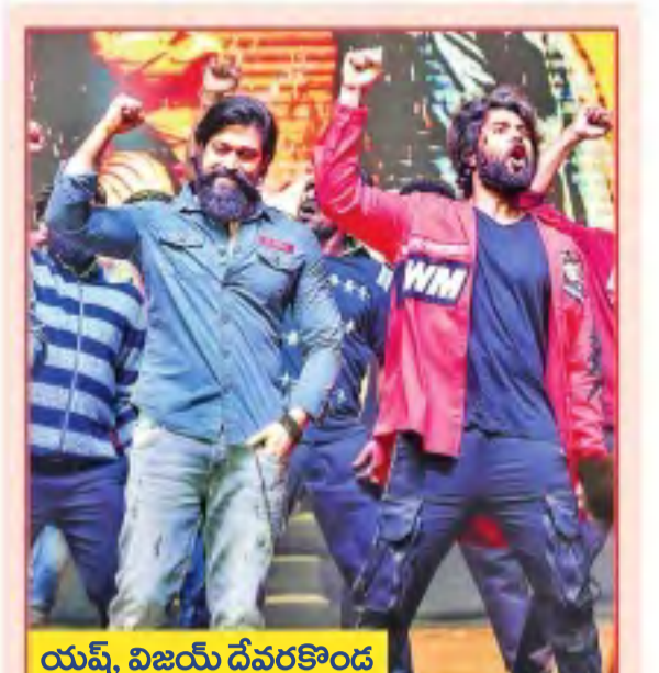
యష్, విజయ దేవరకొండ

'డియర్ కాప్టైన్' మూజిక్ ఫెస్టివల్ ను శుక్రవారం చిత్ర బృందం బెంగళూరులో నిర్వహించింది. ఈ కార్యక్రమానికి కన్నడ హీరో 'శేజిఎఫ్' ఫేమ్ యష్ ముఖ్య అతిథిగా హాజరయ్యారు. హీరో విజయ దేవ రకొండతో కలిసి స్టేజీపై యష్ స్పెషల్ చేశారు.