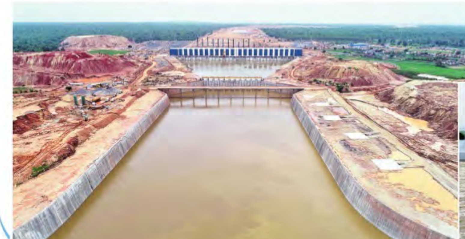
గోదావరి నీరు వచ్చి చేరడంతో జలకళ సంతరించుకొన్న కన్నెపల్లి పంప్ హౌస్.. (ఇన్ సెట్) కన్నెపల్లి పంప్ హౌస్ లోని మాడు మోటర్లు ఎత్తిపోసిన నీరు గ్రావిటీ కెనాల్ లో పడుతున్న దృశ్యం

అల్పట్టి స్థిరంగా 1.10 లక్షల క్యూసెక్కుల ఇన్ ఫ్లో హైదరాబాద్/మహబూబ్ నగర్ ప్రధాన ప్రకాశం, సమస్త తెలంగాణ: కృష్ణాబేసిన్ లో ఎగువన ఉన్న అల్పట్టి వరద కొనసాగుతున్నది. రెండోజులుగా జలాశయానికి 1.10 లక్షల క్యూసెక్కుల ఇన్ ఫ్లో స్థిరంగా వస్తున్నది. దీంతో 129.72 టీఎంసీల సామర్థ్యం కలిగిన జలాశయాలో ప్రస్తుతం నీటి నిల్వ 88.78 టీఎంసీలకు చేరుకున్నది. మరో 46 టీఎంసీలు వస్తే పూర్తిగా అంతా నిండనున్నది. ఇందుకు ఇదాదురోజులు పట్టే అవకాశం ఉన్నది. ఈ నేపథ్యంలో శనివారం నుంచి దిగువన నారాయణపూర్ కు 5628 క్యూసెక్కుల జలాల్ని వదులుతున్నారు. కృష్ణా ఉపనది ఉజ్జయినిలో స్వల్పంగా ఇన్ ఫ్లో తగ్గి 19,585 క్యూసెక్కులూ కొనసాగుతున్నది. 117.24 టీఎంసీల సామర్థ్యం ఉన్న ప్రాజెక్టులో ప్రస్తుతం 44.30 టీఎంసీల నీటిని నిల్వ ఉన్నది. వరద ఉధృతి పెరిగి, ప్రాజెక్టు ఉండితే దిగువకు నీటి విడుదలచేసే అవకాశం ఉన్నది. భీమాకు ఈ విధాది బాగానే వరదలు వచ్చే అవకాశం ఉందని అధికారులు అంచనా వేస్తున్నారు. అల్పట్టి, నారాయణపూర్, భీమా నుంచి వరద కొనసాగితే జలాలు ప్రాజెక్టు తగ్గరగానే పూర్తి సామర్థ్యానికి చేరుకునే అవకాశం కనిపిస్తున్నది. తుంగభద్రలో వరద స్వల్పంగా పెరిగింది. ప్రస్తుతం తుంగభద్ర ద్వారా 26945 క్యూసెక్కుల వరద వస్తున్నట్లుగా అధికారులు తెలిపారు.