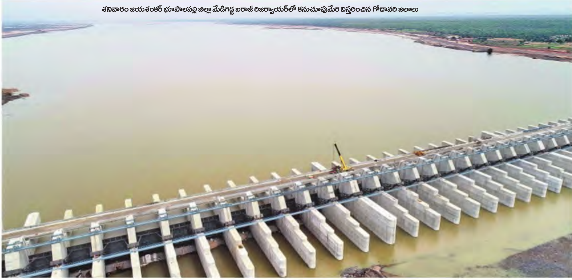
శనివారం జయశంకర్ భూపాలవల్లి జిల్లా మేడిగడ్డ బరాజ్ లిజియోయర్ లో కనుచూపుమేర విస్తరించిన గోదారం జలాలు