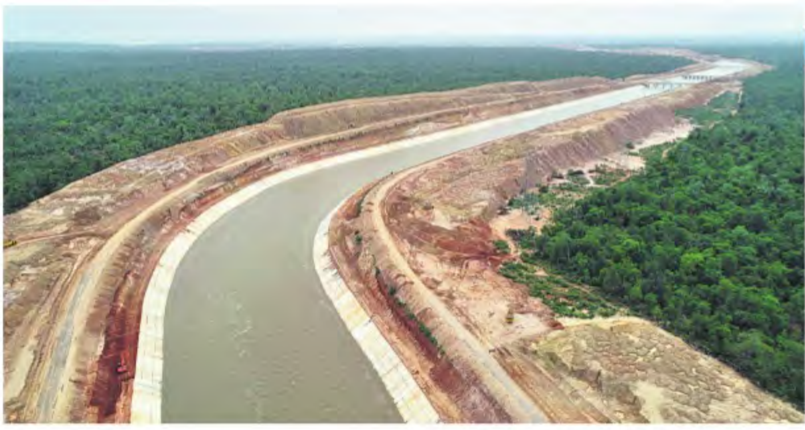
కన్నెపల్లి పంప్ హౌస్ నుంచి కెనాల్ ద్వారా అన్నారం బరాజ్ కు తరలివెళ్తున్న గోదావరి జలాల