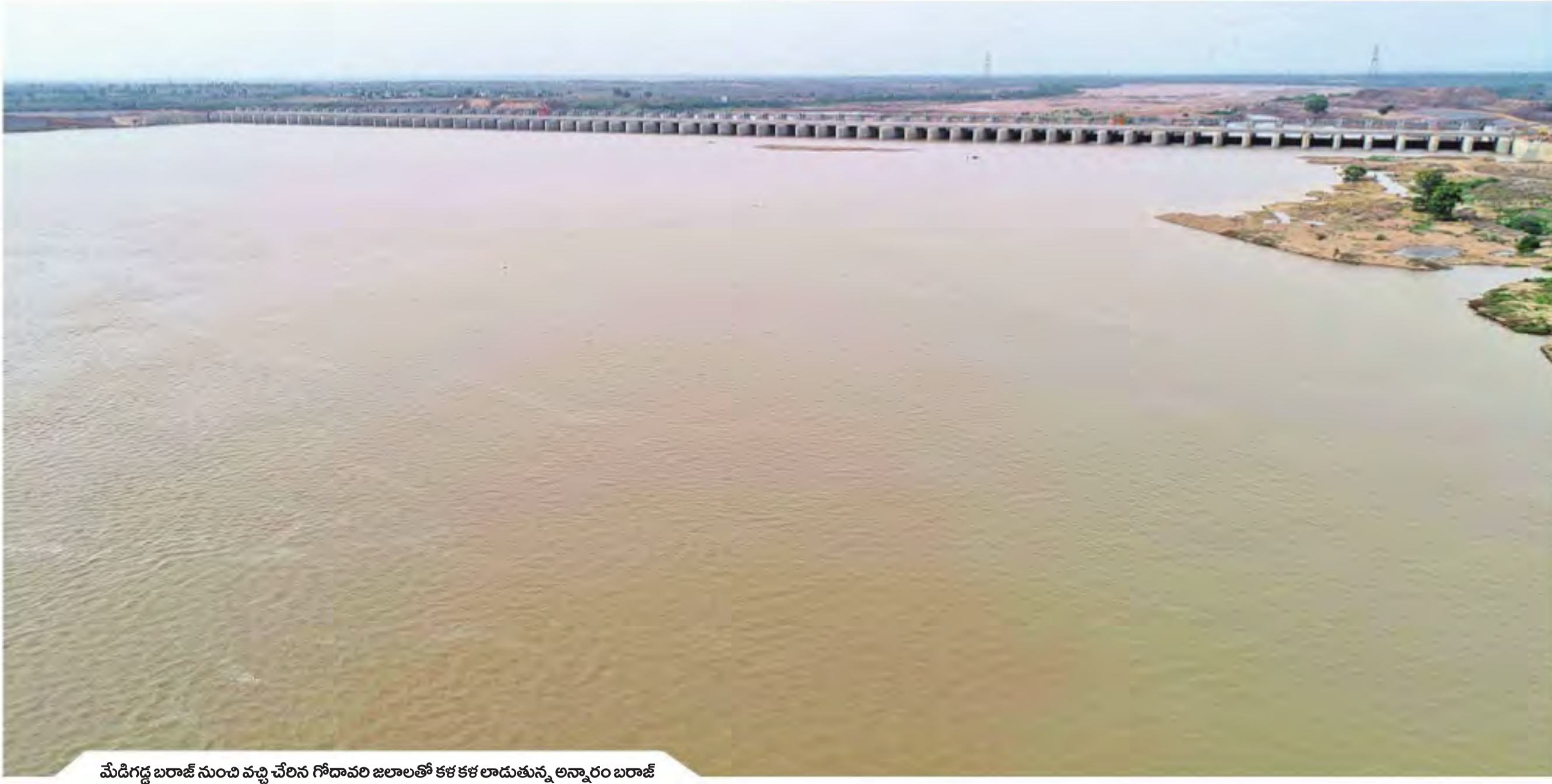
మేడిగడ్డ బరాజ్ నుంచి వచ్చి చేరిన గోదావరి జలాలతో కక కక లాడుతున్న అన్నారం బరాజ్