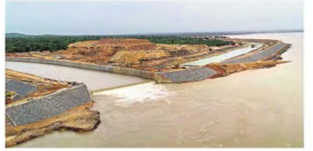
కన్నెపల్లి నుంచి ఎత్తిపోసిన నీరు గ్రావిటీ కాల్స్ ద్వారా అన్నారం బరాజ్ కు చేరుకొంటున్న దృశ్యం