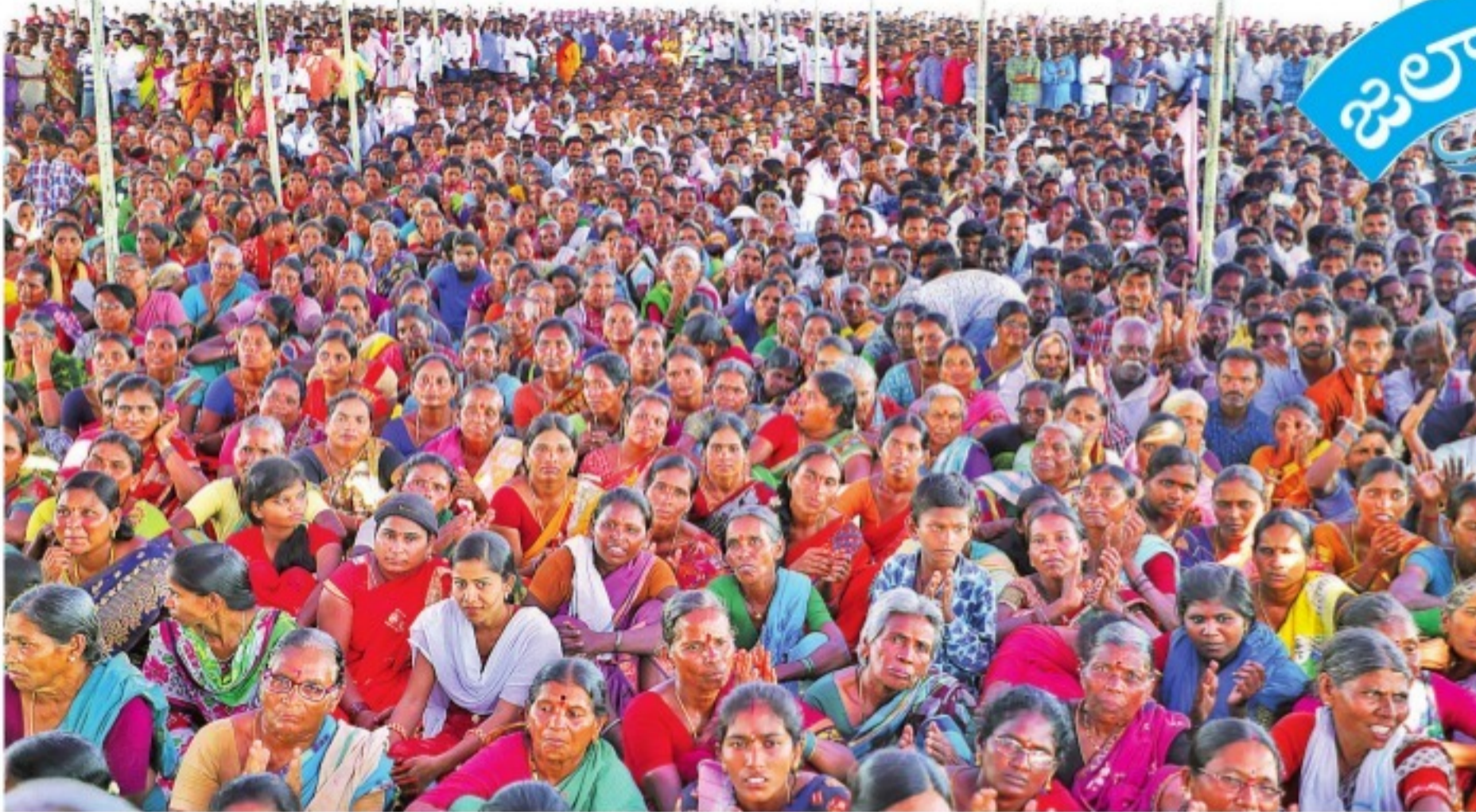
మంచురాల జిల్లాలోని అన్నారం బరాజ్ వద్ద నిర్వహించిన కాళేశ్వరం జల జాతర కార్యక్రమంలో పెద్దఎత్తున పాల్గొన్న ప్రజలు