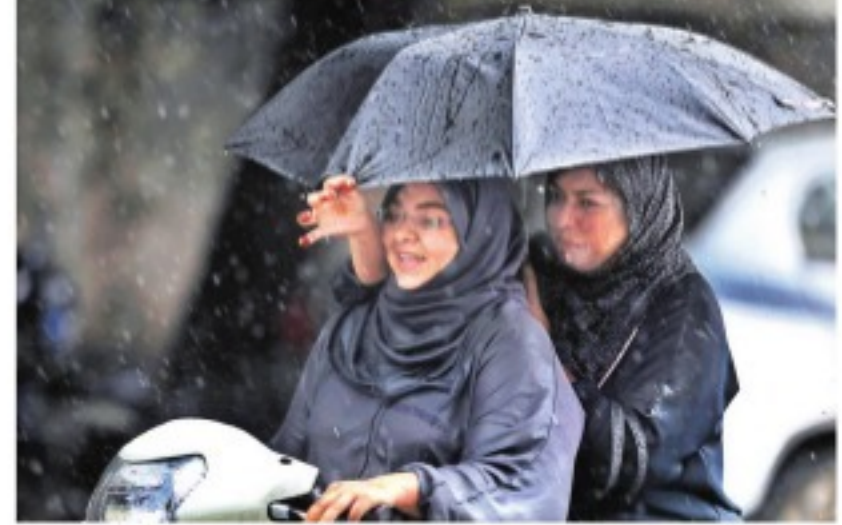
మంగళవారం హైదరాబాద్ లో వర్షం కురుస్తుండగా స్కూల్ బస్సు గొడుగుపట్టుకుని వెళ్తున్న మహిళలు. రాజధానిలో కురిసిన వానకు వాతావరణం ఒక్కసారిగా అభిరక్షకంగా మారింది.