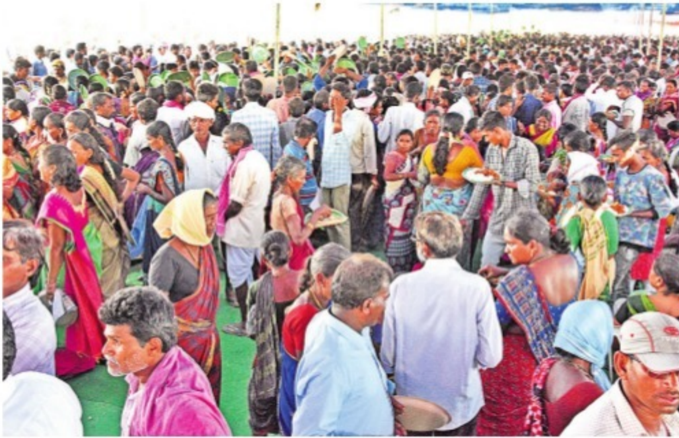
మంగళవారం అన్నారం బరాజ్ వద్ద జల జాతర కార్యక్రమంలో భాగంగా వనభోజనాలు చేస్తున్న డ్యూటర్లు

నిడుకుండును తలపెట్టిన అన్నారం బరాజ్ వద్ద మంగళవారం జల జాతర పనులు జరిపిన జాతర నిర్వహించారు. ఎదురేగి వచ్చిన గోదావరి జలాలు పూజలుచేసి, అక్కడే వన భోజనాలు చేయాలని చెన్నూరు ఎమ్మెల్యే బాల్యసుమన్ పిలుపుతో వేల కుటుంబాలు తరలి వచ్చాయి. డష్టల చప్పట్లు, బోనాలతో అన్నారం బరాజ్ వద్ద పండుగ వాతావరణం నెలకొన్నది.