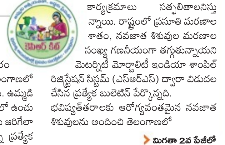
మిగతా 2వ పేజీలో

హైదరాబాద్, నమస్తే తెలంగాణ: ప్రత్యేక రాష్ట్రం ఏర్పడిన నాటినుంచి ముఖ్యమంత్రి కే చంద్రశేఖర్ రావు నాయకత్వంలోని ప్రభుత్వం వైద్యరంగంలో తీసుకువస్తున్న మార్పులతో తెలంగాణలో మాతాశిశు మరణాల రేటు తగ్గుతున్నది. ఉమ్మడి రాష్ట్రంలో పేదలు పడ్డ అవస్థలను దృష్టిలో ఉంచు కొని ప్రభుత్వ దవాఖానాల్లో ప్రసవాల జరిగితే తెలంగాణ ప్రభుత్వం అనుబంధ ప్రత్యేక కార్యక్రమాలు సత్ఫలితాలనిస్తున్నాయి. రాష్ట్రంలో ప్రసూతి మరణాల శాతం, నవజాత శిశువుల మరణాల సంఖ్య గణనీయంగా తగ్గుతున్నాయని మెట్రోటి మోర్టాలిటీ ఇండియా శాంపిల్ రిజిస్ట్రేషన్ సిస్టమ్ (ఎన్ఆర్ఎస్) ద్వారా విడుదల చేసిన ప్రత్యేక బులెటిన్ పేర్కొన్నది. భవిష్యత్ కాలం ఆరోగ్యవంకమైన నవజాత శిశువులను అందించి తెలంగాణలో