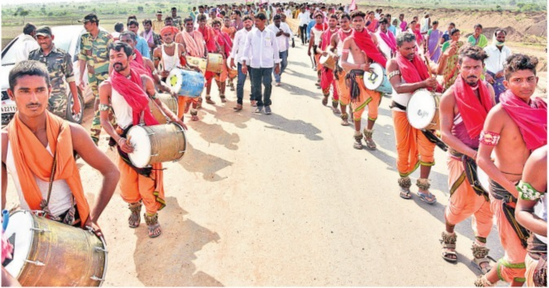
అన్నారం బరాజ్ వద్ద గోదావరి జలాలను తిలకించేందుకు వస్తున్న ప్రజలకు స్వాగతం పలుకుతూ కళాకారుల విన్యాసాలు