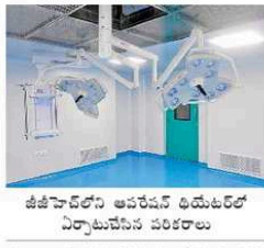
జేజీహెచ్ఎల్ ఆఫ్ సర్వీస్ డివీజన్ కిట్ విస్తారాలను పరిశీలించిన సీఎంకెడబ్ల్యు

ఎన్ఎమ్సీ) కాపురం చేస్తుండటం మిమ్మల్ని ఆనందపరుస్తుంది. అనుమతులు ఉన్నాయి.. జేజీహెచ్ఎల్ కేంద్రం నిర్మించిన శస్త్రచికిత్స గదులను విశదీకరించే తీరుకొరకు పాపం కట్టించి, మర్యాదను సంతకం చేయాలి. డాక్టర్లు మరియు పారామెడికల్ సిబ్బందిని నియోజమానిని అంతర్గతంగా నియోజమాని చేయాలి. డాక్టర్లు 90 కోట్లకు నిర్మించాలి. అందుకు అనుమతులు ఉన్నాయి. శస్త్రచికిత్స అంతర్గతంగా నిర్మించాలి. అందుకు అనుమతులు ఉన్నాయి. శస్త్రచికిత్స గదులను నిర్మించాలి.