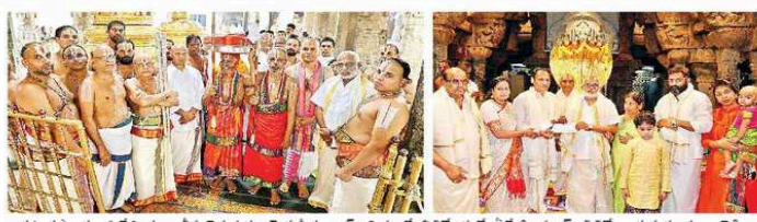
పట్టుపనిలను ఊరేగింపుగా తీసుకెళ్తున్న సెట్లకీయంగా...