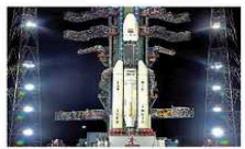
పారీస్ రెండో ప్రయోగం వేదికపై ఉన్న జీఎస్ఎల్వి-మార్కెట్-101