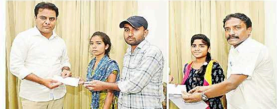
గురువారం తన నివాసంలో రుద్ద రవిన, అంబలలకు ఆర్థిక సహాయం అందించే ముఖ్యమంత్రి కేసీఆర్

తనాడు, హైదరాబాద్: ప్రభుత్వం ద్వారా ఇద్దరు విద్యార్థినులకు ఉన్నత చదువులకు ఆర్థిక సహాయం అందించాలని ముఖ్యమంత్రి కేసీఆర్ ఆదేశించారు. తనాడు, హైదరాబాద్: ప్రభుత్వం ద్వారా ఇద్దరు విద్యార్థినులకు ఉన్నత చదువులకు ఆర్థిక సహాయం అందించాలని ముఖ్యమంత్రి కేసీఆర్ ఆదేశించారు.