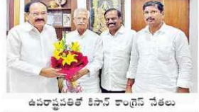
ఉపరాష్ట్రపతి కేసీఆర్ కాంగ్రెస్ సేతులు