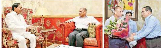
గవర్నర్ నరసింహారెడ్డి కేటీఆర్ గవర్నర్ కలిగిన సీఎం సందేశానికి కేటీఆర్

తనాడు, హైదరాబాద్: రాష్ట్రం వెళ్ళినప్పుడు వరా భావం సమర్థంగా ఎదుర్కొంటామని ముఖ్యమంత్రి కేసీఆర్ గవర్నర్ నరసింహారెడ్డిని తెలిపారు. వచ్చే నెలలో ఆలు వజ్రం కుడుముకుండా అభివృద్ధిని తెస్తామని, రాష్ట్రం నగరాన్ని, పట్టణాలను సమగ్రంగా అభివృద్ధి చేసే కొత్త పురపాలక చట్టాన్ని దాఖలు చేసినట్లు తెలిపారు. పురపాలక అవసరాలను అన్ని వయస్సుల వారినూ, రాష్ట్రం అభివృద్ధి కోసం సాగు చేసే అభివృద్ధి కోసం ప్రణాళికలను, అభివృద్ధి యోజనలను బాగా పరిశీలించి చట్టం ద్వారా సాధించాలని ముఖ్యమంత్రి తెలిపారు. గురువారం రాత్రి ముఖ్యమంత్రి కేసీఆర్ గవర్నర్ కేటీఆర్ కలిగిన సమావేశం జరిగింది.