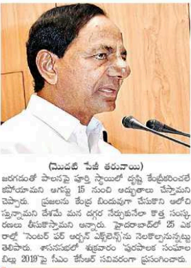
(ముద్రణ చేసే తరువాత)

జనరలతో పాటునే పూర్తి స్థాయిలో ప్రజల కేటాయింపులతో ప్రజాపాటుగా అగస్టు 15 నుంచి ఆరంభమవుతున్న ప్రజాసభ ప్రణాళికను ప్రజలకు తెలియజేసేందుకు సమాచార కమిషనరు సీఎంఎస్ జిఎస్. ప్రజాసభను ప్రజలకు తెలియజేసేందుకు సమాచార కమిషనరు సీఎంఎస్ జిఎస్. ప్రజాసభను ప్రజలకు తెలియజేసేందుకు సమాచార కమిషనరు సీఎంఎస్ జిఎస్.