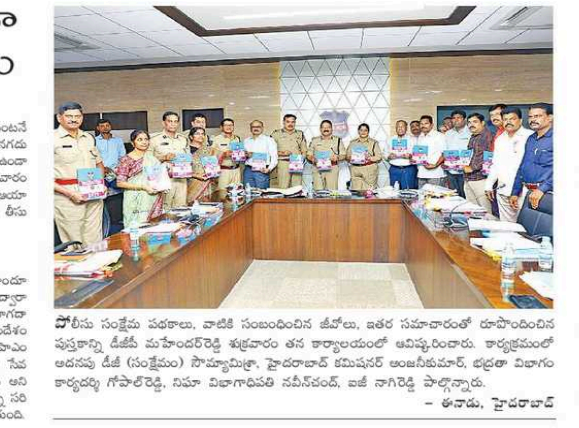
పాపం కోసం నగదు రహితంగా లబ్ధి కోసం ప్రజలకు తెలియజేసేందుకు సమాచార కమిషనరు సీఎంఎస్ జిఎస్.

అగకుండా సాగిపోవచ్చు ప్రజలకు తెలియజేసేందుకు సమాచార కమిషనరు సీఎంఎస్ జిఎస్.