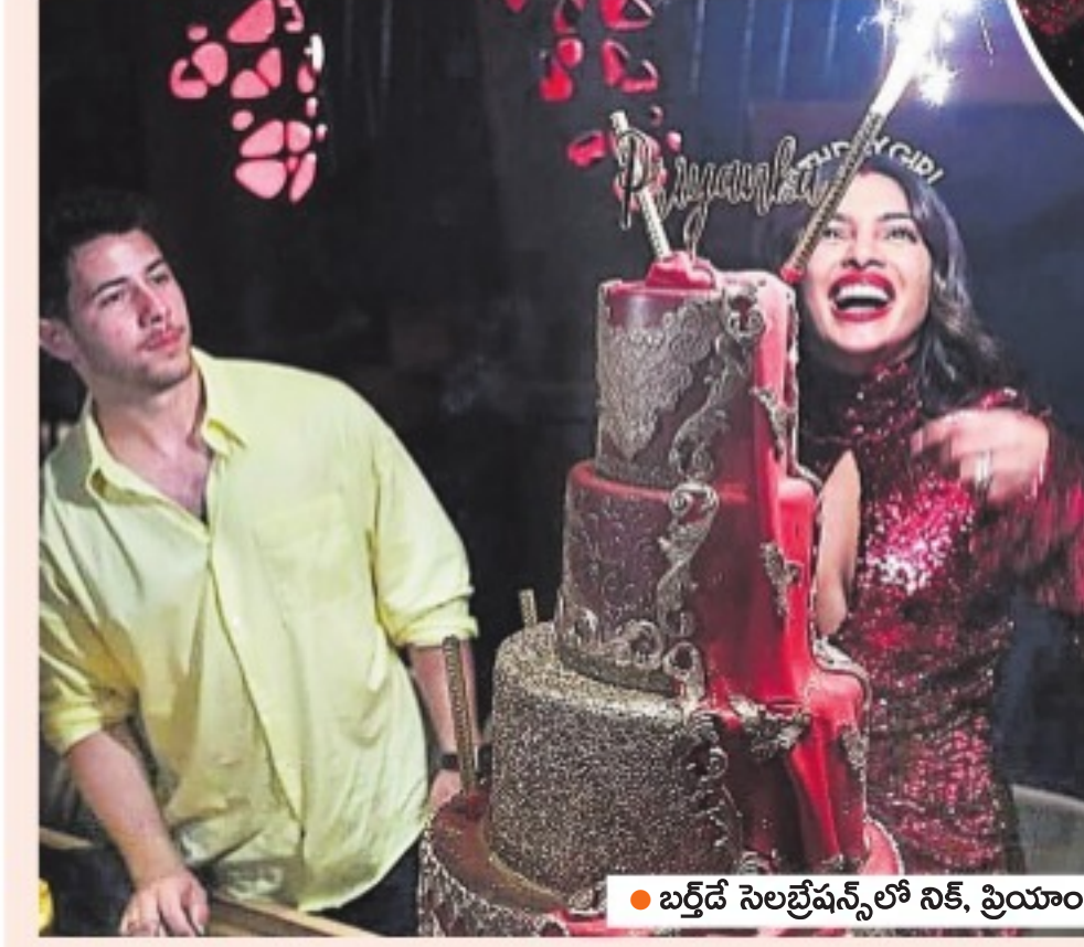
నిఖిల్ సెలబ్రేషన్ లో నిక్, ప్రయోంకా

వివాహం తర్వాత జరిగిన తన తొలి పుట్టినరోజు (18 జూలై) వేడుకలను ఘనంగా జరుపుకున్నారు బాలీవుడ్ బ్యూటీ ప్రయోంకా చోప్రా. అమెరికాలోని మియూమిలో ఈ పుట్టినరోజు వేడుకలు జరిగాయి. భర్త నిక్ జోనస్, కజన్ పరిగీతీ చోప్రాతో పాటు ప్రయోంకా బంధుమిత్రులు పాల్గొన్నారు. అన్నట్లు... ఈ ఏడాదిలో ప్రయోంకా 37 వయసలో మరణించిన గుర్తు చేసుకున్నారు.