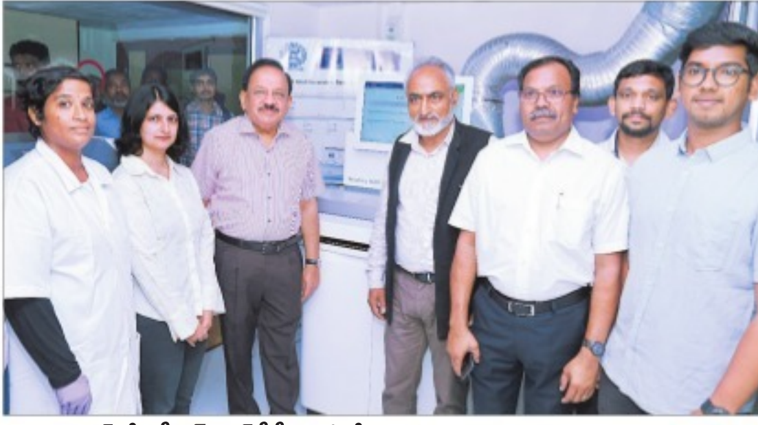
హైదరాబాద్లోని సీసీఎంబీలో జన్మ్యుక్రమ నమోదు యంత్రాన్ని ఆవిష్కరిస్తున్న కేంద్ర మంత్రి హర్షవర్ధన్. చిత్రంలో సీసీఎంబీ శాస్త్రవేత్తలు

సాక్షి, హైదరాబాద్: అత్యంత కౌశల ఇవ్వాలని ఆరుదైన జన్మ్యువ్యాధులను అతివేగంగా గుర్తించవచ్చని కేంద్ర శాస్త్ర, సాంకేతిక పరిజ్ఞాన, వైద్య శాఖల మంత్రి హర్షవర్ధన్ తెలిపారు. హైదరాబాద్లోని సీసీఎంబీలో సీసీఎంబీలో రూ.8 కోట్లతో ఏర్పాటు చేసిన అత్యాధునిక జన్మ్యుక్రమ నమోదు యంత్రాన్ని కేంద్ర మంత్రి శనివారం ఆవిష్కరించారు. ఈ సందర్భంగా ఆయన మాట్లాడుతూ.. జన్మ్యువైద్యక అధికంగా ఉన్న మనదేశంలో అరుదైన జన్మ్యువ్యాధుల గుర్తింపును వేగవంతం చేసేందుకు జన్మ్యుక్రమ నమోదు యంత్రం ఉపయోగపడుతుందని ఆయన తెలిపారు. మరో మాట్లాడుతూ సరికొత్త భారతాన్ని నిర్మించాలన్న ప్రధాని నరేంద్రమోడి