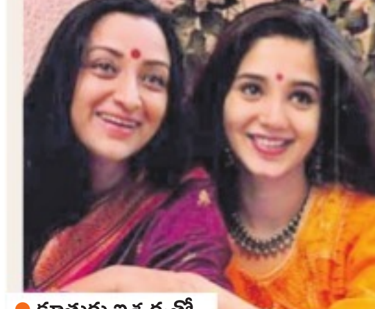
● కూతురు వాళ్ళతో...

● తల్లికి తగ్గ తనయ అనిపించుకుంటుందని మీ కుమార్తె ఇక్కడ నటిగా వచ్చినప్పుడు చాలా మంది ఊహించారు. మీ అంత స్వార్థం ఆడకో పోయినందుకు మీకేమీ బాధ ఉంటుందా? మీ అమ్మ చేసిన పనులే మీరు చేస్తున్నారా? లేదు కదా. ప్రపంచంలో అందరికీ స్వలం ఉంటుంది. అయితే ఎవరు ఎక్కడ ఉంటారో స్వది మనం చెప్పలేం. ఎండే ఆఫ్ ది డే వాళ్ళ సంతోషమే ముఖ్యం. వాళ్ళ సంతోషానికి ఏ కొరకార లేనప్పుడు మనం బాధపడాలి అవసరం లేదు. ఒకవేళ అమ్మాయి ఇలా తాలేదంటే? అనుకుంటే ఆ బాధ నన్ను లాగి కిందపడే స్వంది. నాకు బీబీ లేదు, మగలే లేదు. హాయిగా, ఆరోగ్యంగా ఉన్నాను. ఇప్పటి ఆరో చిన్న బీబీ, మగలే అన్నీ వస్తాయి. అందుకే ఏదీ ఆలోచించను.