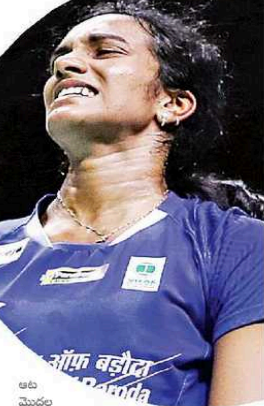
సింధుకు అలాంటి ఓటమి ఉండకపోయింది. సింధుకు అలాంటి ఓటమి ఉండకపోయింది...