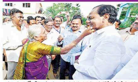
ముఖ్యమంత్రి కేసీఆర్ ను ఆస్కారంగా పలకరిస్తున్న గుంటూరు రామచంద్ర రేడియో సీమీటీ మంగళం

రాష్ట్రమంతా ప్రతి ఒక్కరికీ వైద్య పరీక్షలు