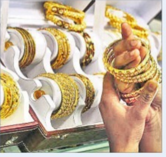
శ్రీత పెట్టుబడి మార్గమైన బంగారం వైపునకు మళ్లడమే డిమాండ్ పెరగడానికి ప్రధాన కారణంగా