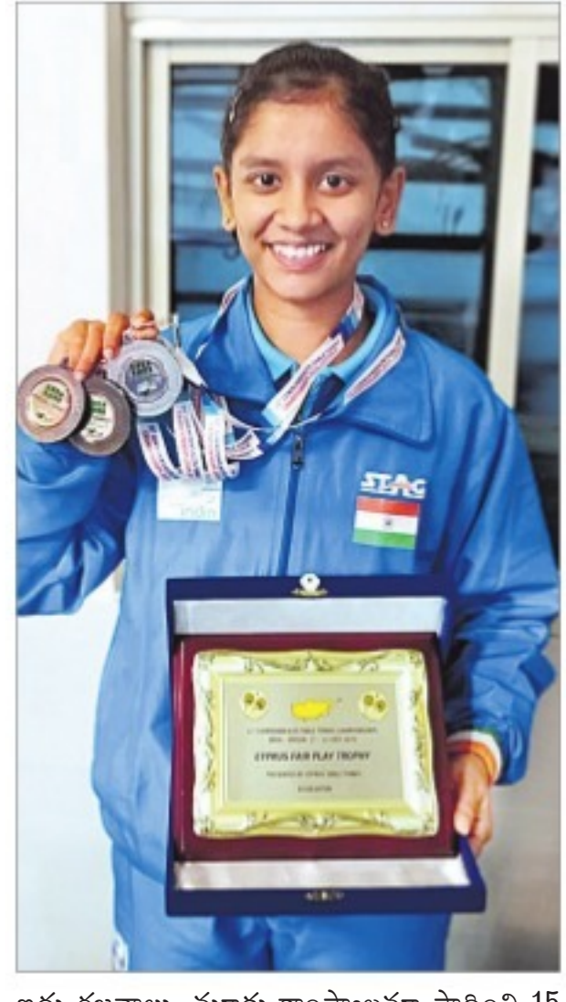
ఐదు రజతాలు, మూడు కాంస్యాలనూ సాధించి 15 పతకాలతో అదభుతంగా... 1975లో ఇండోన్ తర్వాత కామన్వెల్త్ టీటీ చాంపియన్ షిప్ లో అన్ని విభాగాల్లో పసిడి పతకాలు నెగ్గిన జట్టుగా భారత్ రికార్డు నెలకొల్పింది.