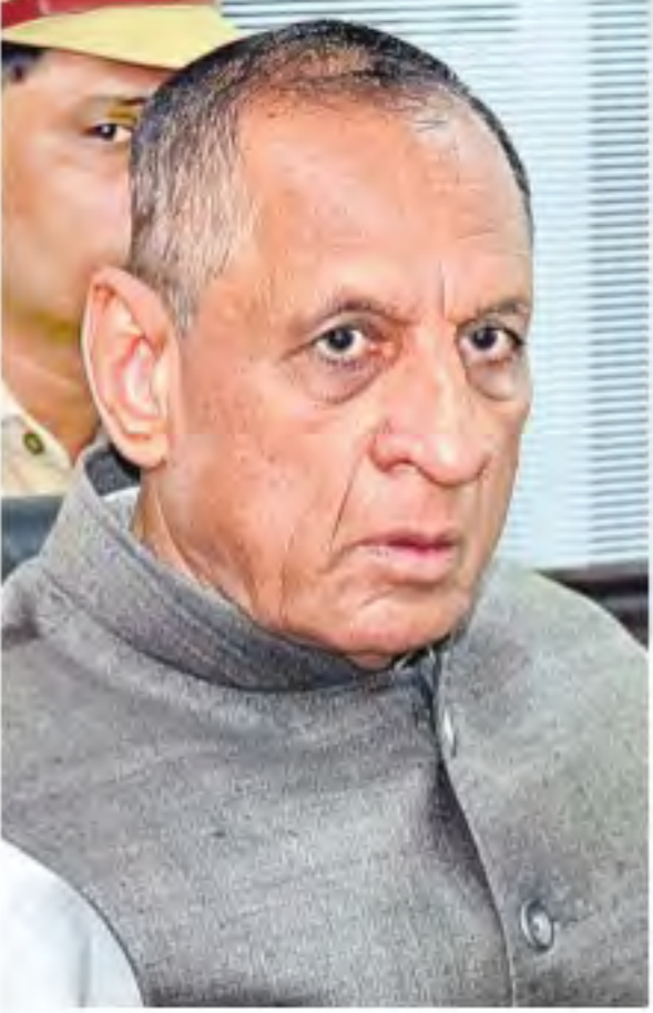
సాక్షి, హైదరాబాద్: నూతన పురపాలక బిల్లుపై గవర్నర్ ఈఎన్ఎల్ నరసింహన్ అభ్యంతరం వ్యక్తం చేశారు. రాజ్యాంగ సూక్తికి విరుద్ధంగా ఉన్న ఓ క్లాజును బిల్లు నుంచి తొలగించాలని రాష్ట్ర

మున్సిపల్ బిల్లుకు గవర్నర్ నరసింహన్ 'సవరణ'!