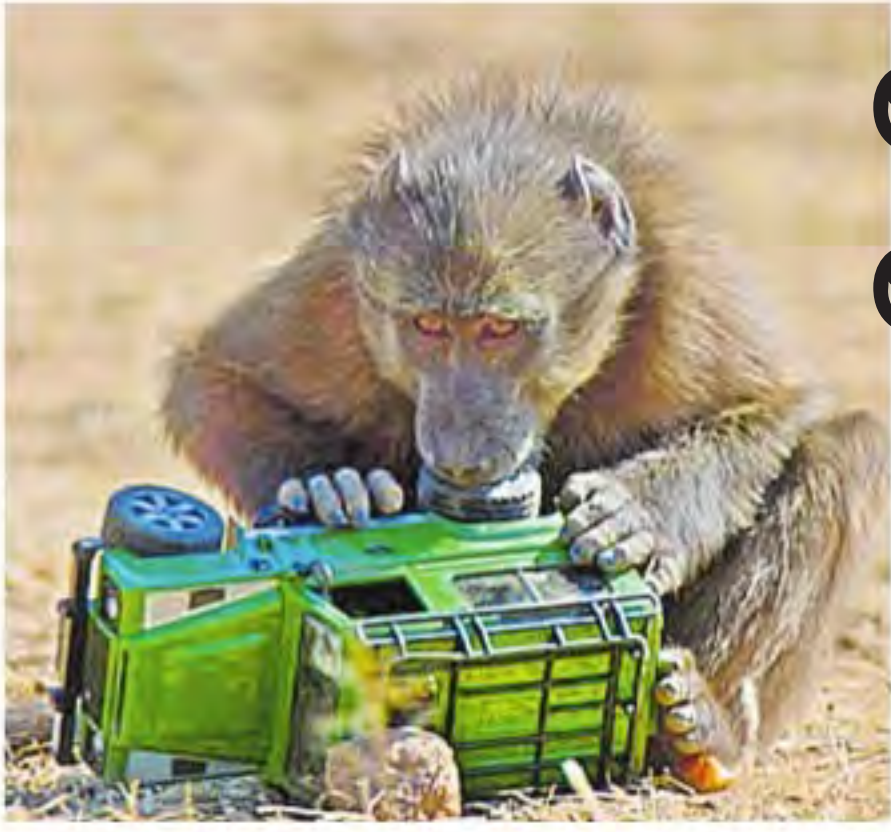
ట్రక్కు బొమ్మతో ఆటలుచూడకుండా మగ బబూస్ కోటి పిల్ల

బొమ్మలతో ఆడుకోవడమంటే చిన్న పిల్లలకు సరదా.. వాటిని చూడగానే ఎంత మారాం చేసే వారైనా నిమిషంలో అట్టే సైలెంట్ అయిపోతారు. సంవత్సరం లోపు వయస్సున్న పిల్లలకు దాదాపు గిలక్కాయ వంటి చప్పడు చేసే వస్తువులు ఇస్తుంటాయి. ఆ వస్తువుల్లో పెద్ద తేడా ఉండదు. కానీ వాళ్లు పెరుగుతున్న కొద్దీ వారు ఆడుకునే బొమ్మల్లో తేడా వస్తుంటుంది. ఆడ పిల్లలైతే బార్బీ బొమ్మలు, టిడ్లీ బేర్, కివెస్ సెట్లు, పెళ్లి కూతురు బొమ్మలను 'ఇస్తుంటాయి'. అదే మగ పిల్లలయితే కాల్లు, బైకులు, ట్రాక్టర్లను 'ఇస్తుంటాయి'.. అంతేనా..? మనమే ఇస్తుంటామా.. లేదా వారే అలా కోరుకుంటారా..? ఇలా బొమ్మలను ఎంచుకోవడం, ఆడ, మగ పిల్లలు వేరుగా పెరగడంలో సహజం పాత్ర ఏమైనా ఉందా.. లేదా సహజంగానే ఆ ఎంచుకో జరుగుతోందా..? ఇదే విషయాన్ని తెలుసుకునేందుకు కొన్ని జంతువులపై బీబీసీ ప్రయాగం జరిపింది. ఎంపికలో తేడా అనేది అనాదిగానే ఉద్భవించి, మనుషుల్లోనే కాదు జంతువుల్లో కూడా ఇలాంటి ప్రవర్తనే ఉంటుందని ఈ పరిశోధనల్లో తెలిసింది.