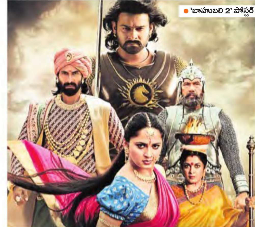
'బాబులలి 2' పోస్టర్