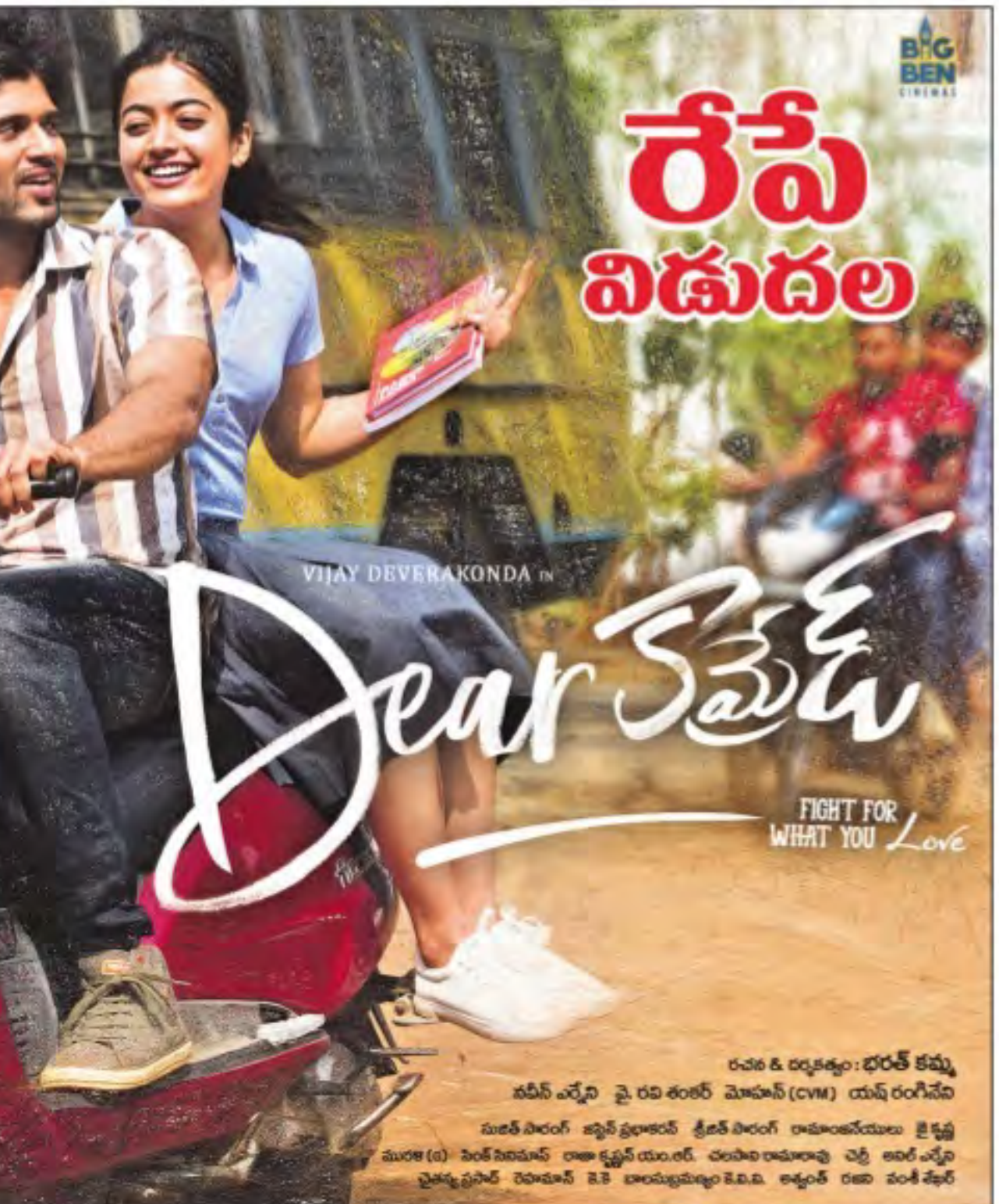
విజయ్ తాజాగా కొత్త సినిమాని తెరకెక్కించనున్నారు.