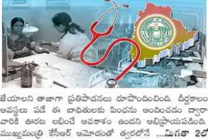
జేవాలని తాజాగా ప్రతిపాదనలు రూపొందించినది. ద్వితీయ అవసరం వేదకం అందించిన సుమారు 150 మంది చేస్తున్నాం. అలాగే సీట్ విడుదల అందరికీ త్వరలో, తెలంగాణ రాష్ట్రాల్లోని కృష్ణా పరిపాలనలోని ప్రజలను అభివృద్ధి...మిగతా 2 త

అనారోగ్యంతో అనుభవించే... కేవలం ఆరోగ్య శ్రీ వేదకం కాబితాలో వేర్వేరు జబ్బు లేని కారణంగా చికిత్సకు నిరాశించిన వారు ఇక భయపడక. ఏ జబ్బుతో అనుభవించిన ఆరోగ్య శ్రీ వేదకం చైర్మన్ గృహ కీలక నిర్ణయం తీసుకుంది. గిరిజన ఆశ్రమ పాఠశాలలో అనుభవించుకున్న సుమారు లక్ష మంది విద్యార్థులకు ఆరోగ్య శ్రీ వేదకం అందించాలని నిర్ణయించింది. ఆ ముందుగా గిరిజన సంక్షేమ శాఖలో త్వరలో వైద్యారోగ్య శాఖ ఉపవ్యవస్థాపక చైర్మన్ జబ్బుతో తోడవాలి. సాగే వేదకం అందించిన సుమారు 150 మంది చేస్తున్నాం. అన్ని చికిత్స వైఫల్య కారణాలకు నివారణ పరిష్కారం వర్తింపు