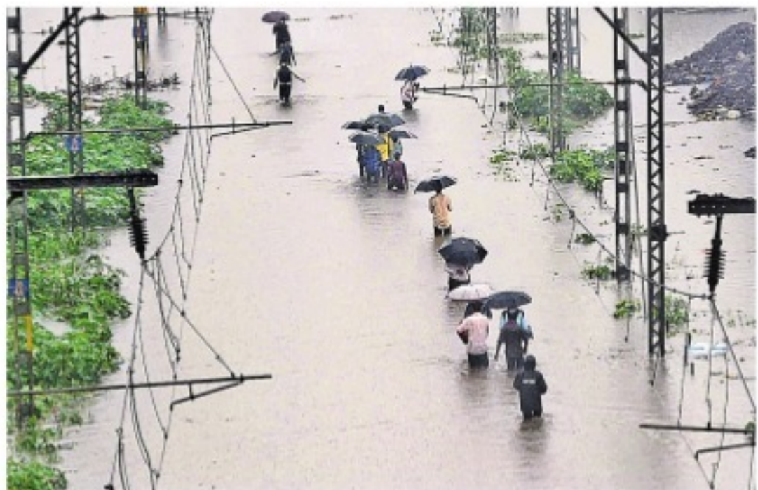
మంగళవారం ముంబైలోని లిలీకనగర్ రైల్వే స్టేషన్ వద్ద మొలలోతు నీళ్లలో నిడిచివెళ్తున్న ప్రజలను

కనిపించాయి. పలుచోట్ల వర్షం నీటి ధాటికి కాళ్లు కొట్టుకుపోయాయి. ప్రత్యేకించి మురికివాడల్లో భీతాపహ పరిస్థితులు నెలకొన్నాయి. మలాడ్ ప్రాంతంలో ఓ గోడ కూలి 21 మంది దుర్మరణం పాలయ్యారు. మరో 78 మంది గాయపడ్డారు. ఇదే ప్రాంతంలో ఓ సబ్వే కిందికి కారులో వెళ్లి పరద నీటిలో చిక్కుకున్న ఇద్దరు వ్యక్తులు వాహనంలోనే మరణించారు. వర్షాల కారణంగా మహారాష్ట్ర అంతటా మంగళవారం జరిగిన వేర్వేరు ప్రమాదాల్లో 95 మంది మృతి చెందారు. మరో రెండురోజులపాటు వర్షాలు ఇదే రీతిలో కొనసాగుతాయన్న వాతావరణ విభాగం హెచ్చరిక సేవద్వారా నగర ప్రజలు బీభత్సానికి ముందున్నారు.