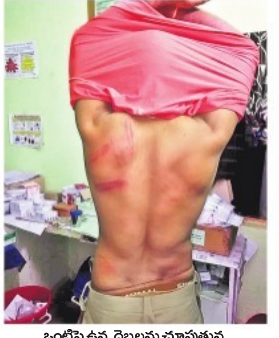
బండ్లపై ఉన్న దెబ్బలను చూపుతున్న ఫారెస్టు అధికారి

ఆరుగురు అధికారులకు గాయాలు న్యూడెమోక్రసీ ప్రాద్దలంతోనే దాడి • పోలీసులకు ఫారెస్టు సిక్స్ ఆఫీసర్ ఫిర్యాదు పన్నెండుమంది గిరిజనులపై కేసు నమోదు