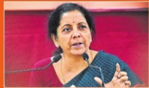
వృద్ధి పరుగే ప్రధాన లక్ష్యం ఆర్థిక వ్యవస్థపైనే అధికంగా దృష్టిపెడతాం ఆర్థిక మంత్రి నిర్మలా సీతారామన్ -జనసేనలో