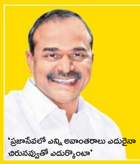
'ప్రజాసేవలో ఎన్ని అవకాశాలు ఎదురైనా చారునవ్వతే ఎదుర్కొంటా'