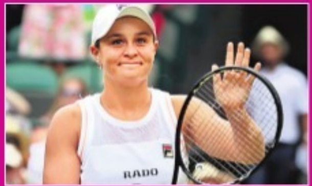
రెండో రౌండ్లో బాట్లీ వింబుల్డన్లో ముందంజ వేసిన వరల్డ్ నంబర్ వన్ -స్కోర్ట్స్లో