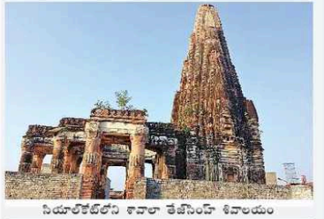
నియోలిథిక్ కాలానికి చెందిన శివాలయం

రాజ్ 9 వరకు స్వాతంత్ర్యం దర్శనభాగ్యం ఢిల్లీ: మనదేశంలోని ప్రతి ప్రాంతాల్లోనూ వివిధ రకాల ప్రభుత్వ సంస్థలను ఏర్పాటు చేసే ప్రయత్నం చేస్తున్నారు. రాజ్ 9 వరకు స్వాతంత్ర్యం దర్శనభాగ్యం.