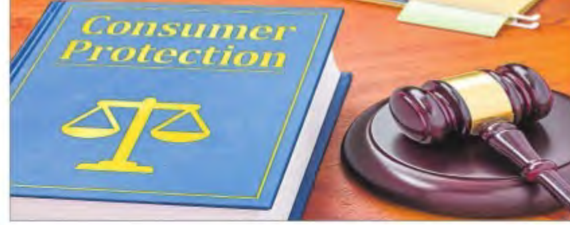
మైన సంస్థలపై చర్యలు తీసుకునేందుకు బిల్లు కల్పించారు. లాభదాయక అవసరం అధికారం సీపీఎంకు ఉంది. వినియోగదారుల వివాదాల పరిష్కారానికి ఏర్పాటుయ్యే జిల్లా కమిషన్లు రూ.కోటి, రాష్ట్ర కమిషన్లు రూ.10 కోట్ల వరకు, జాతీయ కమిషన్ రూ.10 కోట్ల జలున్నాయి. ప్రకటనలలో తప్పుదోవ పట్టిన

బిల్లుకు లోక్ సభ ఆమోదం న్యూఢిల్లీ: వినియోగదారులకు మరిన్ని హక్కులు కల్పించేందుకు ఉద్దేశించిన కన్సూమర్ ప్రొటెక్షన్ బిల్లు-2018కు మంగళవారం లోక్ సభ ఆమోదం తెలిపింది. ఈ బిల్లు ద్వారా వస్తువులు, సేవల్లో లోపాలకు సరిపాటుగా వినియోగదారుల ఫిర్యాదులపై వెంటనే పరిష్కారం జరిగేలా చర్యలు తీసుకోవాలని ప్రభుత్వం కోరుకుంటుంది. వినియోగదారుల ఫిర్యాదులపై నిర్ణయం తీసుకోవాలని ప్రభుత్వం కోరుకుంటుంది. వినియోగదారుల ఫిర్యాదులపై నిర్ణయం తీసుకోవాలని ప్రభుత్వం కోరుకుంటుంది. వినియోగదారుల ఫిర్యాదులపై నిర్ణయం తీసుకోవాలని ప్రభుత్వం కోరుకుంటుంది.