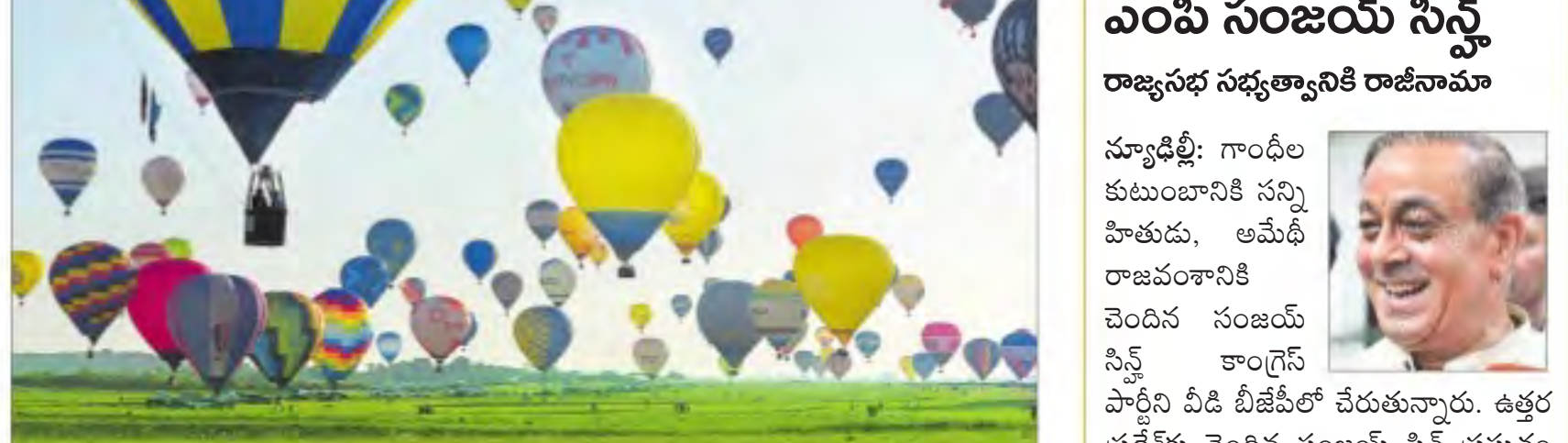
60 నిమిషాలపై 400లకుపైగా హాజీ ఎయిర్ బెయిల్లను ఎగిరిన ప్రపంచ రికార్డు సృష్టించే ప్రయత్నం చేస్తున్న ఫ్రాన్స్ వాసులు. తూర్పు ఫ్రాన్స్ హాగ్ లెబోర్ తీసింది ఫాటో.