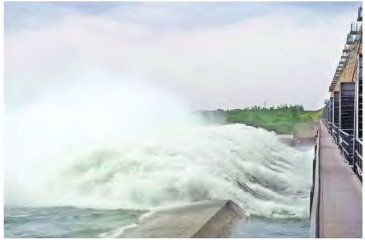
మంగళవారం నారాయణపూర్ గేట్లు తెరవడంతో జూరాలకు విడుదలవుతున్న కృష్ణా వరద