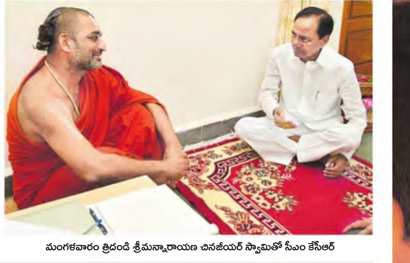
మంగళవారం త్రిందే శ్రీమన్నారాయణ చినజయిర్ స్వామి తో సీఎం కేసీఆర్

యాదాద్రిలో త్వరలోనే ఘనంగా నిర్వహించాలని సీఎం కేసీఆర్ నిర్ణయం యాగం నిర్వహణపై త్రిందే చివరి నిర్ణయం తీసుకోవాలని చర్యలు సాక్షి, హైదరాబాద్: త్వరలో యాదాద్రిలో మహా సుదర్శన యాగాన్ని నిర్వహించాలని ముఖ్యమంత్రి కె.చంద్రశేఖరరావు నిర్ణయించారు. యాగం నిర్వహణ, ఏర్పాట్లకు సంబంధించి త్రిందే తీసుకురావాలని చివరి నిర్ణయం తీసుకోవాలని చర్యలు చేపట్టారు. శంషాబాద్ మండలం ముచ్చింతల్ సమీపంలోని శ్రీరామనగరంలో ఉన్న మిగతా 2వ పేజీలో ▶