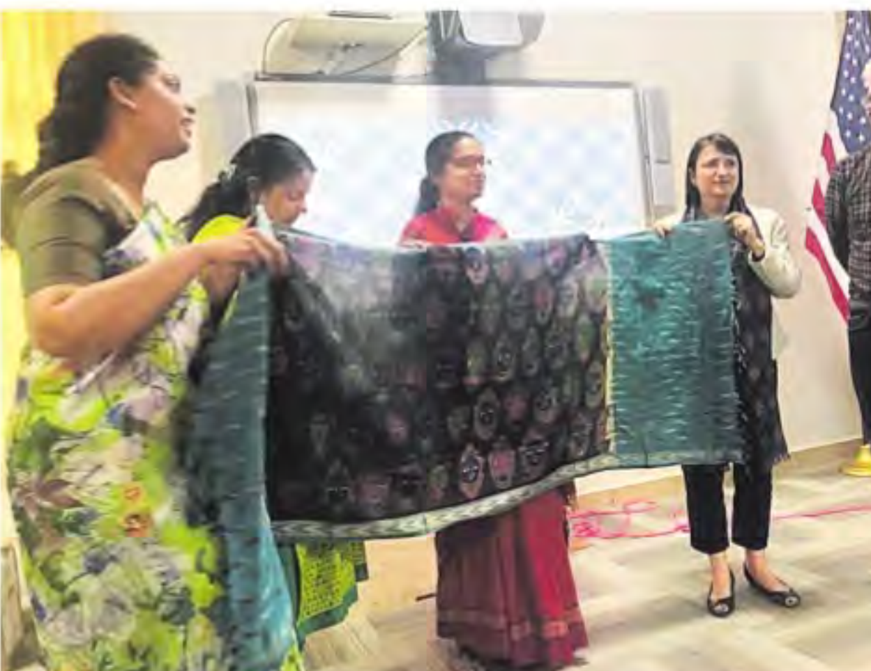
మంగళవారం అమెరికా కాన్సులే జనరల్ కేథరిన్ హడ్డాకు చీరను బహూకరిస్తున్న ఉద్యోగినులు

ప్రభుత్వ మెడికల్ కాలేజీలకు చెందిన 15 కాతం నేషనల్ పూల్ సీట్లకు పోటీ పడతారు. ఆ ప్రకారం తెలంగాణకు చెందిన 10 ప్రభుత్వ మెడికల్ కాలేజీలకూ జాతీయస్థాయిలో బాండ్ ర్యాంకులు పొందిన వారు కూడా పోటీ పడతారు. రాష్ట్రానికి చెందిన జాతీయ బాండ్ ర్యాంకు గాండ్, ఉన్నాయి. జాతీయ పంజీ ప్రముఖమైన కాలేజీలలో వేరి ఉండచ్చని అంచనా. మిగిలిన 67 సీట్లు పెద్దగా పేరులేని ప్రభుత్వ మెడికల్ కాలేజీకి చెందినవే ఉంటాయని అంటున్నారు. ఏ ప్రభుత్వ మెడికల్ కాలేజీలకు చెందిన సీట్లు మిగిలాయన్న వివరాల జాబితా ఇంకా తయారు చేయలేదని విశ్వవిద్యాలయం వర్గాలు చెబుతున్నాయి. ప్రస్తుతం ఈ సీట్లకు తోడు అగ్రవర్గ పేదల (ఈడబ్ల్యూఎస్) సీట్లకు కూడా మూడో విడత కొన్వెలింగ్ నిర్వహిస్తారు. ఈడబ్ల్యూఎస్ లో 190 ఎంబీబీఎస్ సీట్లకు కొన్వెలింగ్ నిర్వహిస్తున్నారని.