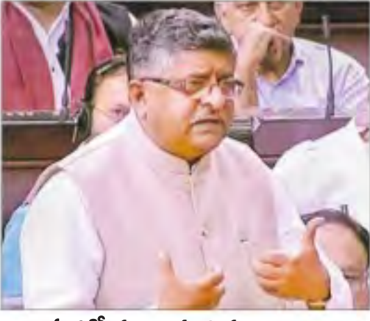
రాజ్యసభలో మాట్లాడుతున్న న్యాయశాఖ మంత్రి రవిశంకర్ ప్రసాద్ గౌడవలు పెట్టడానికి రాజకీయ దురుద్దేశంతో ఈ బిల్లును తెచ్చారని రాజ్యసభలో ప్రతిపక్ష కోసం ప్రజాస్వామ్య దేశమైన మసం ఎందుకు ఆ పని చేయకూడదని ప్రశ్నించారు. హిందూవుల్లోనూ బహుభార్యత్వం, పరకల్పం తదితర నేరాలకు జైలుశిక్ష ఉందని గుర్తుచేసిన రవిశంకర్ ఏ.. టీపుల్ తలార్ చెప్పే వారికి జైలు శిక్ష ఎంపించడాన్ని సమర్థించారు. ముస్లిం ఇళ్లలో

న్యూఢిల్లీ: ముస్లిం పురుషులు తక్షణం మూడు సార్లు తలార్ చెప్పి తమ భార్యలకు విడాకులు ఇవ్వడాన్ని (టీపుల్ తలార్ లేదా తలార్-ఏ-బిద్దత్తు) నేరంగా పరిగణించేలా కేంద్రం తీసుకొచ్చిన బిల్లును రాజ్యసభ మంగళవారం ఆమోదించింది. టీపుల్ తలార్ బిల్లును లోక్ సభ గతవారం ఆమోదనంతో ఈ బిల్లు పార్లమెంటులో పాస్ అయ్యింది. తలార్-ఏ-బిద్దత్తును ఎన్ఎంఎస్, వాటాను, రాతపూర్వకంగా, నోటి మాటల్ లేదా ఇతర ఏ మాధ్యం/పద్ధతిలోనైనా.. ఎలా చెప్పినా ఆ చర్యను ఈ బిల్లు నేరంగా పరిగణిస్తుంది. 'ముస్లిం మహిళల (వివాహ హక్కుల పరిరక్షణ) పేరిట తెచ్చిన ఈ బిల్లును ఎన్ఎంఎస్ భాగమైన జేడీయూ, అన్నా డీఎంకే పార్టీలు కూడా వ్యతిరేకించినప్పటికీ, తటస్థ పార్టీ అయిన బీజేపీ బిల్లుకు మద్దతు తెలిపింది. బిల్లును ఆమోదించడంపై ఓటింగ్ నిర్వహించగా 99 ఓట్లు ఆనుకూలంగా, 84 ఓట్లు వ్యతిరేకంగా పడ్డాయి. దీంతో రాజ్యసభలోనూ టీపుల్ తలార్ బిల్లు గట్టిపడింది. ఇక రాష్ట్రపతి అంతకం చేసిన అనంతరం టీపుల్ తలార్ బిల్లు చట్టరూపం దాల్చి, కేంద్రం గతంలో ఇచ్చిన ఆర్డినెన్స్ రద్దుపెట్టబడింది. బిల్లును ఆమోదించడంపై ఓటింగ్ కు ముందు.. అసలు ఈ బిల్లును రాజ్యసభ ఎంపిక కమిటీకి పంపాలో? వద్దా? అన్న దానిపై ప్రతిపక్షాల బలవంతంతో ఓటింగ్ నిర్వహించారు. ఎంపిక కమిటీకి పంపవద్దని 100 ఓట్లు, పంపాలని 84 ఓట్లు పడ్డాయి. టీపుల్ తలార్ బిల్లును ప్రధాని నరేంద్ర మోడీ నేతృత్వంలోని గౌరవ ప్రభుత్వమే తీసుకొచ్చి, లోక్ సభలో ఆమోదించేసుకున్నప్పటికీ, రాజ్యసభలో అది తిరస్కరణకు గురైంది. దీంతో రెండోసారి మోడీ ప్రభుత్వం ఏర్పడ్డా ఈ బిల్లును మరోసారి తీసుకురాగా,