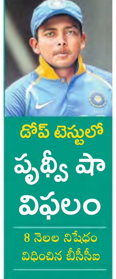
ఓపెన్ టెస్టులో వ్యధ్ధి పా విఫలం