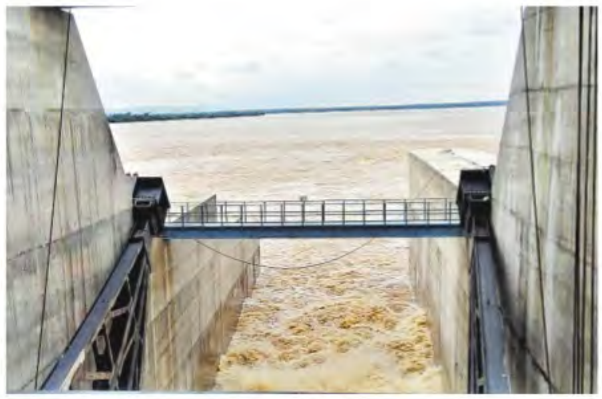
మంగళవారం మేడిగడ్డ బ్యారేజీ గేట్లు ఎత్తడంతో వరద నీరు ఉరకలు