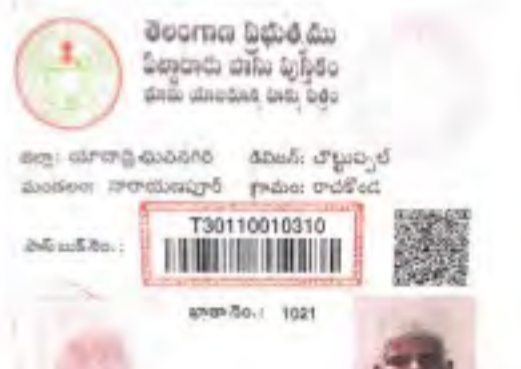
సంస్థాన నారాయణపురంలో ఓ రైతుకు మంజూరు చేసిన పాస్ పుస్తకం

కాకుండా.. సర్వే నంబర్లో ఉన్న మొత్తం భూమి వ్యవసాయేతరభూమిగా పేర్కొంటూ రెవెన్యూ శాఖ ఉత్తర్వులు జారీచేసింది. ఈ మేరకు సమాచారాన్ని స్థాంపన్లు అందే రిజిస్ట్రేషన్లకు సమర్పించింది. దీంతో ఆ భూముల రిజిస్ట్రేషన్ విలువ ఏకంగా కార్యాలయాల చుట్టూ తిరుగుతున్న రైతులకు రైతుబంధు అయింది. రాజకొండ పరిధిలోని 43 సర్వేనంబర్లోని భూమిని సరిదిద్దేది ఇలాగే మార్చడంతో సంబంధంలోని భూమిలో వ్యవసాయం చేసుకుంటున్న 47 మంది రైతుల ఇబ్బందులు ఎదుర్కొంటున్నారు. కుటుంబ అవసరాల నిమిత్తం భూమిని అమ్ముకోవాలంటే రిజిస్ట్రేషన్ ఫీజులు అధికంగా ఉన్నాయనే భయంతో కొనుగోలుదారులు ఎవరూ ముందుకు రావడం లేదు. ఒకవేళ అమ్మినా బట్టి అధికారులు ఎక్కడ దాడులు చేస్తారోనని భయపడుతున్నారు. ఈ వ్యవహారంపై