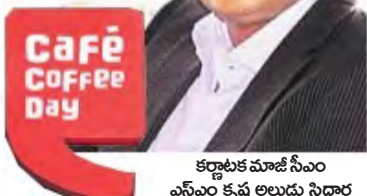
కర్ణాటక మాజీ సీఎం ఎంఎం కృష్ణ అయ్యరు సిద్ధార్థ

నేతావతి నదిలో దూకి అత్యుచిత్య చేసుకున్నట్టుగా సమాచారం ముమ్మరంగా గాలిస్తున్న ఎన్ డిఆర్ ఎఫ్