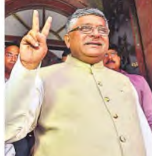
రాజ్యసభలో ట్రిపుల్ తలాక్ బిల్లు ఆమోదం పొందిన తర్వాత విజయనరేతం చూపుతున్న కేంద్రమంత్రి రవిశంకర్ ప్రసాద్

వివాదాస్పద బిల్లుకు పార్లమెంట్ ఆమోదం.. మోదీ సర్కారుకు భారీవిజయం