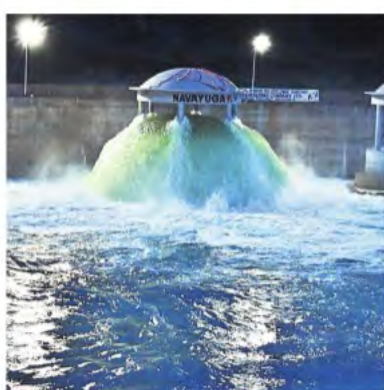
మంగళవారం నందిమేడారం పంపిహాస్ లోని ఐదో సంబర్ మోటర్ ఆన్ చేయడంతో డెలివరీ సిస్టమ్ నుంచి బయటకు వస్తున్న జలాలు