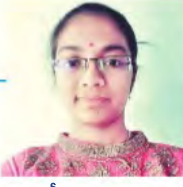
అందరికీ స్ఫూర్తి: మాద రచన

మొదట్లో ఇంగ్లీష్ అంటే భయంగా ఉండేది. కాని సారీ సులువుగా ఇంగ్లీష్ నేర్చుకోవటం చెప్పారు. 8 వ తర గతి నుంచి రోజుకు 5 కొత్త ఇంగ్లీష్ పదాలు నేర్చుకో మని చెప్పారు. దాన్ని పాటించాం. అలా రెండు సంవ త్సరాల్లో ఎంతో ఇంగ్లీష్ నేర్చుకున్నాం. ఇప్పుడు ఇంగ్లీ ష్లో పద్యాలు రాయగలుగుతున్నాం. ఇప్పటి వరకు 10 పద్యాలు రాశాను.