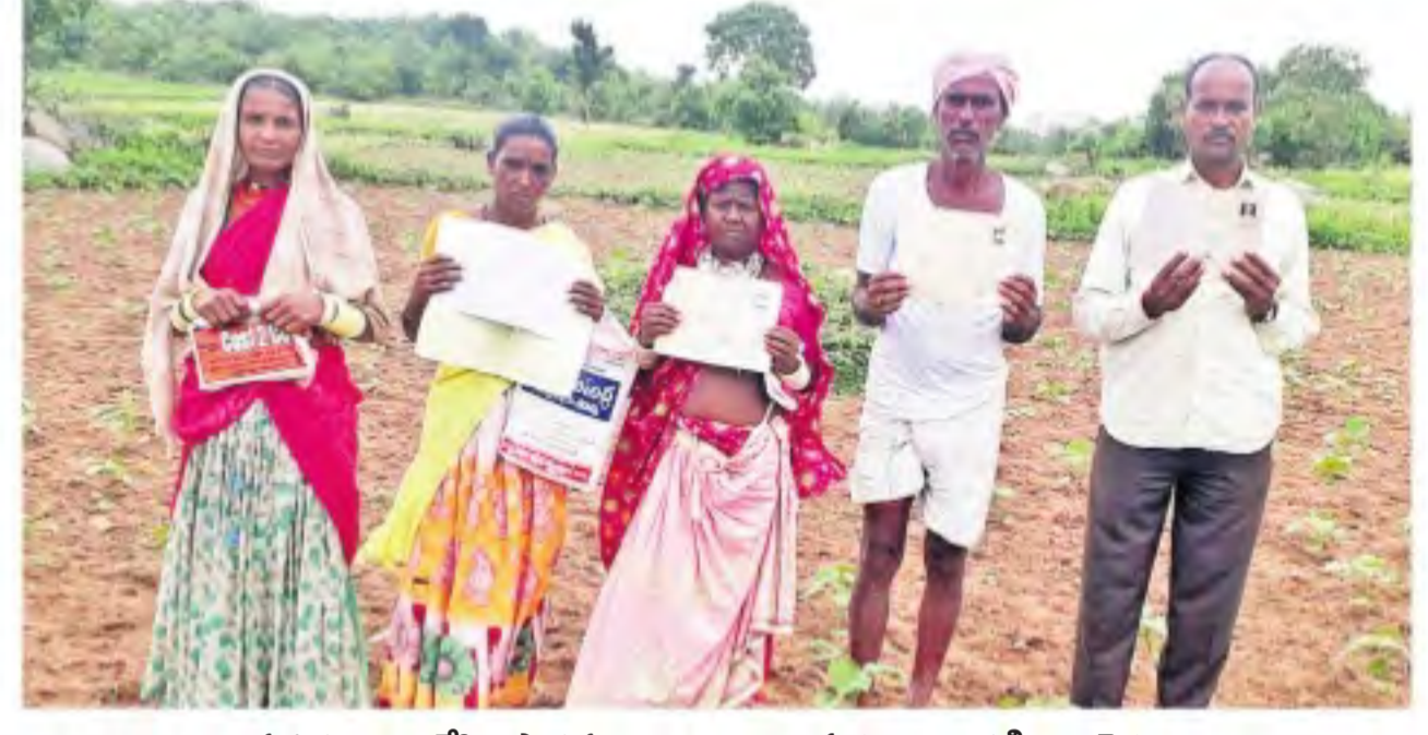
ప్రభుత్వం అందజేసిన పాత పట్టాబక్కులను చూపుతున్న బాధిత గిరిజన రైతులు