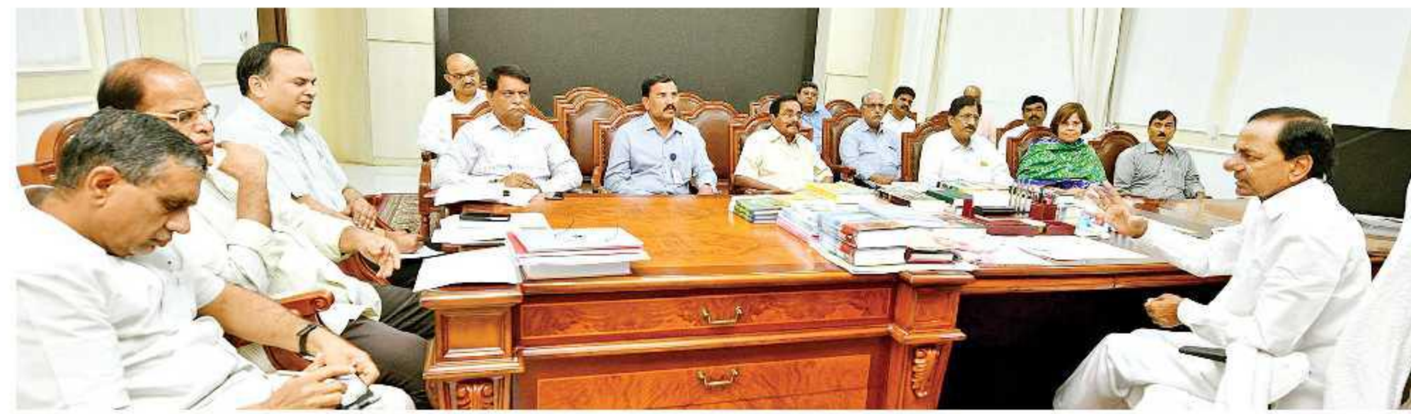
అధికారులతో సమీక్షిస్తున్న ముఖ్యమంత్రి కేసీఆర్

ఈనాడు, హైదరాబాద్: రాష్ట్రంలో ప్రణాళికా బద్ధ అభివృద్ధి.. ఆవిసితికి ఆస్కారం లేని విధానాలు... ప్రజలకు పారదర్శక సేవలు లక్ష్యంగా కొత్త విధానాలను రూపొందిస్తున్నామని ముఖ్యమంత్రి కల్వకుంట్ల చంద్రశేఖర్ రావు తెలిపారు. నగర, గ్రామీణ, రెవెన్యూ విధానాలను అమలులోకి తెస్తామని చెప్పారు. అధికారులతో కూడిన 100 సంచార నిఘా బృందాలను (ఫ్లయింగ్ స్క్వాడ్స్) ఏర్పాటు చేస్తున్నామని