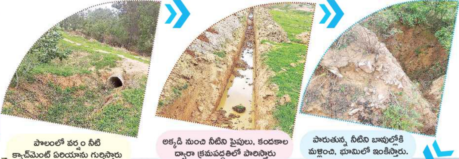
పాలంలో వరం నీటి కాన్వేషన్ ఏరియాను గుర్తిస్తారు. అక్కడి నుంచి నీటిని పైపులు, కండకాల ద్వారా క్రమపద్ధతిలో పాలిస్తారు. పారుతున్న నీటిని బావుల్లోకి మళ్లించి, భూమిలో ఇంకిస్తారు. బావులు నిండిన తర్వాత మిగిలిన నీటిని రెండేకరాల చేరుపులోకి మళ్లించి నిల్వ చేస్తున్నారు.

అధివాసీలకు ఇప్పపువ్వు అందాలను, ఆనందాలనే కాదు ఆర్థిక స్వావలంబన కూడా ఇస్తుంది. దేవతగా భావించే గిరిజనం పాలిట ఆక్షరాలా అమ్మలా ఆడుకుంటుందా చెప్పి. అదే చెట్టును ఆదాయమార్గంగా మార్చితే... ఈ ఆలోచనతో ఆ బిల్డా పాలాపాడిని దివ్య దేవరాజన్ చేపట్టిన కార్యక్రమాల ఆదివాసీల జీవితానికే కొత్తదారి చూపాయనే చెప్పాలి. ఇప్పపువ్వు, ఇప్ప పరక నుంచి ప్రతి భాగాన్ని ఉపయోగించడం మొదలుపెట్టారు. ఇప్పపువ్వును పౌష్టికాహారంగా మార్చుతూ మంచి మార్కెట్ కల్పిస్తున్నారు. దీనికోసం ఆదిలాబాద్ జిల్లా ఉట్టూర్ డివిజన్ లోని 20 మంది మహిళలకు ఎంపిక చేసి, వారికి ప్రత్యేక శిక్షణనిచ్చారు. దీంతో తినుబండారాల తయారీకి ఈ ఏడాది మే నెలలో శ్రీకారం చుట్టారు. లదక్షాలు, కరమరలు, పట్టలు ఇతర తిను బండారాలను తయారు చేస్తూ మంచి ఆదాయాన్ని పొందుతున్నారు. దీంతో ఒక్కప్పుడు పెద్దగా ఉపయోగ పడని ఈ పువ్వుకు ఇప్పుడు తిరుగులేని డిమాండ్ ఏర్పడింది. గ్రామాల్లో ఆదివాసీల ఇళ్లకు వెళ్లి కిలో రూ.20 చెల్లించి మరి కొనుగోలు చేస్తున్నారు. మరోవైపు దీంతో తయారు చేసే పదార్థాలకు డిమాండ్ పెరగడంతో వచ్చే లాభాలూ పెరిగాయి. ఈ ఏడాది మే నెలలో ఉట్టూర్ లో ఇప్పపువ్వు వంటకాల పండగ కూడా నిర్వహించారు. అదే రోజు నుంచి పువ్వు తయారు చేసిన వంటకాలను వివేటిలో అమ్మడం ప్రారంభించారు. ఇప్పుడూ వంటకాలను రాష్ట్ర రాజధాని హైదరాబాద్ లో కూడా విక్రయించేందుకు ప్రయత్నాలు జరుగుతున్నాయి. - బండారి లక్ష్మి నరసయ్య, ఇంద్రవెల్లి