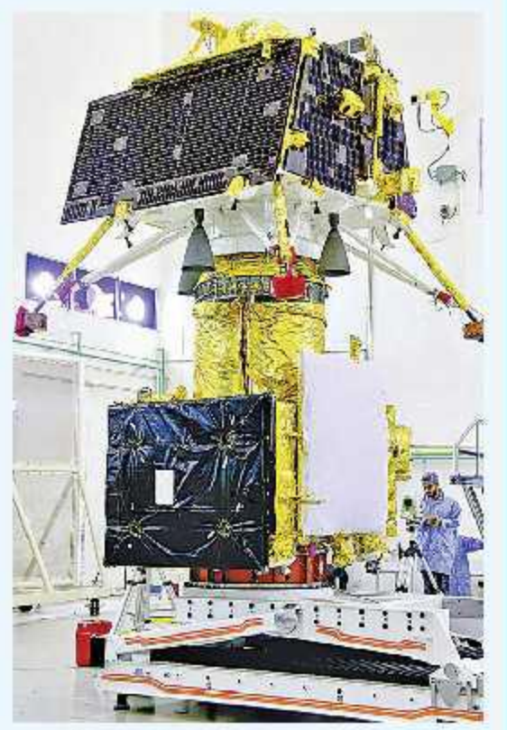
శ్రీహరికోటలో సిద్ధంగా ఉన్న చంద్రయాన 2 వ్యోమనాక

..అందుకే ఈ సుదీర్ఘ మానవ ప్రస్థానంలో మనిషి వీటి గురించి పలు విధాల ఆలోచనలు చేశాడు. రకరకాల సమాధానాలు వెతుక్కున్నాడు. చల్లదనాల చంద్రబింబంలో ఆత్మీయతను పంచే మేనమామను చూసుకున్నాం. అందులోనే ఆశ్చర్యాన్ని పెంచే పేదరాసి పెద్దమ్మను గుర్తించాం. పసిప్రాయంలో 'చందమామ రావే..'. అని పాడుకుంటే.. యవ్వనంలో 'ఓ నెలరాజా.. వెన్నెల రాజా..'. అని వేడుకున్నాం. అయితే.. మన మనసులకు ఎంత దగ్గరైనా నేటికీ మన 'మామ' గురించి మనకు తెలిసింది తక్కువే. నిన్ను మొన్నటి వరకూ మనకు కనీసం అక్కడ నీళ్లున్నాయో లేదో కూడా అయోమయమే. మనిషి అక్కడకు వెళ్ళితే ఆదరణ ఉంటుందో లేదో తెలియదు. అందుకే మన ఆన్వేషణ నేటికీ కొనసాగుతూనే ఉంది. ఈ క్రమంలో వేస్తున్న మరో అడుగు చంద్రయాన-2. భారత గగన పతాకను వినువీడిలో ఎగరేస్తూ.. ఈ నెల 14 ఆర్ధరాత్రి చాటాక (15 తెల్లవారుజామున) మల్బులను చీల్చుకుంటూ పైకి లేచనున్న జీఎస్ఎల్వీ మార్క్-3, అది మోసుకుపోతున్న ఆర్బిటి, ల్యూబ్రికేంట్, లోపభక్తి చందమామకు సంబంధించిన ఎన్నో వింతలావోచనాలు మూటవిప్పుతున్నాయి. అసలే చంద్రయానం ఆడుతున్నామే. దీన్ని వృష్టిలో ఉంచుకునే నేటి సువి 'కానూడు' ప్రత్యేక కథనాలు అందిస్తోంది.