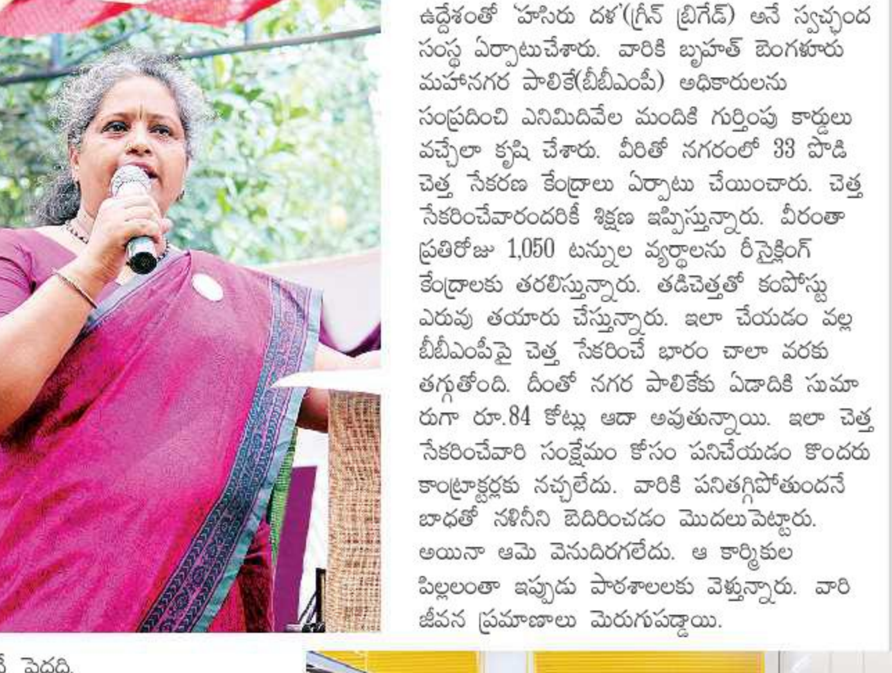
ఫోటో ఇదే పెద్దది.