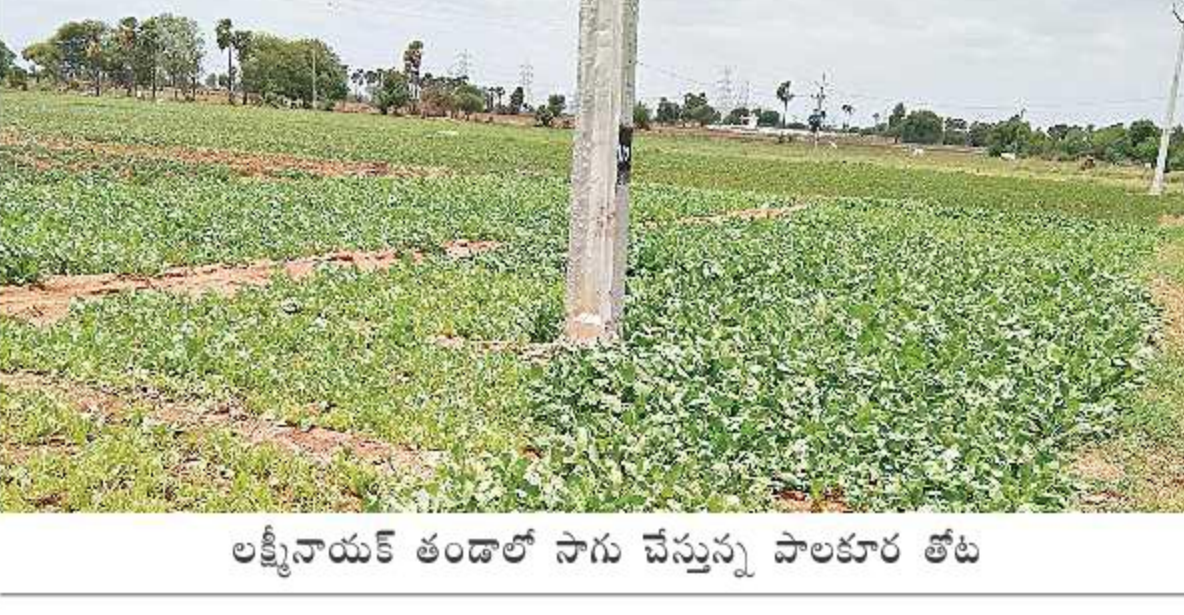
లక్ష్మీనాయక్ తండాలో సాగు చేస్తున్న పాలకూర తోట

వివ్వెంల - న్యూఢిల్లీ రైతులకు మేలు చేశారా అనే దృక్పథంతో ఆహార శక్తి కేంద్రాలను ప్రాసెసింగ్ యూనిట్లను ఏర్పాటు చేయాలి అన్నట్లు ప్రకటించిన రాష్ట్ర ప్రభుత్వం ఆ చర్యలను ముమ్మరం చేసింది. ఇందులో భాగంగా తొలి దశలో కూరగాయల సేకరణ కేంద్రాల ఏర్పాటుకు రంగం సిద్ధం