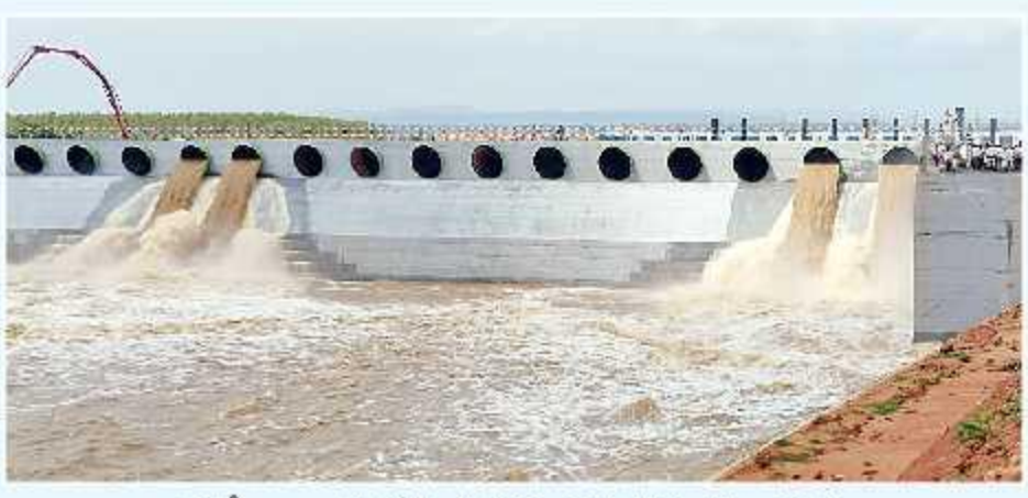
గ్రావిటీ కాలువలో నీటిని ఎత్తిపోస్తున్న దృశ్యం