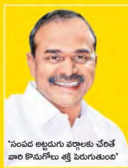
'సంపద అట్టడుగు వర్గాలకు చేరితే వారి కొనుగోలు శక్తి పెరుగుతుంది'