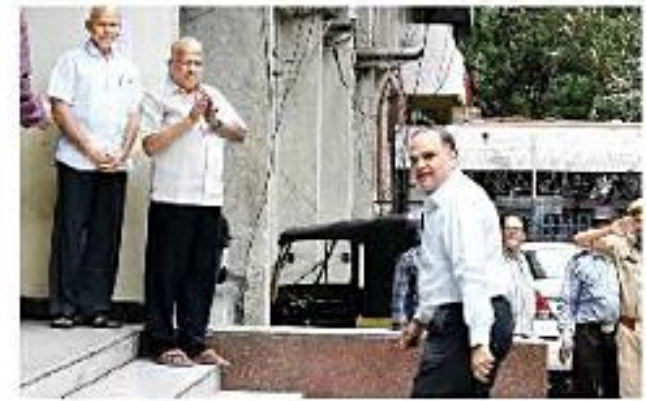
బీఆర్ కే భవన్ లోని తన పీఠికె వెళ్తున్న సీఎస్ ఎన్ కే జోషి

ఈనాడు, హైదరాబాద్: తెలంగాణ తాత్కాలిక సచివాలయం బూర్గుల రామకృష్ణారావు (బీఆర్ కే) భవన్ లో శుభ్రవారం నుంచి కార్యకలాపాలు మొదలయ్యాయి. ప్రభుత్వ ప్రధాన కార్యదర్శి ఎన్ కే జోషి బీఆర్ కే భవన్ నుంచి బాధ్యతలు నిర్వహించారు. ఇతర ఉన్నతాధికారులు అక్కడ తమకు తోచినవి చేసిన కార్యాలయాల్లో చేరారు. కొత్త సచివాలయం నిర్మాణం దృష్ట్యా ప్రస్తుత భవనాన్ని తాత్కాలికంగా అని ప్రభుత్వం నిర్ణయించిన నేపథ్యంలో బీఆర్ కే భవనను ప్రధాన శాఖలను తరలించాలని ఆదేశాలు