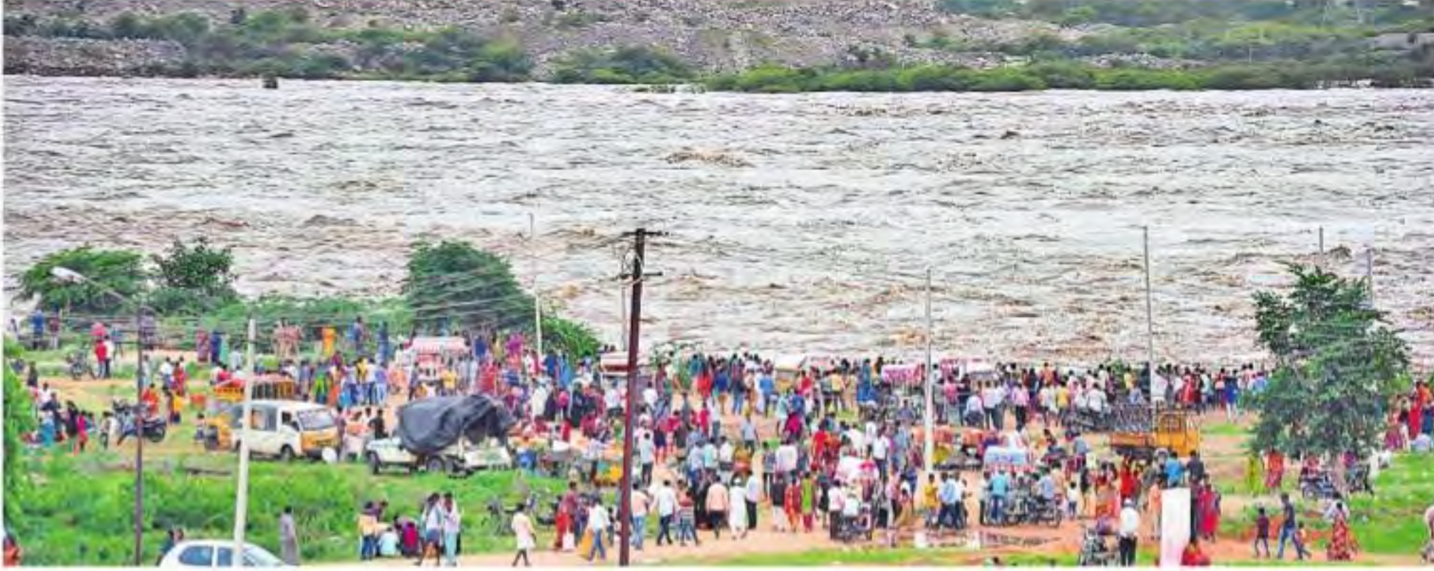
శనివారం జీగుణాల గంగాల జిల్లాలోని జారాల ప్రాజెక్టు నీటి అందాలను వీక్షించేందుకు తరలివచ్చిన పర్యాటకులు