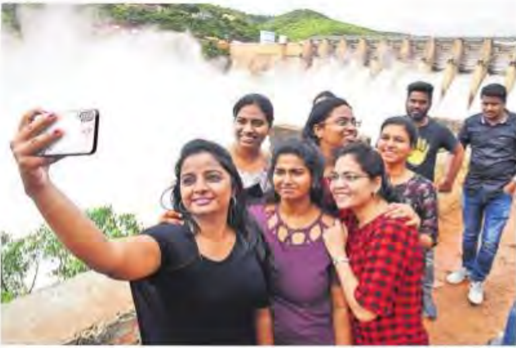
శనివారం శ్రీశైలం ప్రాజెక్టు వద్ద సిబ్బిలు తీసుకుంటున్న యువకులు