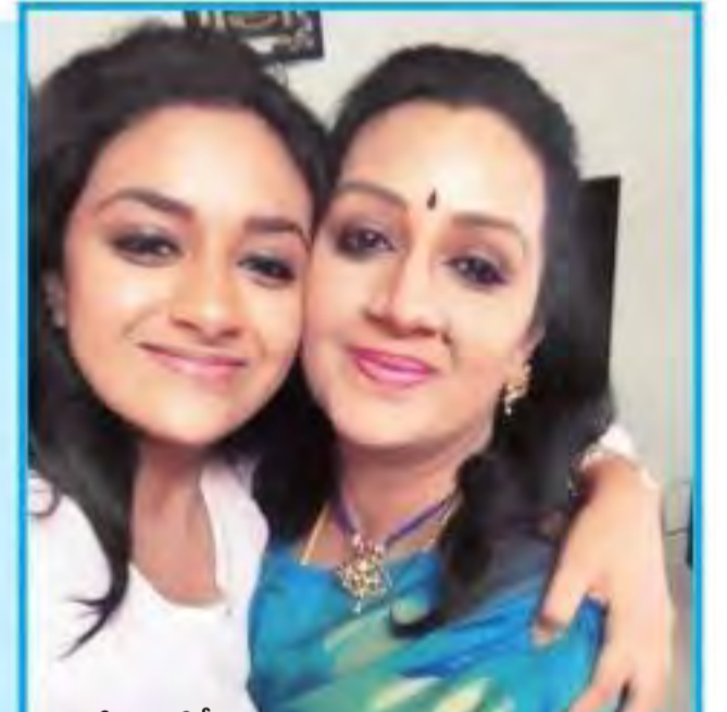
తల్లి మేనకతో కలిసి..

అందులో ముఖ్యంగా చెప్పాల్సింది మాయాబజార్లోనే 'అహ నా పెళ్లం' ఎపిసోడ్ అంటే నాకు చాలా ఇష్టం. ఈ సీన్ తీయడానికి సుమారు 50 బేకలు తీసుకున్నాను. బేక్ తీసిన ప్రతీ సారి చూసుకుంటూ ఉండేదాన్ని. ఒకసారి చేసిన తప్పలు దొడకుండా చూసుకునేదాన్ని. ఫైనల్ అవుట్ పుట్ బాగా రావడంతో అందరూ అభినందించారు.