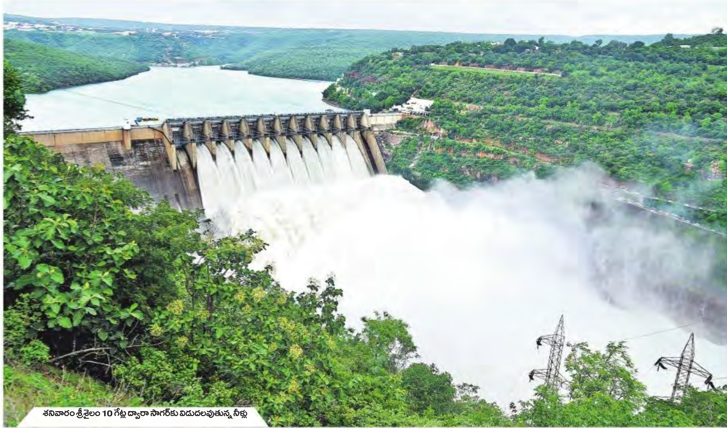
శనివారం శ్రీశైలం 10 గేట్ల ద్వారా సాగర్ కు విడుదలవుతున్న నీళ్లు