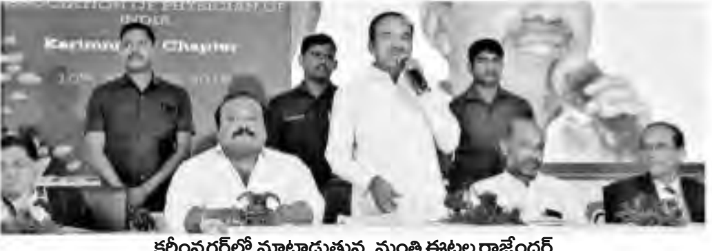
కఠినగఠ్ లో మాట్లాడుతున్న మంత్రి ఈటల రాజేందర్