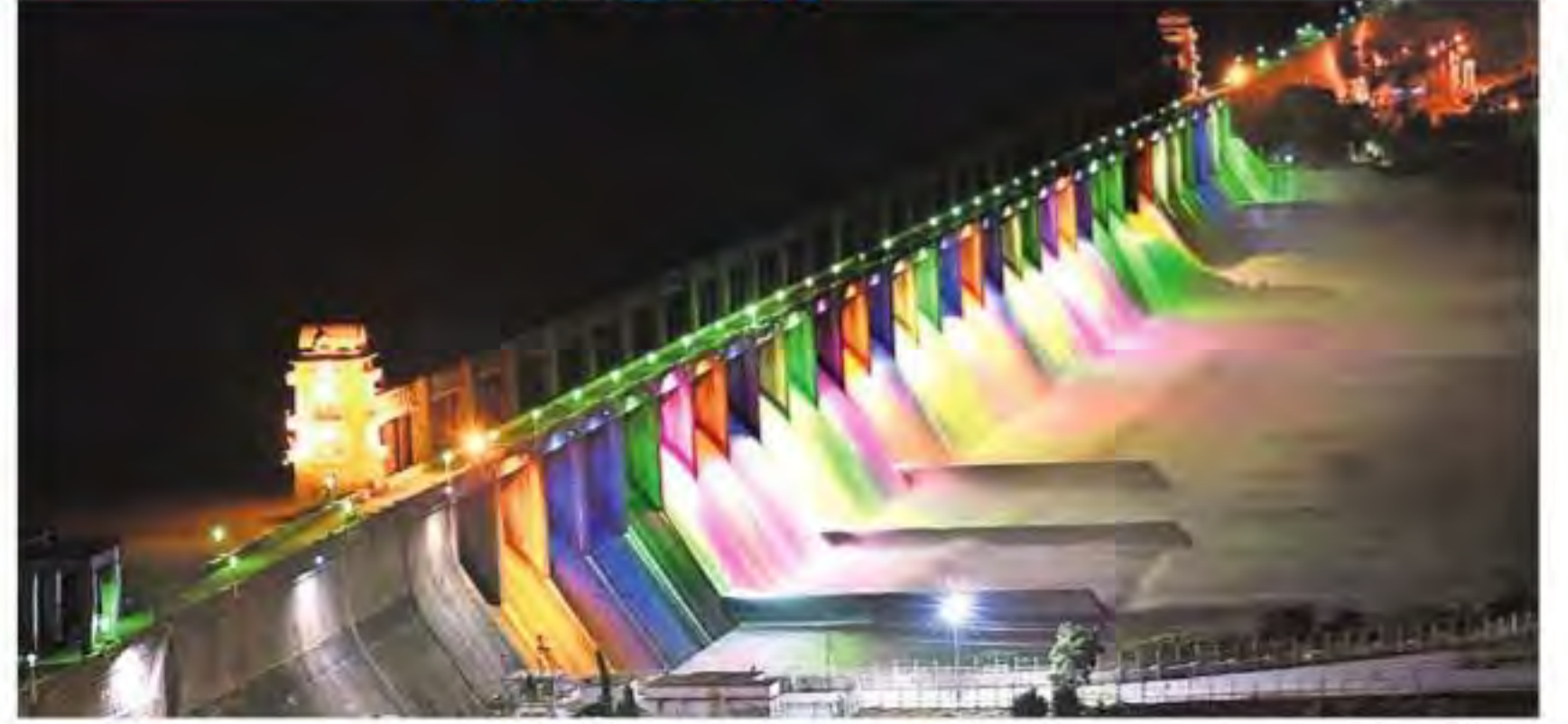
శనివారం విద్యుత్ వేలుగుల మధ్య తుంగభద్ర ప్రాజెక్టు నుంచి దిగువకు విడుదలవుతున్న నీరు