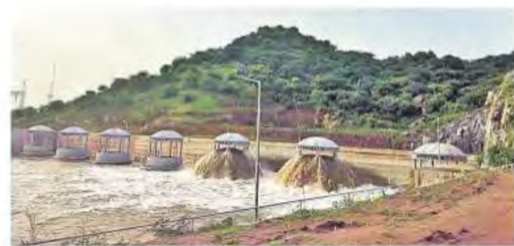
నందిమేడారం పంపిణీలోని 2, 3 మోటర్లు ఆన్ చేయడంతో దెలివరీ సిస్టర్ నుంచి బయటికి దిగుతున్న జలాలు

రీతిగా నీటిప్రవాహం కొనసాగుతుండటంతో శనివారం 65 గేట్లను ఎత్తి దాదాపు 2.15 లక్షల క్యూసెక్కుల నీటిని దిగువకు తరలించారు. బరాజ్ లో 93.50 మీటర్ల ఎత్తులో 2.839 టీఎంసీల నీరు నిల్వ ఉన్నదని అధికారులు తెలిపారు.