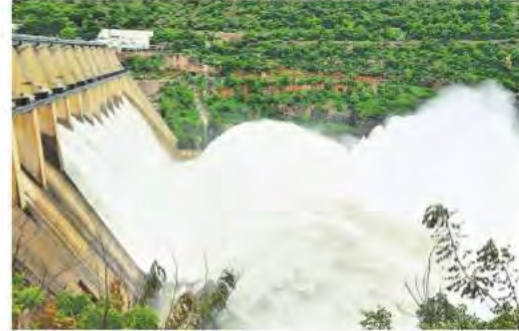
శనివారం శ్రీశైలం ప్రాజెక్టు గేట్లు ఎత్తడంతో దిగువకు విడుదలవుతున్న నీరు

కొన్ని దశాబ్దాలుగా తరచూ సంక్షోభాన్ని ఎదుర్కొంటున్న కృష్ణాబేసిన్ లో ఈ ఏడాది జల సంబురం నెలకొన్నది. ఈ నీటి సంవత్సరంలో మొదటి రెండు నెలలపాటు తీవ్ర నిరాశకు గురిచేసిన కృష్ణా.. ఇప్పుడు అన్నారం ప్రధానంగా ఆగస్టు మాసం ప్రాజెక్టులకు కీలక పాత్ర పోషిస్తోంది. కృష్ణాబేసిన్ చరిత్రను పరిశీలిస్తే.. ప్రధానంగా ఆగస్టు మాసం ప్రాజెక్టులకు కీలకంగా మారుతున్నది. గత 28 ఏండ్ల రికార్డులను పరిశీలిస్తే.. ఆగస్టు నెలలో 500 టీఎంసీలకు పైగా వరద వచ్చిన సందర్భాలు కేవలం నాలుగు పర్యాయాలే. ప్రస్తుతం నడుస్తున్న ఆగస్టు మాసం కూడా ఈ రికార్డుల సరసన చేర