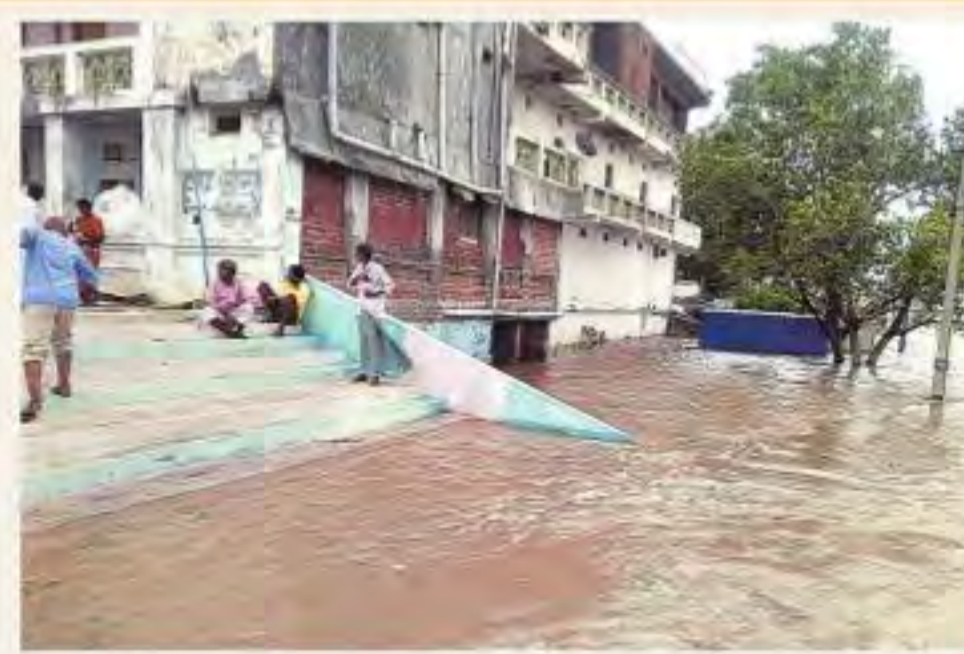
నారాయణపేట జిల్లా కృష్ణమండలం హిందుపూర్ లో పరవళ్లు తొక్కుతున్న భీమా వరద