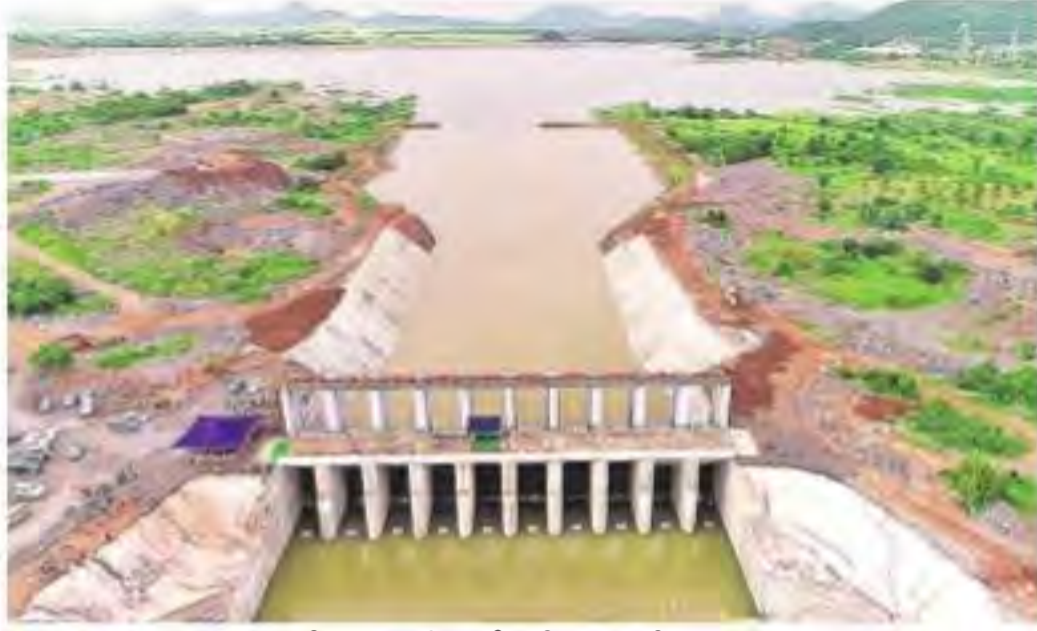
పెద్దపల్లి జిల్లా కాళేశ్వరం ఏడో ప్యాకేజీలోని నంది మేడారం పంపిణీలోని నంది దిగువకు విడుదలవుతున్న నీరు