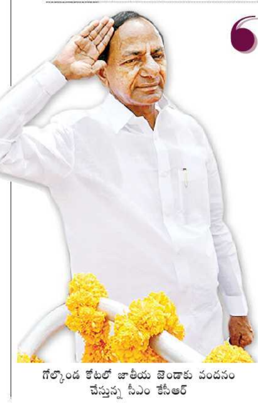
గోల్కొండ కోటలో జాతీయ జెండాకు వందనం చేస్తున్న సీఎం కేసీఆర్

జమ్మూ-కశ్మీర్ ను ముందుకు తీసుకెళ్లడానికి, సమన్వయ పరిష్కరించడానికి 70 ఏళ్లలో ప్రతి ప్రభుత్వమూ శ్రమించింది. కానీ అనుకున్న ఫలితాలు రాలేదు. మేము రెండోసారి అధికారంలోకి వచ్చిన 70 రోజుల్లోనే పరిష్కరించి చూపాం. నవీన్ భారత నిర్మాణానికి ప్రతి భారతీయుడు కలసిరావాలి. దేశాన్ని ముందుకు తీసుకెళ్లాం. మార్పును సాకారం చేద్దాం. అభివృద్ధి పథంలో సమున్నత శిఖరాలను అధిరోహిద్దాం.