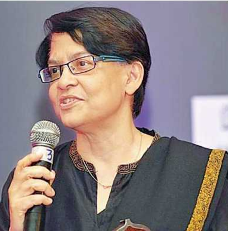
నుంచి రెండేళ్లు పరిశోధన చేశారు. మరో రెండేళ్లు న్యూయార్క్ లోనూ పనిచేశారు. 1984లో నేషనల్ ఇన్స్టిట్యూట్ ఆఫ్ ఇన్వెస్టిగాటోన్ లో పరిశోధకురాలిగా చేరారు.