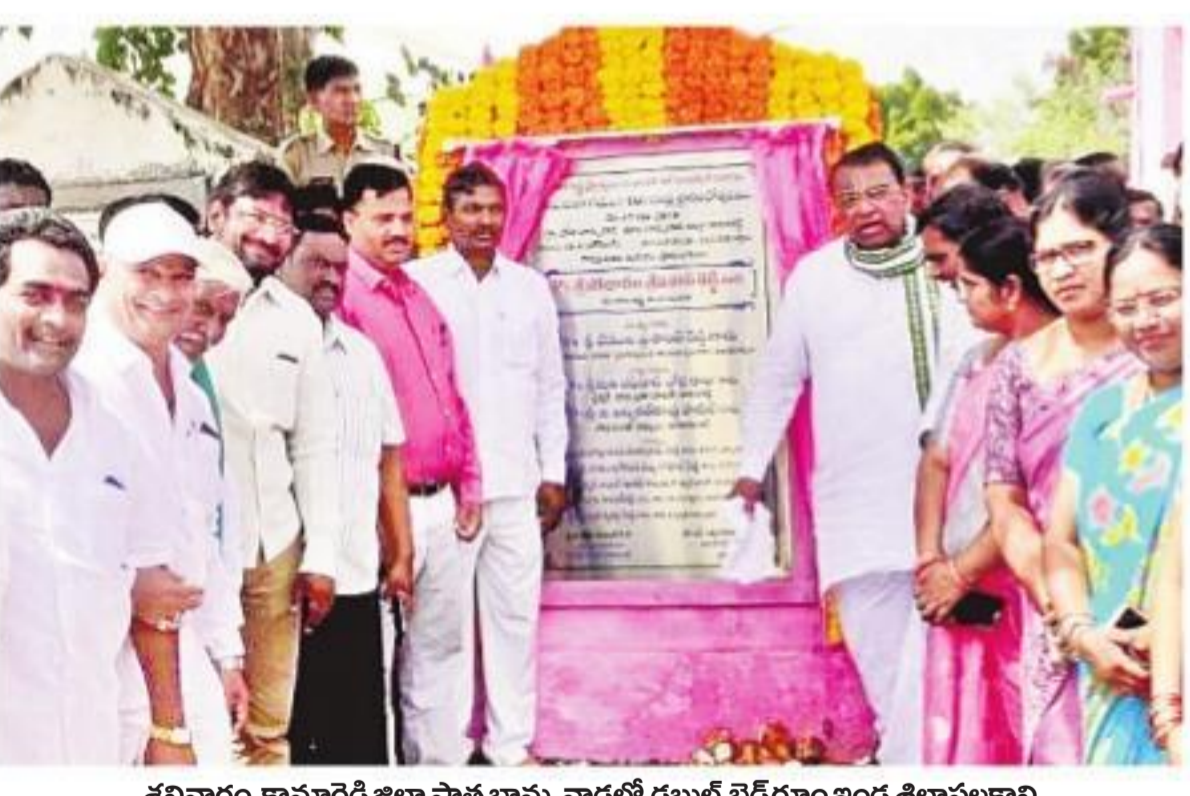
శనివారం కామారెడ్డి జిల్లా పాత బాన్సువాడలో డబుల్ బెడ్రూం ఇండ్ల శిలాఫలకాన్ని అవిష్కరిస్తున్న సీఎం కేసీఆర్