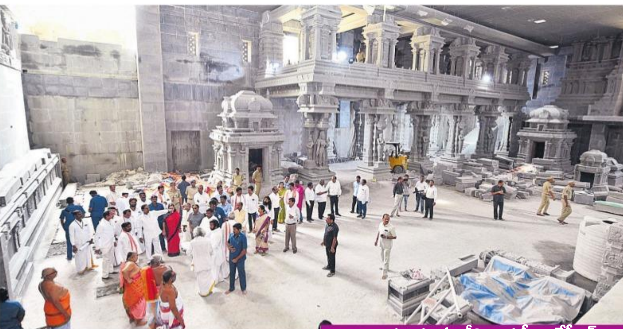
యాదాద్రి లక్ష్మీనరసింహస్వామి ప్రధానాలయ ముఖ్యమంత్రి కల్యాణకుండ్ల చంద్రశేఖరరావు పరిశీలించి సూచనలు చేస్తున్న ముఖ్యమంత్రి కల్యాణకుండ్ల చంద్రశేఖరరావు

యాగానికీ ఏర్పాటు చేయాలి వచ్చి పీఠానికి యాదాద్రిలో మహా సుదర్శన సాయాగం నిర్వహించాలని భావిస్తున్నట్లు సీఎం కేసీఆర్ తెలిపారు. 'మూడువేల మంది రుత్వికలు, మూడువేల మంది వేదపాఠాలు, మూడువేల మంది సహాయకర్మిణులు, మరో మూడువేల మంది సహాయకర్మిణులు ఇందులో పాల్గొంటారు. 1,048 కుండాల ఏర్పాటుచేసి యాగం నిర్వహిస్తారు. కేంద్ర ప్రభుత్వ పెద్దలు, వివిధరాష్ట్రాల ముఖ్యమంత్రులు, గవర్నర్లు, ఇతర ప్రముఖులు, 45 దేశాల నుంచి వేదపండితులు, అర్చకులు, దేశ నలుమూలల నుంచి ప్రతిరోజూ లక్షలమంది