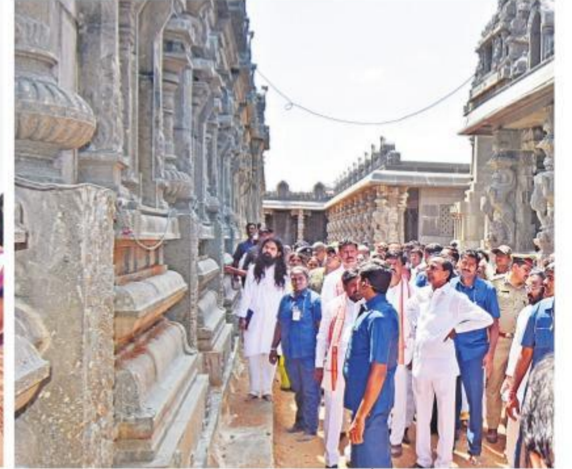
యాదాద్రి తిరుమాడ వీధుల్లో నిర్మాణ శిల్పసాధారణని పరిశీలిస్తున్న ముఖ్యమంత్రి కేసీఆర్