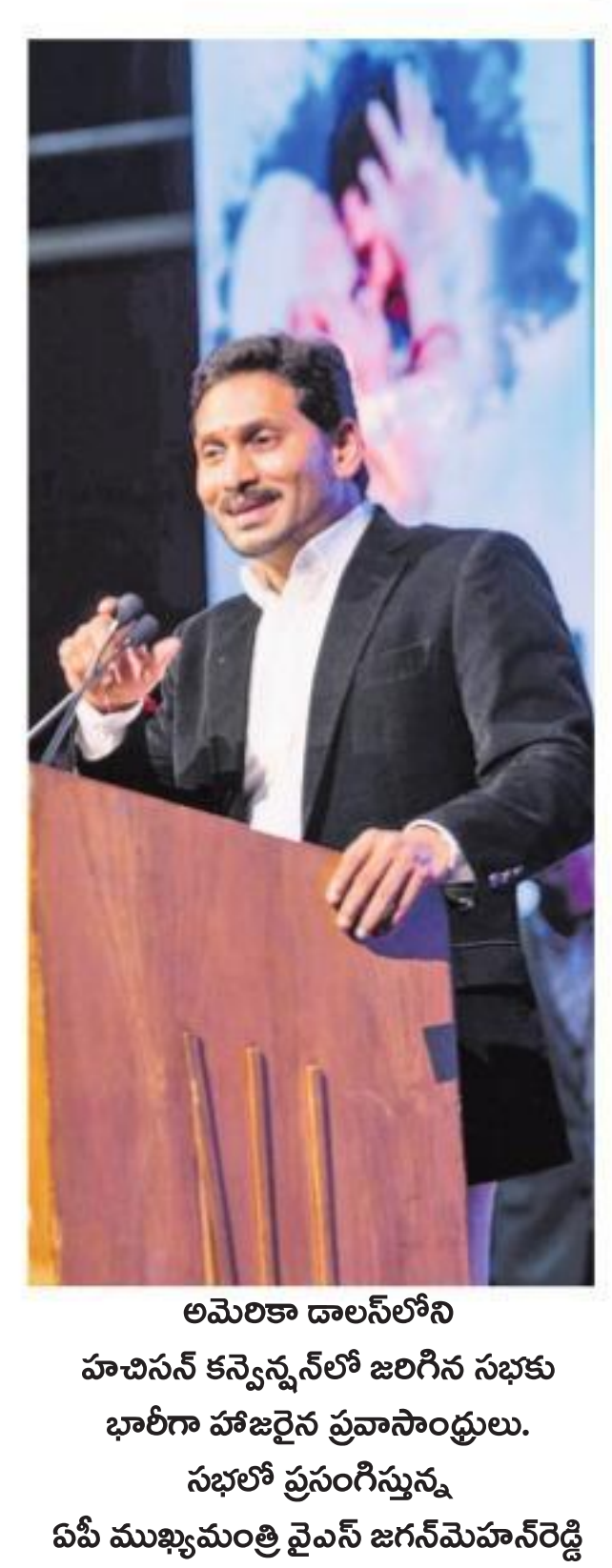
అమెరికా డాలస్ లోని హాలివుడ్ కన్వెన్షన్ లో జరిగిన సభకు భారీగా హాజరైన ప్రవాసాంధ్రులు. సభలో ప్రసంగిస్తున్న ఏపీ ముఖ్యమంత్రి వైఎస్ జగన్ మోహన్ రెడ్డి

ఇది మీ ప్రభుత్వం అనే విషయాన్ని గుర్తుపెట్టుకోండి. మీ కుటుంబాలతో రండి. మీ తల్లిదండ్రుల్ని, అవ్వతాతల్ని, స్నేహితుల్ని చూడడానికి సంవత్సరానికి కనీసం ఒకసారి సార్వజనీనంగా రండి. ఆ తర్వాతే పాలిటామిక్ గా పెట్టుబడులు పెట్టడానికి ముందుకు రండి. అన్ని రకాలుగా మీకు తోడుగా ఉంటాం. - వైఎస్ జగన్