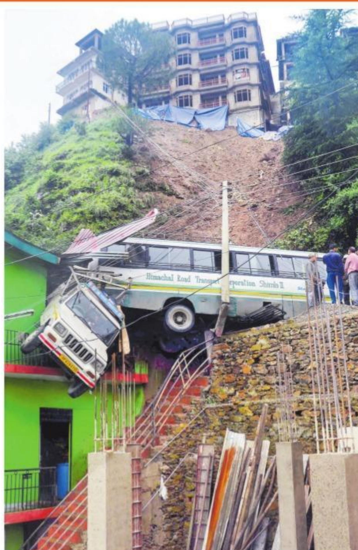
అదివారం సిమ్లాలో కొండచరియలు విరిగిపడటంతో ఇళ్లపై పడ్డ వాహనాలు