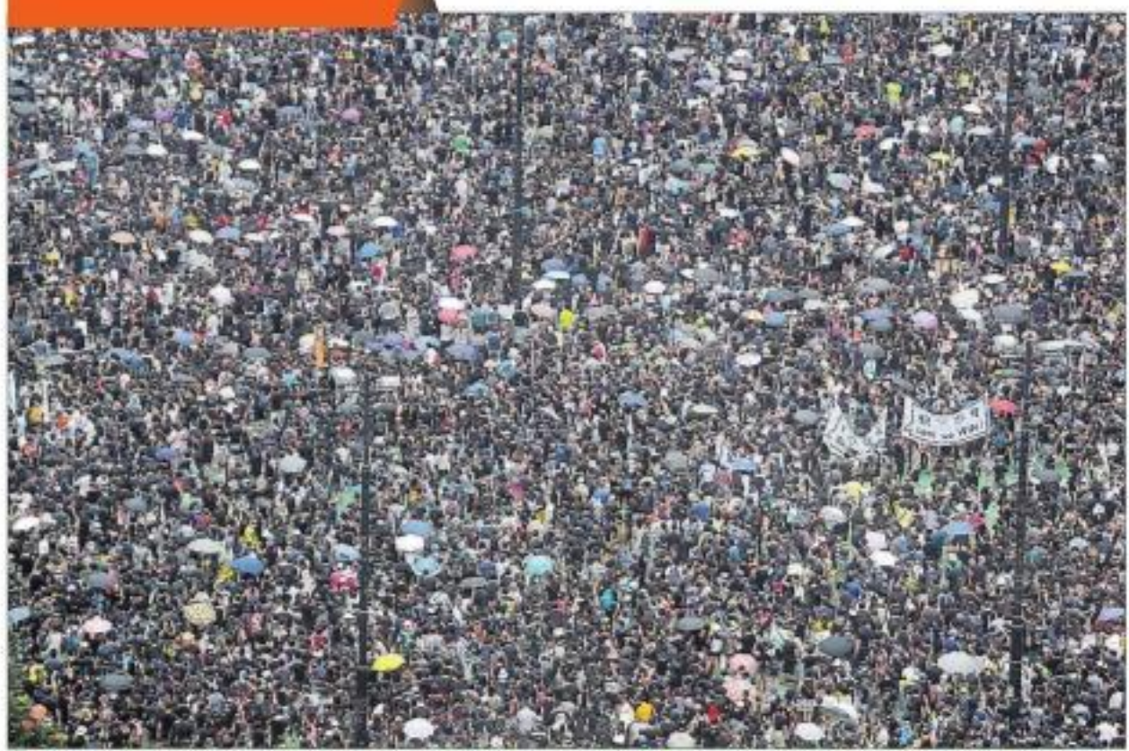
హోంకారంలోని వికేలీయా పార్కులో సమావేశమైన ప్రజాస్వామ్య అనుకూల వాదులు. జోరున వర్షం కురుస్తున్నా లెక్కచేయకుండా సుమారు 17 లక్షల మంది పాల్గొన్న ఈ రా్యభీ శాంతియుతంగా సాగిన నిరాహారాలు తెలిపారు.