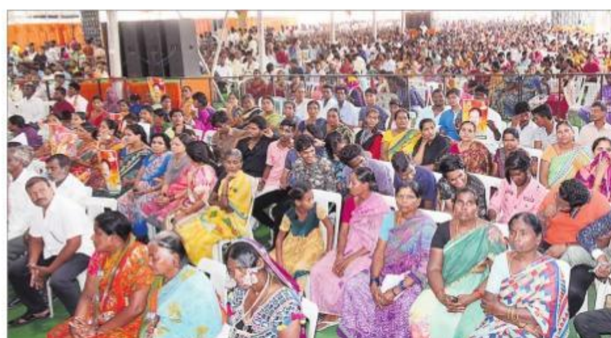
నాంపల్లి ఎన్టీఆర్ గ్రాండ్ లో బీజేపీ సభకు హాజరైన జనం