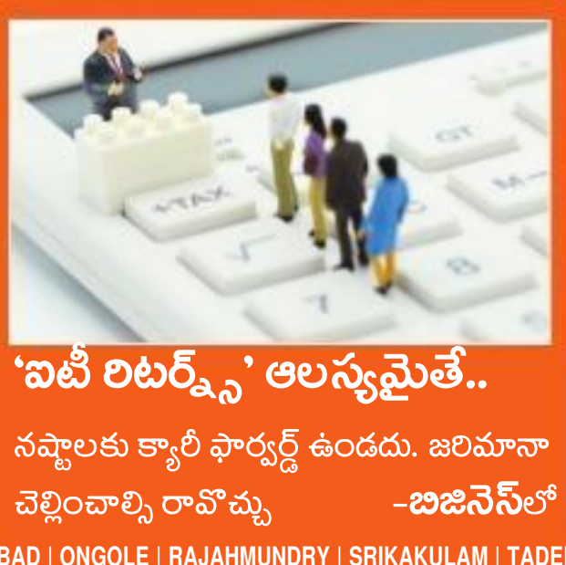
'ఐటీ లిటర్స్' ఆలస్యమైతే..

నవ్వాలకు క్యారీ ఫార్వర్డ్ ఉండదు. జరిమానా చెల్లించాల్సి రావొచ్చు -బిజినెస్ లో