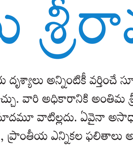
సిద్ధాంతరీత్యా చూసినప్పుడు కాంగ్రెస్ వంటి మధ్యేమార్గ పార్టీలు అన్నివర్గాలను కలుపుకొనిపోయి, అందరి ప్రయోజనాలను పరిరక్షిస్తూ, అభి వృద్ధి-సంక్షేమం-సామాజిక న్యాయాల సమన్వయ వేదికలుగా (అంబెద్కర్ పార్టీ) తమనుతాము చెప్పుకున్నాయి. తక్కినవాటిలో అనేకం అభి వృద్ధి గురించి, సంక్షేమం గురించి సాధారణ రూపంలో మాట్లాడుతూనే, నిర్దిష్ట సామాజికవర్గాలకు సామాజిక న్యాయం లేదా రాజకీయాధికారం తమ లక్ష్యమన్నాయి. ప్రాంతీయపార్టీలు ప్రాంతీయ ఆర్థిక-రాజకీయ-సామాజికకక్షల కోసం అధికారాన్ని సాధించటంతో పాటు అభివృద్ధి, సంక్షేమం తమ అజెండాలున్నాయి.

ఎన్నికల్లో కాంగ్రెస్ పార్టీ కేరళలో అధికారాన్ని కోల్పోవటంతో పాటు ఉత్తర ప్రదేశ్, టీడీపీ, బెంగాల్, ఒడిస్సా వంటి ప్రధాన రాష్ట్రాలలో 1952 తో పోటీనిప్పుడు ఓట్లు, సీట్లు పోగొట్టుకున్నది. ఆ పరిస్థితిని గమనించిన నెహ్రూ, కాంగ్రెస్ వర్గానికి కమిటీ సమావేశంలో మాట్లాడుతూ ప్రజల అభివృద్ధి, సంక్షేమాలను విస్తరిస్తే వారు మనకు తోసివేసే ముందుకు పోగలరని హెచ్చరించారు. ఆయన మాటలు సరిగా ఇవే కాకపోయినా సాధారణం ఇదే. నెహ్రూ ఎంత అభ్యుదయవాది అయినా అప్పుడు కాంగ్రెస్ పార్టీలో ప్రాబల్యం పూర్ణం శక్తి అయినందున తన హెచ్చరిక పనిచేయలేదు. 1957 తర్వాత మరొక పదేండ్లు గడిచేసరికి వైచేయి లాల్ ముఖర్జీ, శూన్యం కూడా మరింత పెరిగి, అందులోకి ఇతర భావజాలాల శక్తులు ప్రవేశించడం మేల్కొని పుంజుకున్నది. ఈ పరిస్థితిని మరోకవిధంగా చెప్పాలంటే, ఒకవేళ కాంగ్రెస్ పార్టీ తన స్వాతంత్ర్యోద్యమ కాలపు అభివృద్ధి, సంక్షేమం, సామాజిక న్యాయం లక్ష్యాలకు తన తప్పకుండా కట్టుబడి పాటించినట్లయితే, రాజ్యాంగాన్ని, చట్టాలను, బిడ్డెట్లను, పంచవర్గ ప్రణాళికలను సవ్యంగా అనుసరించి ఉంటే,