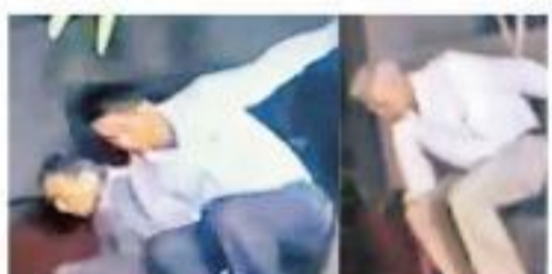
చిదంబరం ఇంటికి ప్రవేశించేందుకు గోడదూకిన అధికారులు

అని పేర్కొన్నారు. దర్యాప్తు సంస్థలు పక్షపాతంతో వ్యవహరిస్తున్నాయని, అయినా తాను చట్టాన్ని గౌరవిస్తానని చెప్పారు. తనపై, తన కుమారుడిపై తప్పుడు కేసులు బనాయించారని ఆరోపించారు. సీబీఐ, ఈడీ నమోదు చేసిన కేసుల్లో, దాఖలు చేసిన డాక్యుమెంట్ల అక్కడ నేరగా తమ పాత్ర ఉన్నట్లు నిరూపితం కాలేదన్నారు. విచారణ నుంచి తప్పించుకోని తిరుగుతున్నారన్న ఆరోపణలను కొట్టి పారేశారు. 'నిన్న రాత్రి వరకు నేను లాల్ దుబ్బా బృందంలోనే ఉన్నాను. సుప్రీంకోర్టులో పిటిషన్ దాఖలు చేసేందుకు కావాల్సిన పత్రాలను