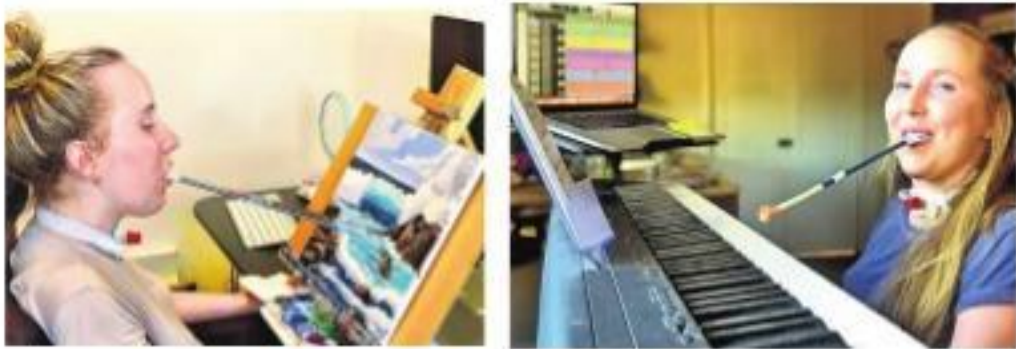
అరుదైన వ్యాధి కారణంగా ఆమె కాళ్ళు, చేతులు స్వల్ప క్రోలోనియాలు. వైద్యం కోసం చాలా ఆస్పత్రులు తిరిగింది. కానీ, మెరుగైన వైద్యం అందలేదు. వైద్యులు చేతులెత్తేశారు. ఆయువతి ఏమార్తం దిగులు పడకుండా ఆత్మస్వచ్ఛతతో అడుగు ముందుకేసింది.