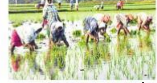
ఈ వానకాలంలో సాధారణ సాగు విస్తీర్ణం 1.08 కోట్ల ఎకరాలు కాగా, 85 శాతం సాగు అయింది, 91.45 లక్షల ఎకరాల్లో వివిధ పంటలు సాగు చేసినట్లు వ్యవసాయశాఖ వెల్లడించింది. పత్తిని అత్యధికంగా 102 శాతం 43.58 లక్షల ఎకరాల్లో వేశారు. మొక్కజొన్న 8.94 లక్షలు, కందులు 6.70 లక్షలు, వెన్నెముక 1.47 లక్షలు, సోయాబీన్ 4.27 లక్షల ఎకరాల్లో సాగుచేశారు. ఆహార పంటలు 47.69 లక్షల ఎకరాల్లో సాగుచేశారు. ఇప్పటివరకు 88.30 లక్షల ఎకరాల్లో సాగుచేశారు. రెండో దశలో 100 శాతానికి చేరుకున్నాయి. 23 జిల్లాల్లో 76 నుంచి 100 శాతం, నాలుగు జిల్లాల్లో 51 నుంచి 75 శాతం పంటల సాగు సమాధియంది.

హైదరాబాద్, నమస్తే తెలంగాణ: రాష్ట్రంలో పరి నాట్లు జోరందుకున్నాయి. వారం వ్యవధి లోనే లక్షల ఎకరాల్లో రైతులు పరినాట్లు పంటలు సాగు చేసినట్లు వ్యవసాయశాఖ వెల్లడించింది. పత్తిని అత్యధికంగా 102 శాతం 43.58 లక్షల ఎకరాల్లో వేశారు. మొక్కజొన్న 8.94 లక్షలు, కందులు 6.70 లక్షలు, వెన్నెముక 1.47 లక్షలు, సోయాబీన్ 4.27 లక్షల ఎకరాల్లో సాగుచేశారు. ఆహార పంటలు 47.69 లక్షల ఎకరాల్లో సాగుచేశారు. ఇప్పటివరకు 88.30 లక్షల ఎకరాల్లో సాగుచేశారు. రెండో దశలో 100 శాతానికి చేరుకున్నాయి. 23 జిల్లాల్లో 76 నుంచి 100 శాతం, నాలుగు జిల్లాల్లో 51 నుంచి 75 శాతం పంటల సాగు సమాధియంది.