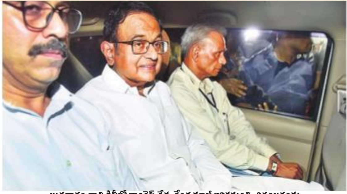
బుధవారం రాత్రి ఢిల్లీలో కాంగ్రెస్ నేత, కేంద్ర మాజీ ఆర్థిక మంత్రి చిదంబరం ఆయన నివాసం నుంచి అరెస్టు చేసి తీసుకెళ్తున్న సీబీఐ అధికారులు