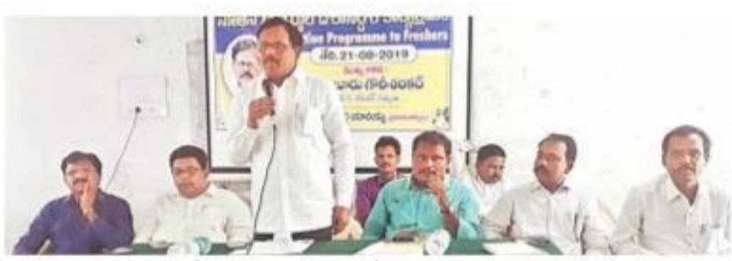
యాదాద్రి భువనగిరి జిల్లా రామనగరంలో మోక్షాక్షయం చేపట్టిన జిల్లా నాయకుల గౌరవం