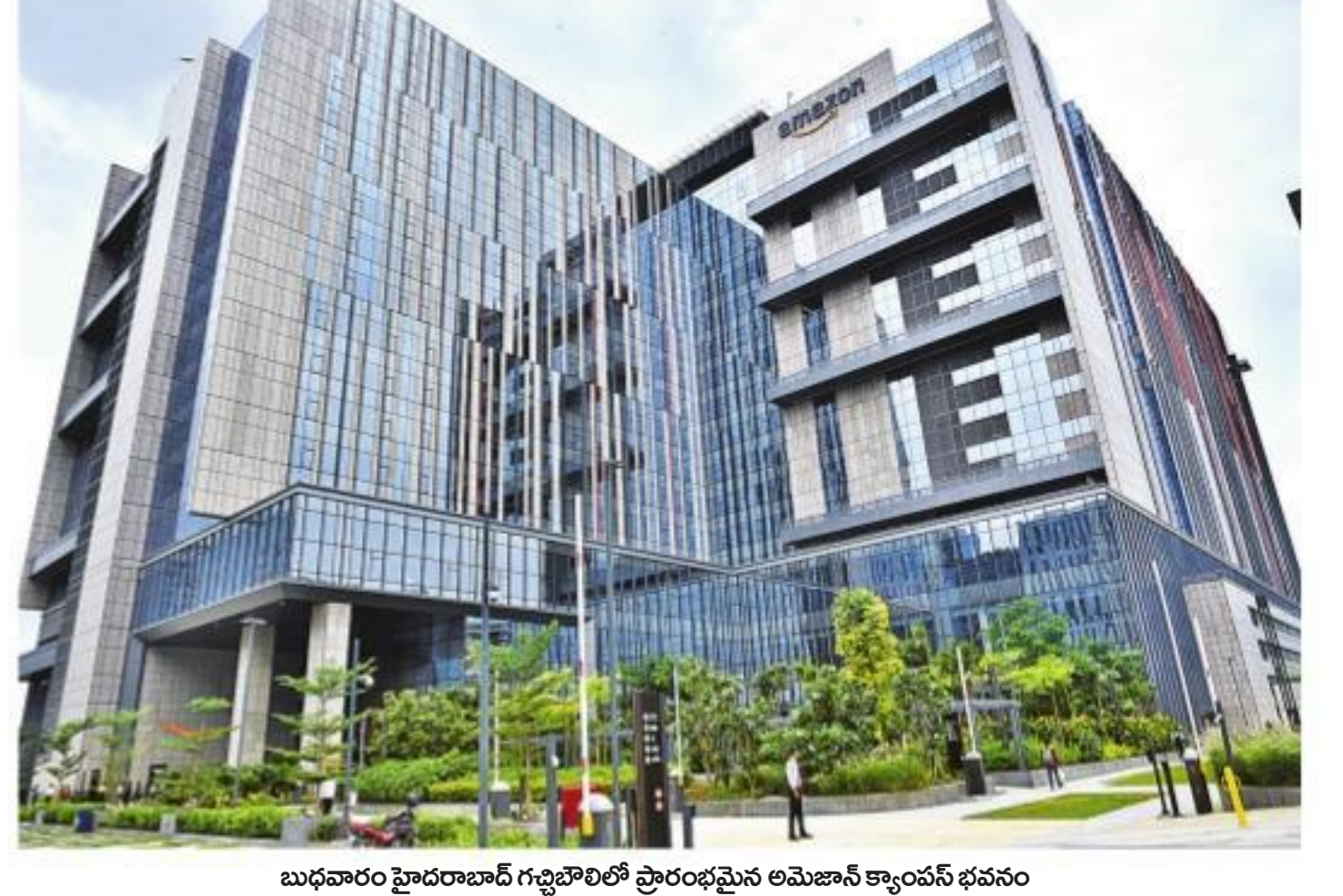
బుధవారం హైదరాబాద్ గజ్వేలిలో ప్రారంభమైన అమెజాన్ క్యాంపస్ భవనం