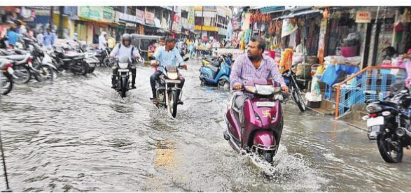
జగిత్యాల జిల్లాకేంద్రంలో జలమయమైన రహదారి

బంగాళాఖాతంలో కొనసాగుతున్న ఉపరితల ఆవర్తన ప్రభావంతో రాష్ట్రంలో తేలికపాటి నుంచి ఓ మోస్తరు వానలు కురుస్తున్నాయి. బుధవారం ఖమ్మం, భద్రాద్రి కొత్తగూడెం, జగిత్యాల జిల్లాల్లో భారీ వర్షం కురచగా, గ్రేటర్ హైదరాబాద్ లోని పలు ప్రాంతాలలో పాటు వరంగల్ రూరల్, ములుగు, నల్గొండ, సూర్యాపేట, నిజామాబాద్, నాగ రేకర్నూల్ జిల్లాల్లో ఓ మోస్తరు వాన వడింది. కొనసాగుతున్న ఉపరితల ఆవర్తనం కారణంగా రాగం 24 గంటల్లో కొన్నిచోట్ల ఓ మోస్తరు నుంచి భారీ వర్షాలు కురిసే అవకాశం మున్నడని హైదరాబాద్ వాతావరణ కేంద్రం తెలిపింది. * మంగళవారం రాత్రి నుంచి బుధవారం తెల్లవారుజాము వరకు పలు జిల్లాల్లో చిరు జల్లులు నుంచి ఓ మోస్తరు వర్షం కురిసింది. భద్రాద్రి కొత్తగూడెం జిల్లాలో బుధవారం ఉదయం 11 గంటలకు ప్రారంభమైన వర్షం సాయంత్రం వరకు కురిసింది. కొత్తగూడెం, ఇల్లంపల్లి, బూర్గంపాడు, భద్రావలం, పాలవలం, చ, చుండుపల్లి, లక్ష్మీదేవిపల్లి, సుజాతనగర్, జూలూరుపాడు మండలాల్లో భారీ వర్షం కురిసింది. బుధవారం సాయంత్రం 5 గంటలకే జిల్లాకేంద్రంలో నల్లటి మబ్బులతో కారుచీకటి కమ్ముకున్నది. జిల్లావ్యాప్తంగా 18.9 మిల్లీమీటర్ల సగటు వర్షపాతం నమోదైంది. అత్యధికంగా పాలవలంలో 52.4 మి.మీ., ములకలపల్లిలో 48.6 మి.మీ., నమోదైంది. బుధవారం సాయంత్రం ఖమ్మం నగరంలో పాటు పలు మండలాల్లో భారీ వర్షం కురిసింది. చైరా, మధిర, ఖమ్మం రూరల్, కూసుమంచి, కాచిపల్లి, కామేపల్లి, ధర్మనాథపాలెం, ఓంకాపా, కొజిబిడ్డ, బోనకల్ మండలాల్లో ఓ మోస్తరు నుంచి భారీ వర్షం కురిసింది. తిరుమలయపాలెం వరకు ఏసార్లు మండలాల్లో అత్యధికంగా 59.2