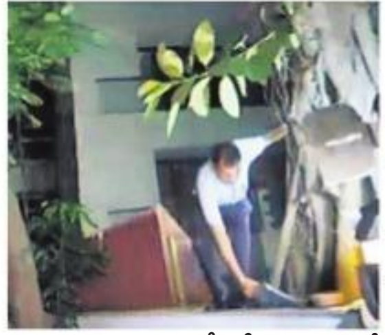
చిదంబరం తన నివాసం గేటు తీసుకపోవడంతో గోడదూకి ఇంటికి వెళ్తున్న సీబీఐ అధికారి