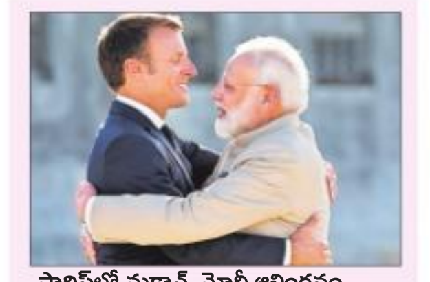
పారిస్ లో మర్యాద, మోడీ అలింగనం

లేదు. సీబీఐ విచారణలో భాగంగా ఓసారి బైటల్ జైలులో కలిశా. అలాగే విదేశీ పెట్టుబడుల ప్రోత్సాహక బోర్డు (ఎఫ్డబిపీ)లో ఎవ్వరితోనూ నేను భేటీకాలేదు. కాంగ్రెస్ పార్టీని కూడా అక్రమంగా చేసుకుంటున్నారని అని పేర్కొన్నారు.