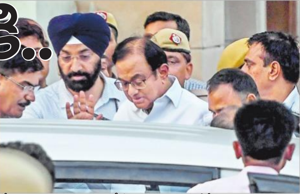
కోర్టు విచారణ తర్వాత చిదంబరంను సీబీఐ ప్రధాన కార్యాలయానికి తీసుకెళ్తున్న అధికారులు

ముందస్తు బెయిల్ అభ్యర్థనను ఢిల్లీ హైకోర్టు నిరాకరించిన, ఆరెస్టై నుంచి తక్షణం ఉటారు కల్పించేందుకు సుప్రీంకోర్టు తీర్పును సీబీఐ ప్రత్యేక కోర్టులో చర్చించిన నేపథ్యంలో.. హైదరాబాద్ అసంతరం బుధవారం రాత్రి ఉద్రిక్త పరిస్థితుల నడుమ చిదంబరంను సీబీఐ ఆరెస్టై చేసిన విషయం తెలిసింది. అసంతరం ఆయనను