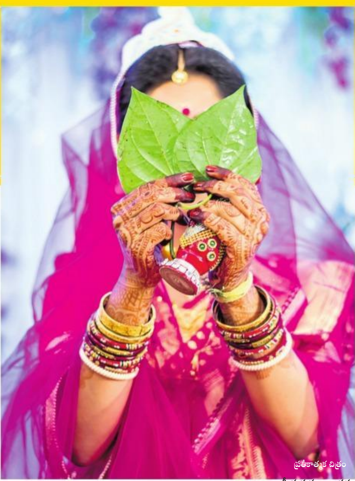
స్త్రీ పురుషులు ఇద్దరూ సమానమైనప్పుడు ఇద్దరికనీ వివాహ వయసునేర్చేగూర్చి పట్ల వివక్షను కనబరచడమేనా?!

అబ్బాయికి ఉన్నట్టు అమ్మాయికి కనీస వివాహ అర్హత వయసు 21గా లేకపోవడం స్త్రీలపై భారతీయ సమాజం చూపిస్తున్న ఒక ఘోరమైన వివక్షను నిరర్థకం చేస్తుంది. స్త్రీ, పురుషులిద్దరూ సమానమే అనే రాజ్యాంగ సూక్తిని ఈ వివక్ష భంగపెట్టేలా ఉండని అశ్రీని తన పిటిషన్ లో అందోళన వ్యక్తం చేశారు. గత