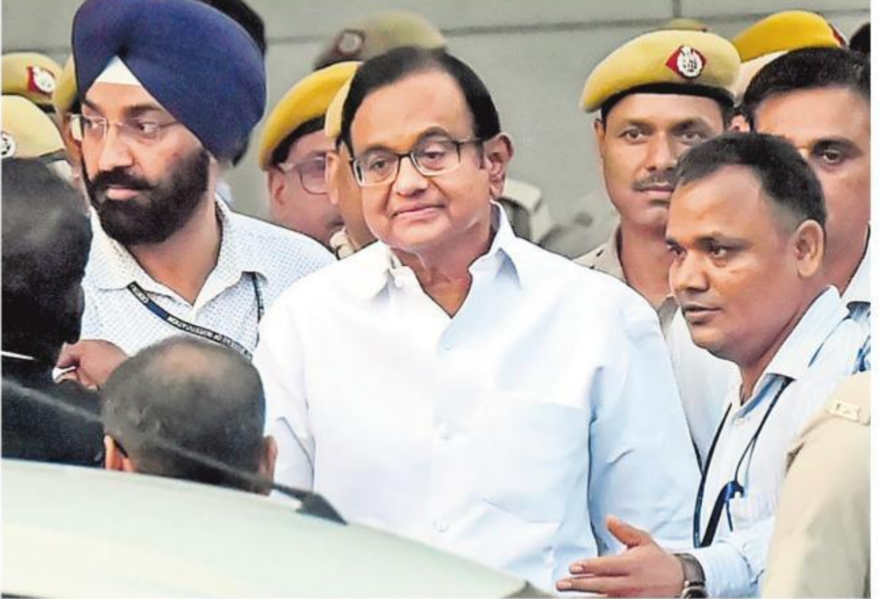
కోర్టు విచారణ తర్వాత చిదంబరంను సీబీఐ ప్రధాన కార్యాలయానికి తీసుకెళ్తున్న అధికారులు

చిదంబరాన్ని సీబీఐ అధికారులు నాలుగు గంటలపాటు విచారించారు. ఈ నాలుగు రోజుల కస్టడీలో.. రోజూ అరగంటసేపు కుటుంబసభ్యులు, న్యాయవాదులతో మాట్లాడేందుకు చిదంబరానికి అనుమతినివ్వనున్నారు. ఈ పరిణామాలతో బీజేపీ, కాంగ్రెస్ మధ్య రాజకీయ వేడి మరింత ఎక్కువైంది. బీజేపీ కక్షపూరితంగా వ్యవహరిస్తోందని కాంగ్రెస్ ఆరోపించగా.. చట్టం తనవని తాను చేసుకుపోతోందని బీజేపీ పేర్కొంది.