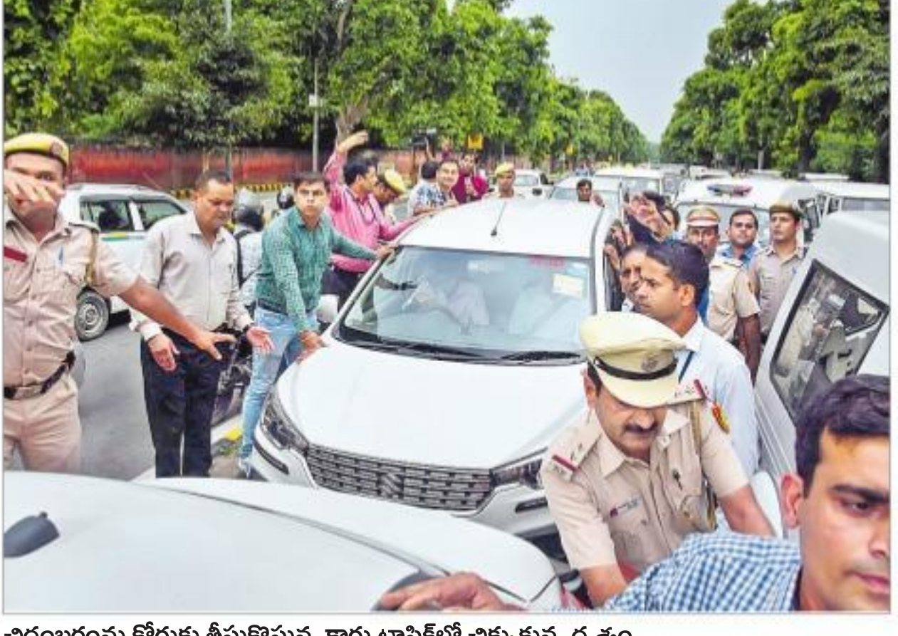
చిదంబరంను కోర్టుకు తీసుకొస్తున్న కారు ట్రాఫిక్ లో చిక్కుకున్న దృశ్యం

పారిస్: విదేశీ పర్యటనలో భాగంగా ప్రధాని నరేంద్ర మోడీ గురువారం ప్రాన్స్ కు చేరుకున్నారు. ఆయనకు ప్రాన్స్ విదేశాంగ మంత్రి జెర్మిన్ లీ డ్రయన్ ఘనస్వాగతం పలికారు. ఈ పర్యటనలో భాగంగా ప్రధాని మోడీ ప్రాన్స్ అధ్యక్షుడు జెమ్మాస్ట్యూయర్ మర్యాదతో సమావేశమై పలు అంశాలపై చర్చలు జరిపారు. మూడురోజుల పర్యటనలో భాగంగా ప్రాన్స్ చేరుకున్న మోడీ, శుభ్రవారం యూఎఫ్ కే కి వెళ్లనున్నారు. అసంతరం బహుశానే వెళ్లనున్న ప్రధాని, ఆ దేశపు రాజు ఫిల్ హెన్రీ బిన్ ఇనా అల్ ఖలిఫాతో సమావేశమై చర్చలు జరుపుతారు. చిదంబరం అధికారం ప్రాన్స్ కు తిరిగివచ్చి 37 నడన్నులో పాల్గొంటారు.