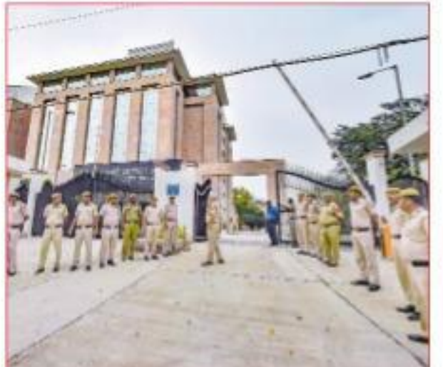
కోర్టు ముందు భారీ బందోబస్తు