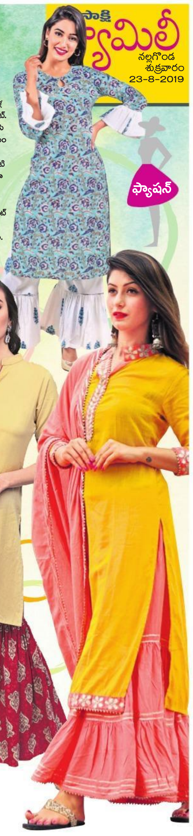
నిర్వహణ - నిర్వహణ - నిర్వహణ