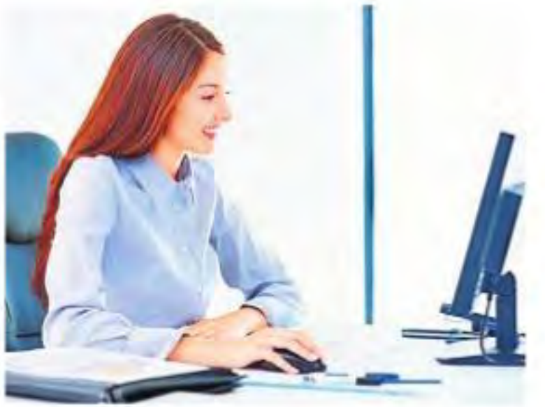
సాధారణంగా ఉద్యోగం చేసే వారందరికీ ఆదివారం మాత్రమే సెలవు ఉంటుంది. ఒక్కోసారి ఆదివారం ఉండదు. సెలవు రోజు పనులు లన్నింటినీ ఎలా చక్కదిద్దుకోవాలి? వీటికి కొన్ని నియమాలు పాటించే సరి. మల అవేంకోటి ఇప్పుడు చూద్దాం.