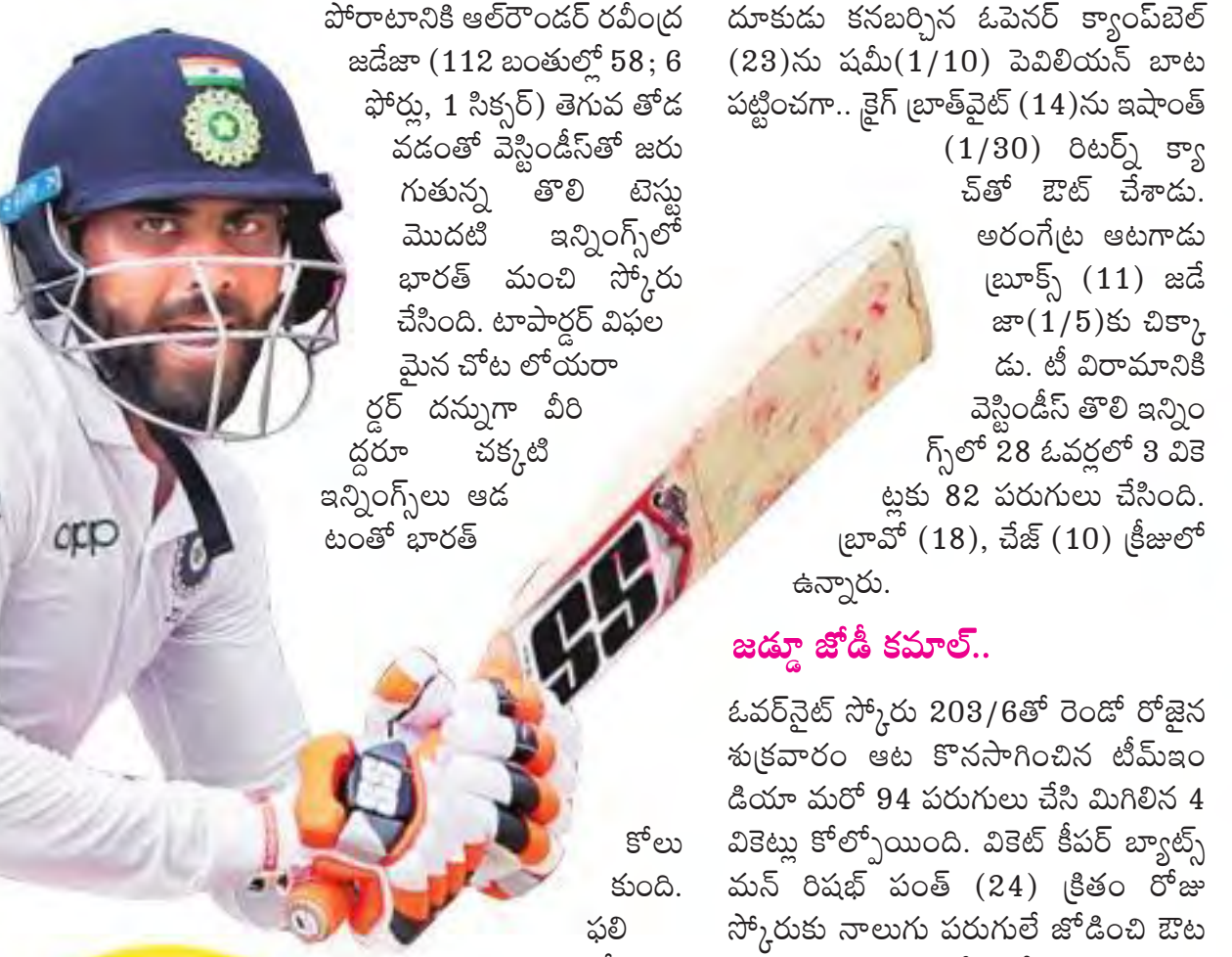
రాత్రి 7 నుంచి సోనీ టీవీ-1, టీవీ-3 లో