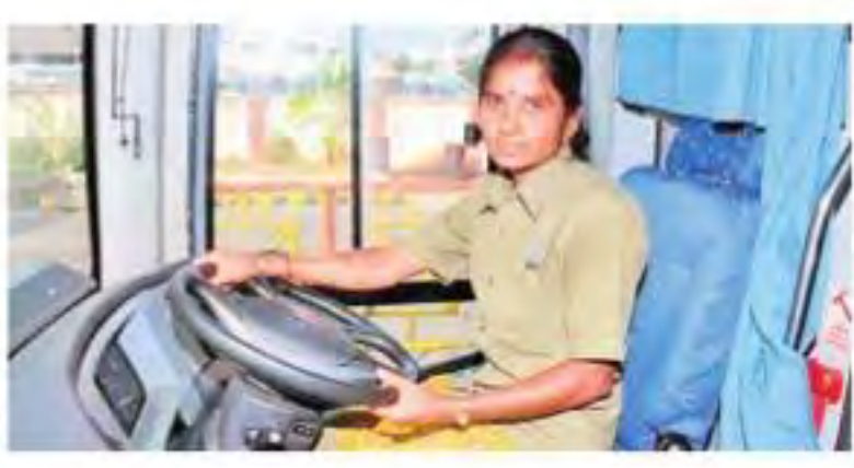
ఉపాధి కోసం మహిళలు పురుషులతో సమానంగా పోటీ పడుతున్నారు. పురుషులు ఎక్కువగా ఉండే రంగాల్లో మహిళలూ దూసుకెళ్తున్నారు. అలాంటి రంగాల్లో ఒకటి మోటర్ స్కీల్. ఇలాంటి రంగాల్లో ప్రభుత్వ పరిధిలో మహిళలకు ఉద్యోగావకాశాలు లభిస్తున్నాయి.

'నిరుద్యోగం' దేశవ్యాప్తంగా ఉన్న ప్రధాన సమస్య. అందులో మహిళలకు లభించే ఉద్యోగావకాశాలు చాలా తక్కువ. కానీ మహిళల సాధికారతకు, వారికి ఉపాధిని కల్పించేందుకు ప్రభుత్వ పరిధిలో ఉన్న పబ్లిక్ సెక్టార్లో ఉద్యోగాలు కల్పించనున్నది కేరళ ప్రభుత్వం. ఇటీవల సీఎం పిసరయే నిర్వహించిన కేబినెట్ మీటింగ్లో ఈ నిర్ణయం తీసుకుంది ప్రభుత్వం. ఇప్పటివరకూ ప్రైవేటుగా డ్రెవింగ్లో ఉన్న మహిళలు ఎవరైనా ప్రభుత్వ పరిధిలో పని చేసేందుకు అవకాశం కల్పించింది. ఆర్టీసీ, ప్రభుత్వ వాహనాల డ్రెవింగ్ వంటి ఉద్యోగాల్లో మహిళలు చేరవచ్చు అని ఆదేశాలను ఇచ్చింది. దీంతోపాటు రాష్ట్రంలో అన్ని రంగాల్లో మహిళలకు సమాన అవకాశాలు కల్పించేందుకు ప్రత్యేక చట్టాలు కలిగి ఉన్నామని కేబినెట్ వెల్లడించింది. ప్రభుత్వ విధానాలకు అనుగుణంగా ఈ అవకాశాలు కల్పిస్తున్నట్లు చెప్పింది. వీటితోపాటు మహిళల కోసం ప్రత్యేకంగా కమ్యూనిటీ సెంటర్లు, జాతీయ క్రీడా పతకాల విజేతలకు ప్రోత్సాహకాలు వంటి నిర్ణయాలు తీసుకుంది కేరళ ప్రభుత్వం. దీంతో అన్ని రాష్ట్రాల్లో కూడా ఈ సదుపాయాలు వస్తే మరింత బాగుంటుందని మహిళలు అభిప్రాయపడుతున్నారు.