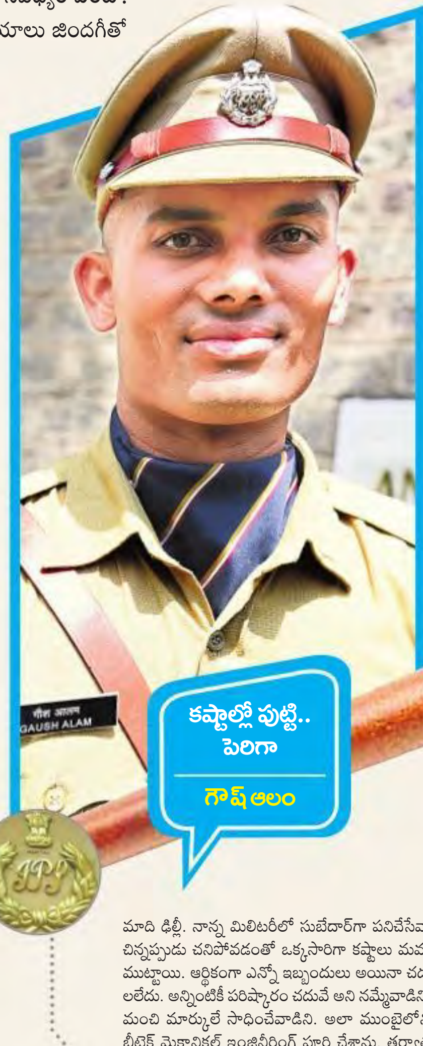
కష్టాల్లో పుట్టి.. పెరిగా గాష్ అలం