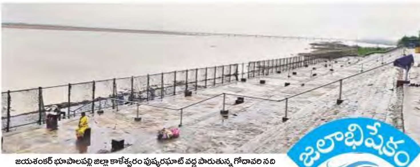
జయశంకర్ భూపాలపల్లి జిల్లా కాళేశ్వరం పుష్కరఫూల్ వద్ద పారుతున్న గోదావరి నది

రైదరాజాద్, నమస్తే తెలంగాణ/నెటివర్క్: భారీ వరదలు తగ్గిన కృష్ణా, గోదావరి బేసిన్లలో స్వల్ప ఇన్ ఫ్లోలు కొనసాగుతున్నాయి. కృష్ణానదిపై ఉన్న అన్ని జలాశయాల్లో గంభీరంగా నీటిమట్టాలు నిర్వహిస్తూ, విద్యుదుత్పత్తి, కాల్యాల ద్వారా మాత్రమే నీటిని విడుదలచేస్తున్నారు. అటు గోదావరి బేసిన్లోనూ పలు ప్రాజెక్టులకు స్వల్ప ఇన్ ఫ్లోలు వస్తున్నాయి. శ్రీరాంసాగర్ ప్రాజెక్టుకు మాత్రం ఇప్పటికీ చుక్కనీరు కూడా రావటం లేదు. కాళేశ్వరం ఎత్తిపోతల పథకంలో భాగంగా గాయత్రి పంచహాసల్ నుంచి నీటిని ఎత్తిపోస్తుండటంతో శ్రీరాజరాజేశ్వర జలాశయానికి ఇన్ ఫ్లో