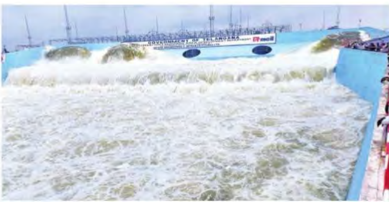
శుక్రవారం రామడుగు మండలం గాంధీ పంప్ హౌస్ వద్ద ఉప్పాంగుతున్న జలాలు