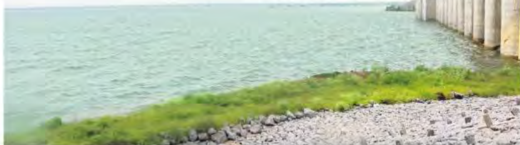
కాళేశ్వరం జలాలతో కళకళ లాడుతున్న శ్రీరాజరాజేశ్వర జలాశయం

కరీంనగర్ ప్రధాన ప్రతినిధి, నమస్తే తెలంగాణ: గాయత్రి పంచహాసల్ (లక్ష్మీపురం)లో బాహుబలి మోటు గర్భిస్తున్నాయి. ఆసియాలోనే మొదటిసారిగా 139 మోటులు భారీమోటుల పర్యాటకులను ఆకర్షిస్తున్నాయి. ఆసియాలోనే మొదటిసారిగా 139 మోటులు భారీమోటుల పర్యాటకులను ఆకర్షిస్తున్నాయి. ఆసియాలోనే మొదటిసారిగా 139 మోటులు భారీమోటుల పర్యాటకులను ఆకర్షిస్తున్నాయి.