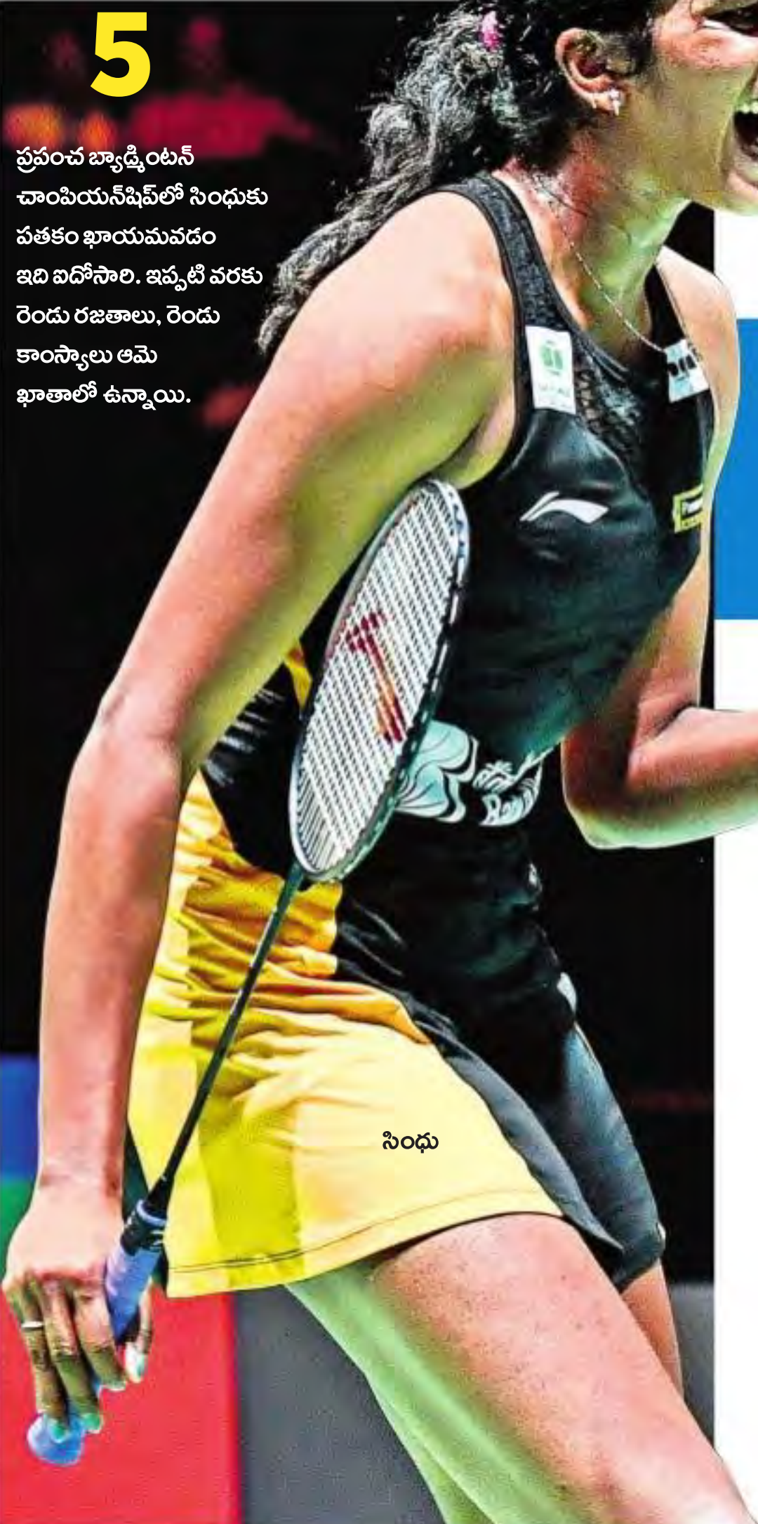
ప్రపంచ బ్యాడ్మింటన్ చాంపియన్షిప్ లో సింధుకు పతకం ఖాయమవడం ఇది ఐదోసారి. ఇప్పటి వరకు రెండు రజతాలు, రెండు కాంస్యాలు ఆమె ఖాతాలో ఉన్నాయి.

ప్రపంచ బ్యాడ్మింటన్ చాంపియన్షిప్ లో తెలుగు షట్బల్లు దుమ్మురేపుతున్నారు. మహిళల సింగిల్స్ లో పీవీ సింధు.. పురుషుల సింగిల్స్ లో సాయి ప్రణీత్ క్వార్టర్స్ లో చక్కటి విజయాలతో సెమీఫైనల్ లో అడుగుపెట్టారు. మెగటోర్స్ లో ఇంతకాలంగా ఊరిస్తూ వస్తున్న పసిడి పతకాన్ని కసారి ఒడిసి పట్టుకుంది ఆసక్తికర సింధు ముందుకు సాగుతుంటే.. మూడున్నర దశాబ్దాల గా పురుషుల సింగిల్స్ పతకం నెగ్గిన లోటును తీరుస్తూ.. ప్రణీత్ కనీసం కాంస్యం ఖాయం చేసుకున్నాడు.