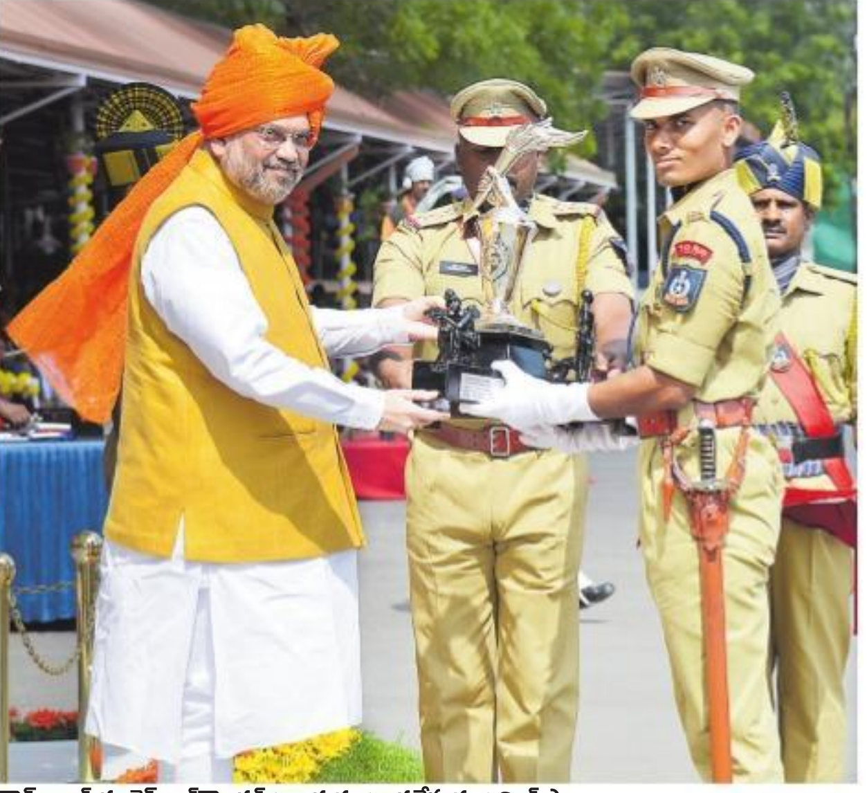
గావ్ అలమకు బెన్స్ ఆలీరాందర్ అవార్డును అందజేస్తున్న అమిత్ షా