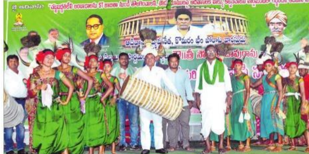
కొమ్మ తలపాగా ధరించి డోలు వాయిస్తున్న ఎంపీ సోయం బాపూరావు

సూపర్ బజార్ (కొత్తగూడెం): రాష్ట్ర ప్రభుత్వం ఇప్పటి వరకు తనపై 52 కేసులు పెట్టలేదని, వెయ్యి కేసులైనా వెనుకాడి లేదని, ఆదివాసిల సర్టిఫికేట్ కోసం బోధాధికారుల ఆదిలాబాద్ ఎంపీ సోయం బాపూరావు అన్నారు. భద్రాద్రి కొత్తగూడెం జిల్లా కేంద్రంలోని కొత్తగూడెం క్లబ్‌లో శనివారం జరిగిన ఆదివాసి సమన్వయం, అత్యధిక ఆభినందన సభలో ఆయన మాట్లాడారు. ఎస్సీ జాబితా నుంచి లంబాడీలను తొలగించేంత వరకు పోరాటం ఆగదని స్పష్టం చేశారు. స్వాతంత్ర్య పోరాటం, ప్రభుత్వాల సర్టిఫికేట్ పథకాలను ఆదివాసిలు పొందలేకపోతున్నారని, లంబాడీలకు మాత్రమే అందుతున్నాయని ఆరోపించారు. పార్లమెంటోలో పోడు సమస్యపై మాట్లాడితే అసెంబ్లీకి