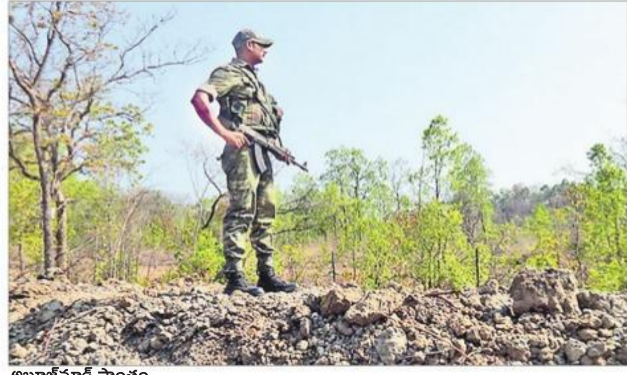
అబూజ్ మాడ్ ప్రాంతం

2న జరిగిన కోకనర్ ఎన్కౌంటర్, శనివారం నాటి దూర్బోదా అటవీ ప్రాంతంలో జరిగిన ఎన్కౌంటర్లలో ఐదుగురు మావోలు నేలకొరిగారు. దీంతో మావోయిస్టు పార్టీకి షాక్ ఇచ్చినట్లయింది. మాడ్ మావో కమిటీపై గురి వివిధ రాష్ట్రాల్లోని మావోయిస్టు పార్టీ కమిటీలలో మాడ్ డివిజన్ కమిటీ కీలకమైంది. నారాయణపూర్, ఖాంకేరి, రాజ్‌నంద్వామ్, గడ్డిగోలి జిల్లా కమిటీల్ని దండకారణ్యం కమిటీలలో పని చేస్తున్నట్లుటి మాడ్ డివిజన్ కమిటీ అత్యంత కీలకమైంది. ఆ కమిటీ ఆధీనంలోనే మావోయిస్టు పార్టీ కేంద్ర కమిటీ కీలక నాయకులు ఉంటారని ప్రచారం. దీంతో దేశంలోని మోస్ట్ వాంటెడ్ మావోయిస్టుల స్థావరంగా అబూజ్ మాడ్ను గుర్తించారు. మాడ్ కమిటీ లక్ష్యాలు కేంద్ర బలగాలు ముందుకు సాగుతూ అబూజ్ మాడ్లోకి చొచ్చుకుపోతున్నట్లు ప్రచారం జరుగుతోంది. ఇప్పటి వరకు అబూజ్ మాడ్ విస్తరించిన ఆ నాలుగైదు జిల్లాల్లో ఆదివాసి, కిసాన్ మజ్దూర్ సంఘ, దండకారణ్య మహిళా సంఘటన సంఘాలు బలంగా పని చేస్తున్నాయి. ఆయా సంఘాల్లో ఆదివాసిలు బాసలుగా నిలుస్తున్నారు. అలాగే సంఘాల్లో దళాల్లో