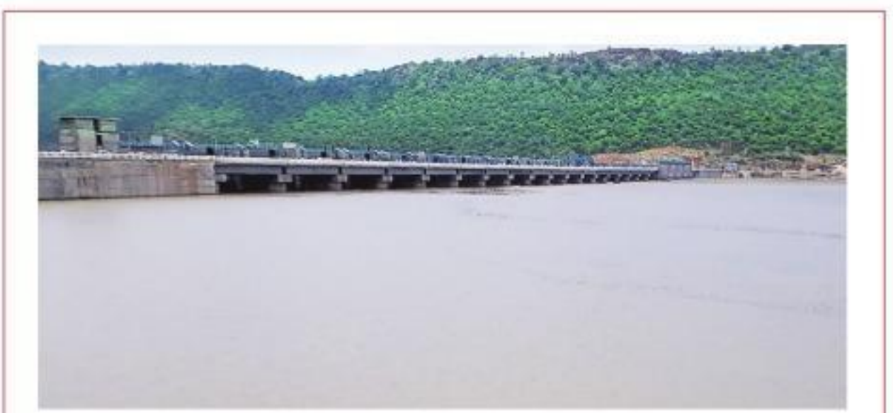
పులిచంతల ప్రాజెక్టు జలకళ