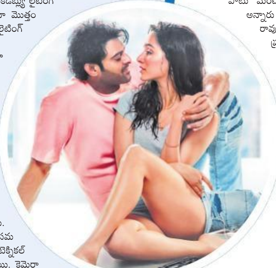
● ప్రభాస్, శ్రద్ధాకపూర్

అబుదాబి వాతావరణం ఇన్నంగా ఉంటుంది. అక్కడ ఎండ 45 డిగ్రీలు పైనే. అబుదాబి షెడ్యూల్ లో చాలామంది వడదెబ్బకు గురయ్యారు. మాలో కొంతమందికి చర్మం ఊరొస్తుండేది. అసాహ్యంగా ఇసుక తుఫానులు కూడా వస్తుండేవి. అలాంటి సమయాల్లో మమ్మల్ని మేం కాపాడుకుంటూనే మా ఖరీదైన కెమెరాలను కూడా జాగ్రత్త చేసేవాళ్ళం. ఓ మంచి సినిమాను ప్రేక్షకులకు అందించడానికి చాలా కష్టపడతాం. అప్ టోపుల్ చూపాక ఆ కష్టాలన్నీ మర్చిపోతాం.