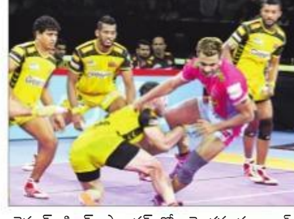
జైపూర్ పింక్ పాండర్స్ తో బెంగళూరు బుల్స్; యూపీ యోధులతో దబంగ్ ఢిల్లీ తలపడతాయి.