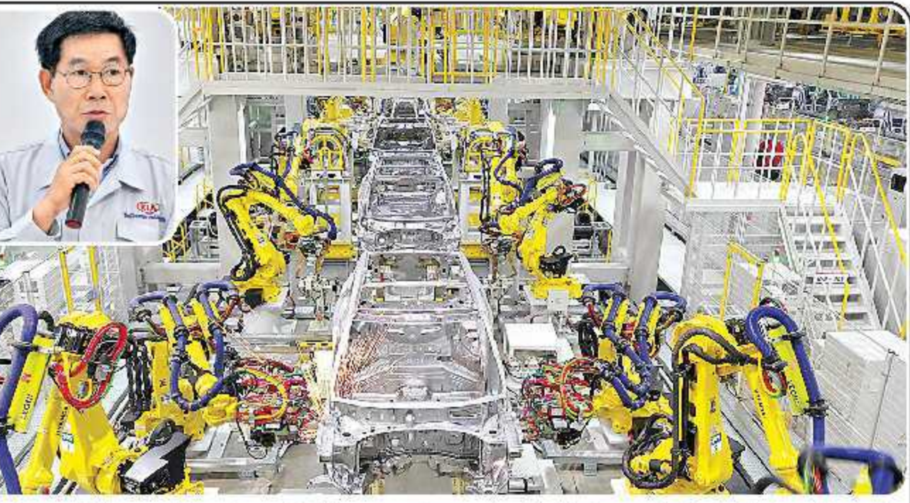
కీయా సెలెక్షన్ కు రూపొందిస్తున్న రోబోలు, (అంతర చిత్రంలో) కీయా ఎడి, సీకావో కూక్యూమ్ పిమ్

ఫిబి డిగ్రీలు ఇన్ఫోసిస్ రూ.8,260 కోట్ల విలువైన షేర్ తిరిగి కొనుగోలు బాంధ్య, డివిడెండ్లు, నోట్లు, రుణ సెక్యూరిటీలు జారీ చేసి రూ.70,000 కోట్ల నిధుల్ని సమీకరించేందుకు వాళ్లారాదా? రుణ పరిష్కార ప్రణాళికలో భాగంగా ఈక్విటీ షేర్ విక్రయం ద్వారా నిధుల్ని సమీకరించేందుకు బోర్డు ఆమోదించింది.