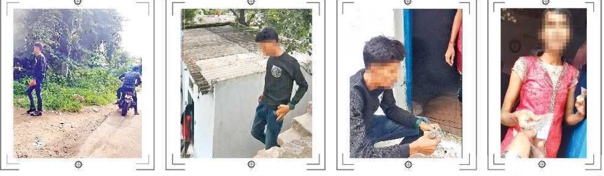
గంజాయి కొనేందుకు వెళ్తున్న యువకుడు... ఓ ఇంట్లో యువతి సుంచి ఇలా కొనుగోలు