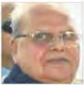
कहा, दो-तीन दिनों में केंद्र करेगा बड़े एलान

जम्मू-कश्मीर के राज्यपाल सत्यपाल मलिक ने बुधवार को एलान किया कि अगले दो से तीन महीने में जम्मू-कश्मीर और लद्दाख में 50,000 सरकारी नौकरियों के लिए भर्ती की जाएगी। उन्होंने कहा कि एक-दो दिनों में कश्मीर के विकास के लिए केंद्र सरकार कई बड़ी घोषणाएं कर सकती है। मीडिया से बातचीत के दौरान राज्यपाल मलिक ने कांग्रेस नेता राहुल गांधी पर हमला करते हुए उन्हें राजनीतिक नौसिखुआ बताया। मलिक ने कहा कि अनुच्छेद 370 पर फैसला जम्मू-कश्मीर और बाकी पेज 8 पर