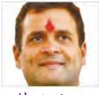
कांग्रेस के पूर्व अध्यक्ष का यू-टूर्न, कहा : जम्मू-कश्मीर हमारा आंतरिक मामला

कांग्रेस के पूर्व अध्यक्ष राहुल गांधी के कश्मीर पर दिए एक बयान को आधार बनाकर पाकिस्तान के संयुक्त राष्ट्र पहुंचने के बाद भाजपा ने विपक्षी दल के नेता पर हमला बोला है। विवाद बढ़ते देख राहुल गांधी ने बुधवार को दूसरा बयान जारी किया, जिसमें उन्होंने दो-टुक कहा कि जम्मू-कश्मीर भारत का आंतरिक मामला है और वहां पाक ही हिंसा भड़का रहा है। कांग्रेस नेताओं द्वारा स्थिति स्पष्ट किए जाने के बावजूद सूचना एवं प्रसारण मंत्री और भाजपा के दिवालियापन तो है ही साथ ही कांग्रेस की वरिष्ठ नेता प्रकाश जावड़ेकर ने कांग्रेस के पूर्व अध्यक्ष पर राजनीति भी है। देशभर के बाकी पेज 8 पर