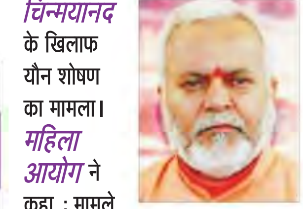
चिन्मयानंद के खिलाफ यौन शोषण का मामला। महिला आयोग ने कहा : मामले की जल्द जांच हो, लड़की की सुरक्षा सुनिश्चित की जाए।

पूर्व केंद्रीय गृह राज्य मंत्री स्वामी चिन्मयानंद के खिलाफ 'चौन शोषण' का आरोप लगाने वाली छात्रा के लापता होने के मामले पर स्वतः संज्ञान लेते हुए राष्ट्रीय महिला आयोग ने बुधवार को उत्तर प्रदेश के पुलिस महानिदेशक (डीजीपी) को नोटिस जारी किया और विस्तृत रिपोर्ट तलब की। दूसरी ओर आरोपों से घिरे चिन्मयानंद सरस्वती हरिद्वार में अपने आश्रम में हैं। वे इस बारे में मीडिया से कुछ भी बोलने को तैयार नहीं हैं। आयोग ने बाकी पेज 8 पर