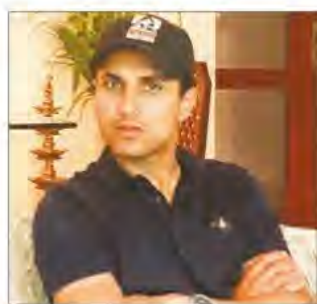
तालमेल बैठाने के सवाल पर उन्होंने कहा कि यह थोड़ा मुश्किल जरूर है लेकिन अभी मेरे पास काफी समय है।

उन्होंने कहा कि मेडिकोट ने मुझे एशियाई खेलों में पदक दिलाए लेकिन वह अभी चोटिल है। मैं अपने अन्य दो घोड़ों के साथ अभ्यास कर रहा हूँ। नए घोड़े के साथ