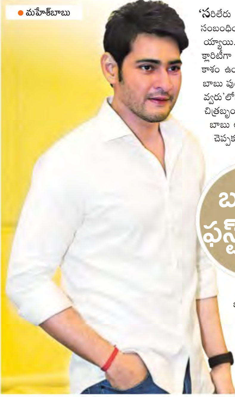
● మహేశ్ బాబు

'సరిలేరు నీకెవ్వరు'లో మహేశ్ బాబు గెటప్ ను సంచలించిన లుక్కి కొన్ని వెబ్సైట్లలో చైలర్ య్యాయి. కానీ అది అంత ఛారిటీగా లేవు. పుర ఛారిటీగా ఉన్న ఫ్యాజీలను త్వరలో చూపి ఆవ కాశం ఉందని సమాచారం. ఈ నెల 9న మహేశ్ బాబు పుట్టినరోజు. ఈ సందర్భంగా 'సరిలేరు నీకె వ్వరు'లోని మహేశ్ లుక్కిని విడుదల చేయాలని చిత్రబృందం భావిస్తోంది. ఇందులో మహేశ్ బాబు ఆర్మీ మేజర్గా నటిస్తున్నారని ప్రత్యేకించి చెప్పకూడదు. రవీశ్వర్ మండన్నా కథానాయికగా నటిస్తున్నారు. అనిల్ రావిపూడి దర్శకత్వం వహిస్తున్న ఈ చిత్రం మాటింగ్ హైదరాబాద్ లోని ఓ ప్రముఖ స్టూడియోలో జరుగుతోంది. రైల్వేస్టేషన్ బ్యాక్డ్రామ్ లో లవ్ స్టోరీ తెరకెక్కిస్తున్నారు. 'దిల్ రాజా, రామబ్రహ్మం' సుందర, మహేశ్ బాబు నిర్మిస్తున్న ఈ సినిమాకు దేవిత్రీ ప్రసాద్ సంగీతం అందిస్తున్నారు. ఈ చిత్రం వచ్చే ఏడాది సంత్రాంతికి విడుదల కానుంది.