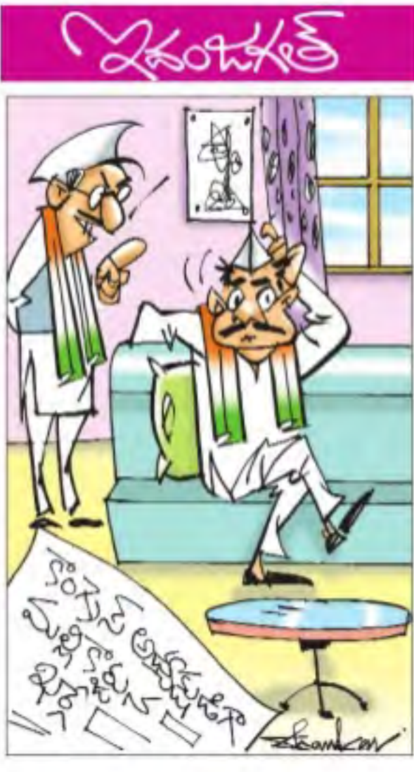
.. తర్వాత రాజీనామా చేయవలసి బాండ్ పేపర్ మీద సంతకాలు తీసుకుందాం సార్!