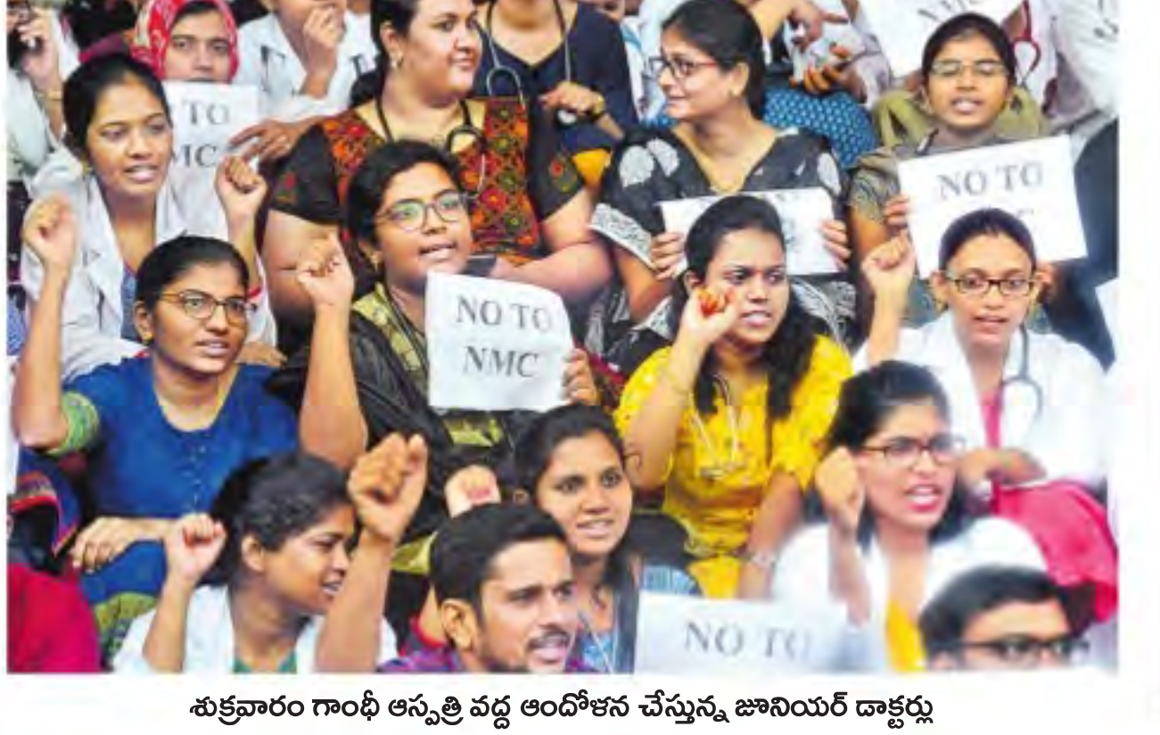
శుక్రవారం గాంధీ ఆస్పత్రి వద్ద ఆందోళన చేస్తున్న జూనియర్ డాక్టర్లు