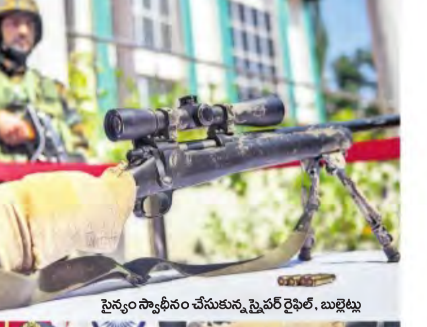
సైన్యం స్వాధీనం చేసుకున్న సైవర్ రైఫిల్, బుల్లెట్లు