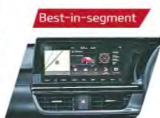
10.25 HD Touchscreen Navigation