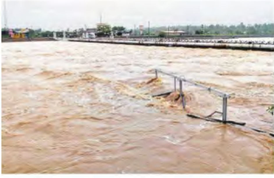
ములుగు జిల్లా మేడారంలోని జంబంపాలెనలను అనుకొని ప్రవాహిస్తున్న జంపన, వాగు

నైరుతి రుతుపవనాలు బలం పుంజుకోవడంతో రాష్ట్రవ్యాప్తంగా విస్తారంగా వర్షాలు కురుస్తున్నాయి. కొద్దిగా ఆలస్యమైనా తెలంగాణను ముసురు కమ్మేసింది. గురువారం రాత్రి నుంచి శుక్రవారం వరకు కరీంనగర్, భద్రాద్రి కొత్త గూడెం, వరంగల్ రూరల్, ములుగు, మహబూబాబాద్ జిల్లాల్లో భారీ వర్షం పడింది. ఖమ్మం, పెద్దపల్లి, మంచిర్యాల, ఉమ్మడి పాలమూరు తదితర జిల్లాల్లో ఓ మోస్తరు వానలు పడగా, నల్లగొండ, సూర్యాపేట, వికారాబాద్ తదితర జిల్లాల్లో ముసురు పట్టింది. రాష్ట్రంలో అత్యధికంగా ములుగు జిల్లా వెంకటాపూర్ మండలంలో 21.6 సెం.మీ వర్షపాతం నమోదు కాగా, అదే జిల్లా వెంకటాపూర్ (నూగూరు)