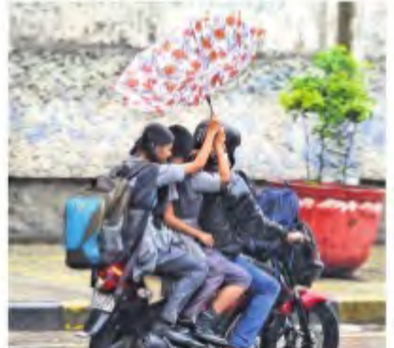
శుక్రవారం సాయంత్రం హైదరాబాద్ లో జోరువానల ద్వీపకల్పనాంబు పుట్టిన స్కూలు పిల్లలు ఫలితో కున్నపడుతున్న దృశ్యం