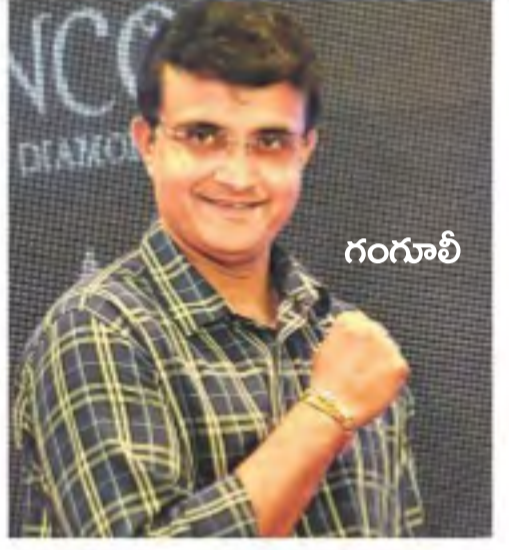
కోచ్ కలా: భారత మాజీ కెప్టెన్ సారథి గంగూలి తన మనస్సులోని మాటలు బయటపెట్టాడు. ఏదో ఒక రోజు టీమ్ ఇండియాకు కచ్చితంగా కోచ్ అవుతానని అన్నాడు. ప్రపంచకప్ కోచ్ రవిశాస్త్రితో పాటు సహాయక సిబ్బంది పదవికాలం ముగియడంతో టీమ్ సీమ్ తాజాగా దరఖాస్తులకు ఆహ్వానించిన సంగతి తెలిసింది. ఈ నేపథ్యంలో దాదా వ్యాఖ్యలు ప్రాధాన్యం సంతరించుకున్నాయి.

శుక్రవారం ఒక కార్యక్రమంలో పాల్గొన్న గంగూలి మీడియాతో పలు అంశాలపై మాట్లాడాడు. కచ్చితంగా ఏదో ఒక రోజు భారత టీమ్ కోచ్ పదవి కోసం పోటీపడుతా. కానీ ఇప్పుడున్న పరిస్థితుల్లో మాత్రం కాదు. ఒక షేజీ ముగిసిన తర్వాత కోచ్ రేసులో నేను ఉంటా. ప్రస్తుతం నేను ఐ.పీ.ఎల్, క్యాబ్, టీవీ కామెంటరీ లాంటి వాటితో చాలా బిజీగా ఉన్నాను. ఇప్పున్న పూర్తి చేసిన తర్వాత కోచ్ పదవి కోసం ప్రయత్నిస్తా. ఇప్పుడు కాకపోయినా సమీప భవిష్యత్తులో పోటీకి వస్తా. రవి శాస్త్రి కొనసాగాలా వద్దా అన్నదాని గురించి నేను ఇప్పుడు మాట్లాడు. అయినా ఇది సరైన సమయం కాదు. ప్రస్తుతం కోచ్ రేసులో దరఖాస్తు చేసుకున్న వారిలో అంత ప్రముఖ క్రెడిటు ఉండాలి లేదు. క్రికెట్ సలహాదారుల కమిటీ(సీపీసీ) కోడె ఎంపికైతే తుది నిర్ణయం తీసుకుంటుంది. పదవీ కాలం ఎంత ఇన్చార్జ్ న్నది ఇంకా తెలియాలి ఉంది. రానున్న వైసిపిలో సీనీర్ చాలా కీలకమైంది. సొంతగ సంగతి తెలిసింది. ఈ నేపథ్యంలో దాదా వ్యాఖ్యలు ప్రాధాన్యం సంతరించుకున్నాయి.