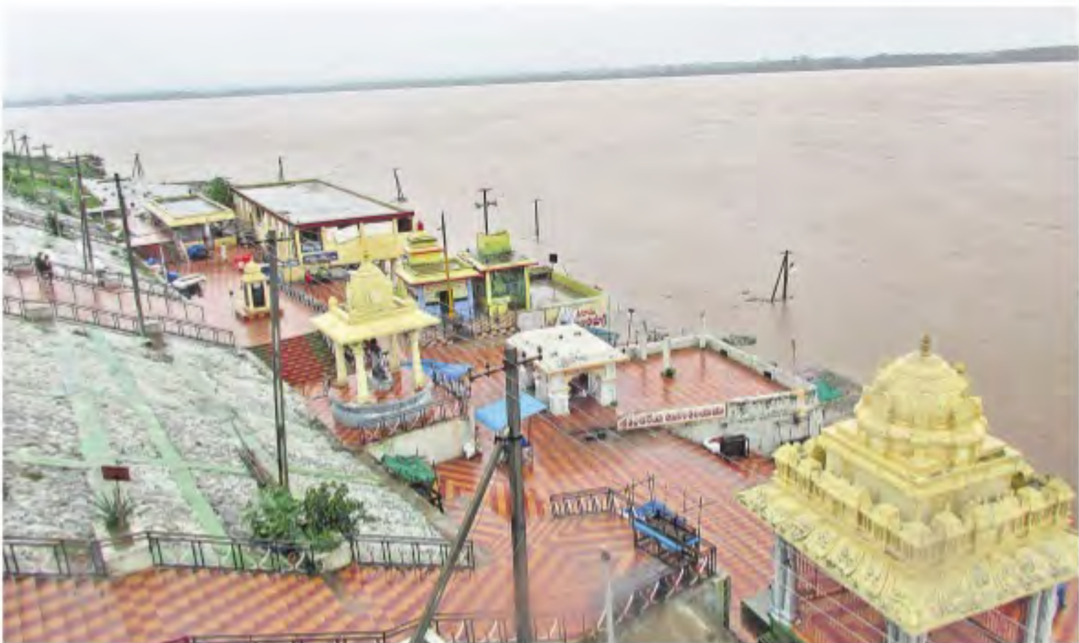
శుక్రవారం భద్రాచలం కరకట్ట వద్ద ఉద్ధృతంగా ప్రహేళిస్తున్న గోదావరి

భద్రాచలం, నమస్తే తెలంగాణ / చర్య రూరల్: భద్రాచలం వద్ద గోదావరి ఉగ్రరూపం దాల్చుతున్నది. శుక్రవారం రాత్రి 9 గంటలకు 41.7 అడుగులకు చేరుకున్నది. ఇది అగ్రరాత్రి తర్వాత 43 అడుగులకు పెరిగి అపకాశం ఉన్నట్లు సీడబ్ల్యూసీ అధికారులు తెలిపారు. 43 అడుగులు దాటితే మొదటి ప్రమాదహెచ్చరిక జారీచేస్తారు. గోదావరి పెరుగడంతో భద్రాచలం వద్ద స్నానస్థలాలు నీటిమునిగాయి. కల్యాణకట్ట చుట్టూ వరదనీరు చేరింది. పట్టణ శివారుకా లనీల్లోకి నీరు చేరుకుంది. పలు ఏజెన్సీ గ్రామాలు జలదిగ్బంధంలో చిక్కుకున్నాయి. చర్య మండలంలో తాలిపేరు ప్రాజెక్టుకు వరద పోటెత్తడంతో రాత్రి 8.30 గంటల సమయంలో 25 గేట్లను ఎత్తి, 1.92 లక్షల క్యూసెక్కులు విడుదలచేస్తున్నారు.