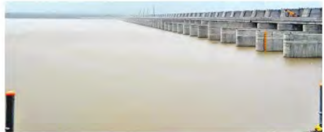
శుక్రవారం మహాదేవపూర్ మండలం మేడిగడ్డ బరాజ్లో నిల్వ ఉన్న నీరు

కాళేశ్వరం వద్ద ప్రాణహిత ఉగ్రరూపం ■ మేడిగడ్డకు 4.47 లక్షల క్యూసెక్కుల ఇన్ఫ్లో కన్నెపల్లిలో నాలుగోరోజూ మోటర్లు బంద్ ■ పూర్తిస్థాయి నీటిమట్టానికి అన్నారం బరాజ్ నాలుగు గేట్లు ఎత్తివేసిన అధికారులు ■ గోలివాడలో వెటర్నను మోటర్లు సిద్ధం పేరూరు దగ్గర తగ్గిన వరద ఉధృతి ■ కడెం, ఎల్లంపల్లికి స్థిరంగా ఇన్ఫ్లోలు