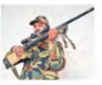
అమర్నాథ్ యాత్ర మార్గంలో దొరికిన ఉగ్రవాదుల తుపాకీ