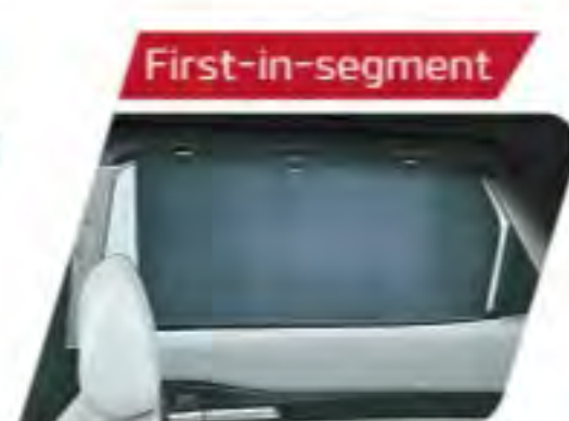
Rear Sunshade Curtains