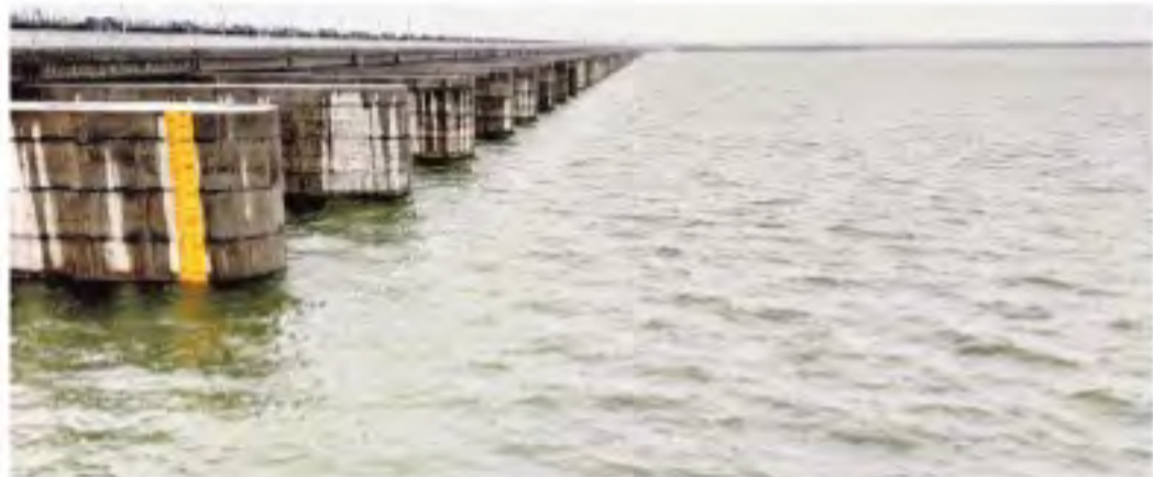
నీటిలో కళకళలాడుతున్న మంధని మండలం సిరిపురంలోని నందిల్లి బరాజ్