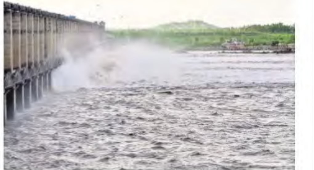
జిల్లాసారంగాపూర్ మండలం గాంధీనగర్ వద్ద మైదానంలా మారిన అటవీ భూమిలో గత ఏడాది నాటి మొక్కలు ఇది