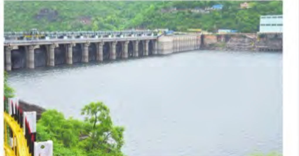
శుక్రవారం శ్రీశైలం ప్రాజెక్టులో పెరిగిన వరద దృశ్యం

హైదరాబాద్ / మహబూబ్ నగర్ ప్రధాన ప్రతినిధి, నమస్తే తెలంగాణ: ఆల్పట్టి నుంచి శ్రీశైలం వరకు కృష్ణమ్మ ఉరకలెత్తుతున్నది. దాదాపు 2 లక్షల క్యూసెక్కులకుపైగా వరద పోటెత్తుతుండటంతో కృష్ణాటెన్సీలో జలకళ ఉధృతమవుతున్నది. కృష్ణాజలాలు అంతకంతకూ ఉధృతమై పెనుకుంటూ శ్రీశైలం జలాశయానికి చేరుకుంటున్నాయి. ఈ నేపథ్యంలో తెలంగాణ నీటిపారుదల శాఖ ఒకపైపు జారాలనుంచి సాగునీటిని విడుదలచేస్తూ చెరువులను నింపడంతోపాటు మరోపైపు శ్రీశైలం నుంచి కల్వకుర్తి ఎత్తిపోతల పథకం ద్వారా నీటి ఎత్తిపోతలు చేపట్టింది. ఆల్పట్టి మొదలు శ్రీశైలం వరకు శనివారం కూడా వరద స్వల్పంగా పెరుగుతుందని కేంద్ర జలసంఘం స్పష్టంచేసింది. మరో 15-20 రోజులపాటు ఇన్ఫ్లోలు ఇదేరీతిలోనే సమాధైతే తెలుగు రాష్ట్రాల పరిధిలోని ప్రాజెక్టులన్నీ నిండుకుండలా మారనున్నాయి. ఈ నీటి సంపతకంలో మొన్నటిదాకా శ్రీశైలం జలాశయం సుమారు 805 అడుగుల నీటిమట్టంతో 31 టీఎంసీల వరకు నీటిని నిల్వ ఉన్నది. గత రెండురోజులుగా వస్తున్న వరదతో నీటిమట్టం వేగంగా పెరుగుతున్నది. గత నెల 31 నుంచి ఈ నెల ఒకటో తేదీ యిగూడే మండలం దేవారల ఇన్ఫ్లో వెల్లడవుతున్నది. 32 టీఎంసీల నీరు వచ్చి చేరగా.. శుక్రవారం ఉదయం అయి గంటల సమయానికి అదనంగా 16.88 టీఎంసీలు వచ్చాయి. సాయంత్రం ఐదుగంటల సమయానికి మరో ఎనిమిది టీఎంసీల వరకు వరదంతో గత 35 గంటల్లోనే శ్రీశైలానికి దాదాపు 25 టీఎంసీల నీరు వచ్చింది. శుక్రవారం రాత్రి ఏడు గంటలకు శ్రీశైలానికి ఇన్ఫ్లో 2.02 లక్షల క్యూసెక్కులకు పెరిగింది. దీంతో దిగువకు 2.30 లక్షల క్యూసెక్కులను వదులుతున్నారు. నారాయణపేట వద్ద 2.40 లక్షల క్యూసెక్కుల ఇన్ఫ్లో, 2.10 లక్షల క్యూసెక్కుల అవుట్ఫ్లో ఉన్నది.