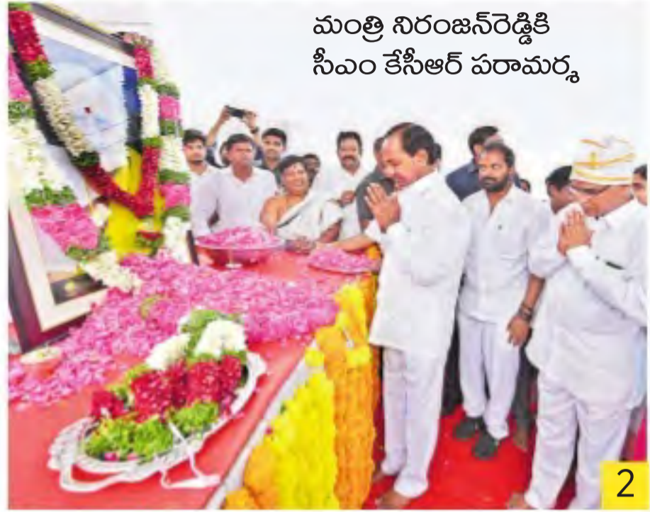
మంత్రి నిరంజన్ రెడ్డికి సీఎం కేసీఆర్ పరామర్శ