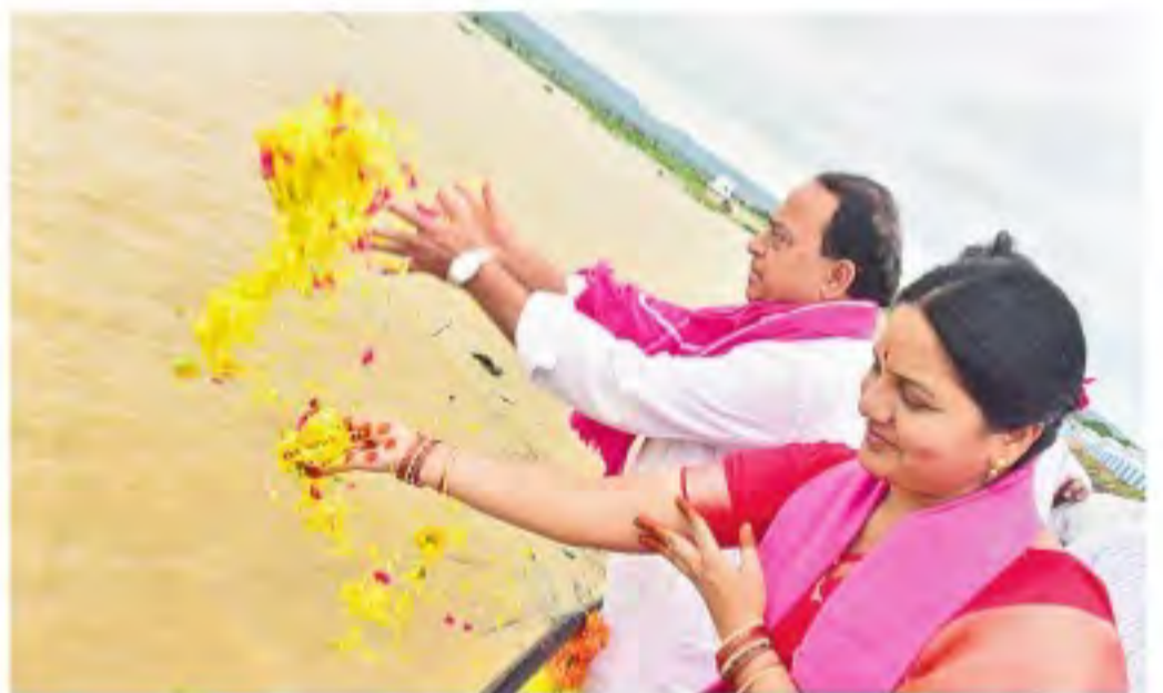
శుక్రవారం నిర్వహించిన జిల్లా సారంగాపూర్ మండలంలోని స్వర్ణ ప్రాజెక్టు ఎడమ కాల్వ ద్వారా నీటిని విడుదలచేసిన అనంతరం నదిలో పూలు చల్లుతున్న మంత్రి ఇంద్రకణ్ఠరెడ్డి, నిర్వహించిన జిల్లా సారంగాపూర్ మండలంలోని స్వర్ణ ప్రాజెక్టు ఎడమ కాల్వ ద్వారా నీటిని విడుదలచేసిన అనంతరం నదిలో పూలు చల్లుతున్న మంత్రి ఇంద్రకణ్ఠరెడ్డి.

నారాయణపేట - జలాల మధ్య చిన్న బరాజ్లు ఉన్నాయి. వాటినుంచి పెద్దగా నీటి వినియోగం లేకపోవడంవల్ల జలాలకు స్థిరంగా వరద వస్తున్నది. జలాల జలాశయానికి రాత్రి 9 గంటల సమయంలో