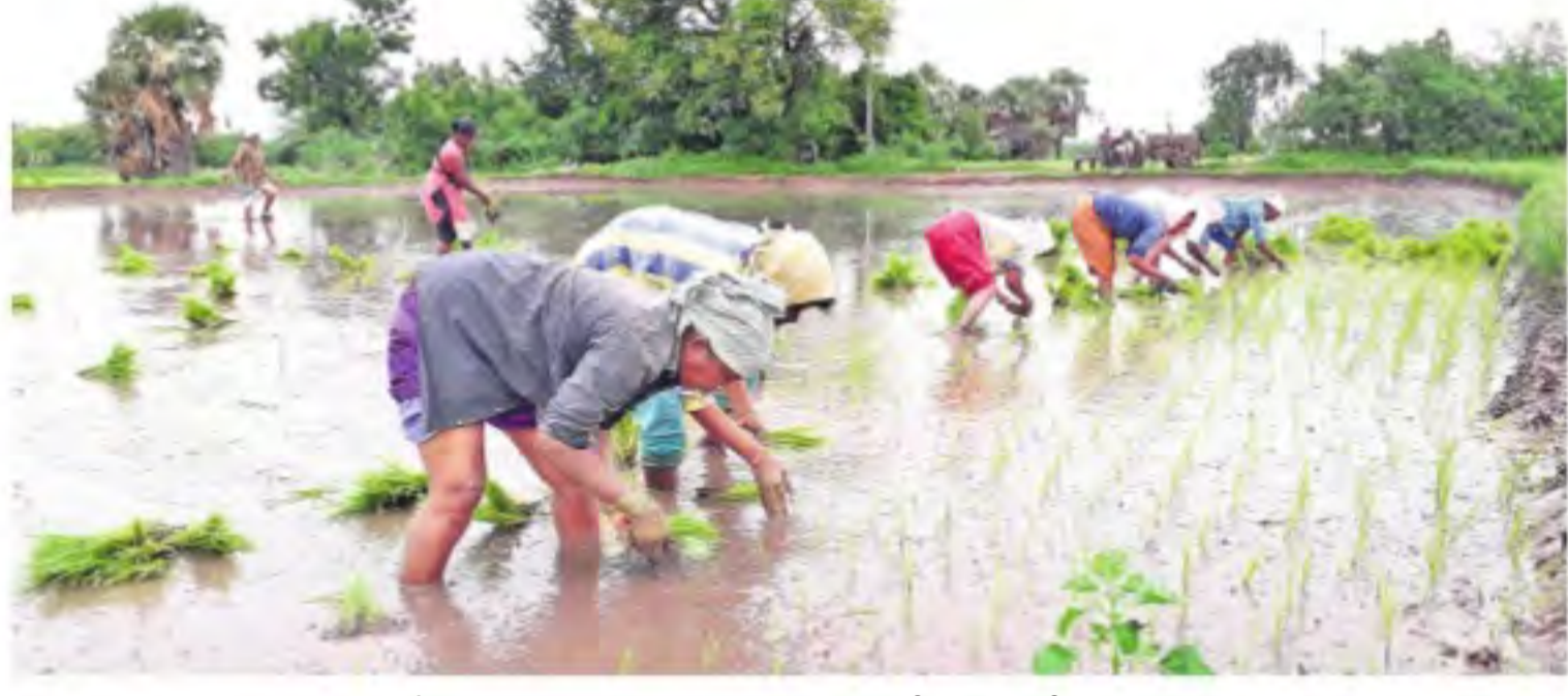
శుక్రవారం కరీంనగర్ జిల్లా జమ్మికుంట మండలం మడిపల్లిలో పరినాట్లు వేస్తున్న మహిళలు