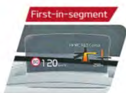
Smart 8.0 Head-up Display

@KiaMotorsIN @KiaMotorsIN Kia Motors India @KiaMotorsIN