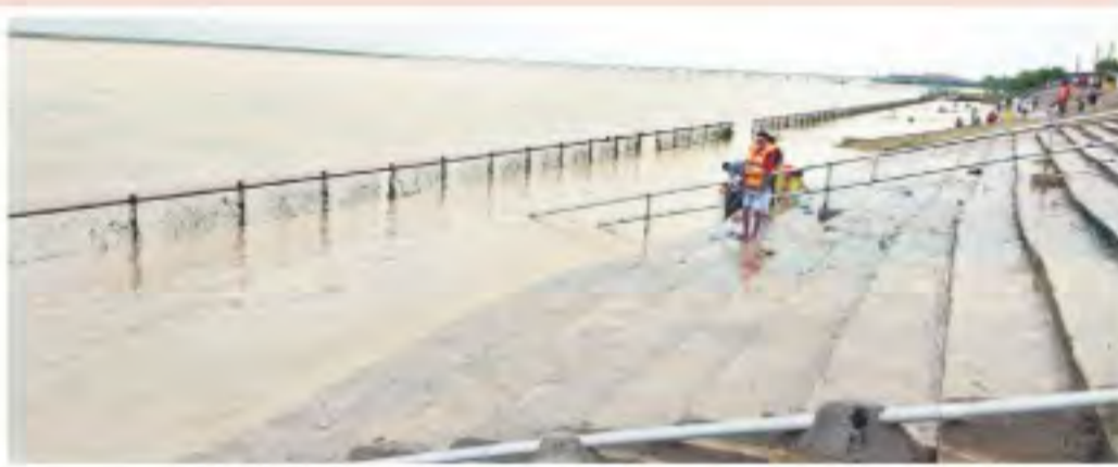
మహాదేవపూర్ మండలంలోని కాళేశ్వరం పుష్కరపూటీ వద్ద పారుతున్న గోదావరి

హైదరాబాద్, నమస్తే తెలంగాణ / నేటివర్కె: దిగువ పేడిగడ్డ నుంచి, ఎగువన ఎల్లంపల్లి దాకా గోదావరి ఉప్పొంగి ప్రహేళిస్తున్నది. ప్రాణ హిత నుంచి భారీగా వరదనీరు వస్తుండటంతో మేడిగడ్డ బరాజ్ దగ్గర 4.47 లక్షల క్యూసెక్కుల ఇన్ఫ్లో వస్తుండగా, 65 గేట్ల ద్వారా దిగువకు అంతే మొత్తం నీటిని తరలించేస్తున్నారు. అటు అన్నారం, సుంద్ర బరాజ్లు కూడా నిండుకుండలను తలపిస్తున్నాయి. ఎల్లంపల్లి జలాశయానికి క్రమంగా వరద పెరుగుతున్నది. ప్రాణహిత కలిసిన తర్వాత కాళేశ్వరం వద్ద గోదావరి పుష్కరపూటీను ఆనుకొని ప్రహేళిస్తున్నది. పుష్కరపూటీ వద్ద 9.3 మీటర్ల లోతులో పారుతున్నది. కాళేశ్వరం అంతర్జాతీయ వంతెన సమీపంలోని కన్నెపల్లి పంచాయతీను తాకుతూ జలాలు మేడిగడ్డ బరాజ్కు వెళ్తున్నాయి. వరాల కారణంగా కన్నెపల్లి పంచాయతీలో నాలుగోరోజూ కూడా మోటర్లు నిలిపివేశారు. ప్రస్తుతం మేడిగడ్డ బరాజ్లో 4.72 టీఎంసీల నీటిని నిల్వ ఉన్నది. రానున్న రోజుల్లో బరాజ్లోకి భారీస్థాయిలో జలాలు చేరినట్లు అంచనా వేస్తున్నారు. పేరూరు దగ్గర గురువారం ఉదయం 8 లక్షల క్యూసెక్కులకు పైగా నమోదైన ప్రవాహం శుక్రవారం ఉదయానికి 6.7 లక్షల క్యూసెక్కులు ఉన్నది. ఈ నేపథ్యంలో