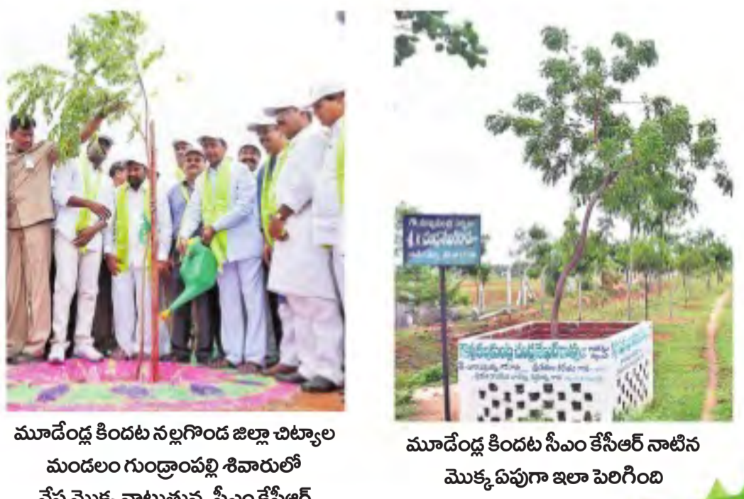
మాదెండ్ల కిందట నల్లగొండ జిల్లా చిట్యాల మండలం గుండ్రాంపల్లి శివారులో వేప మొక్క నాటుతున్న సీఎం కేసీఆర్