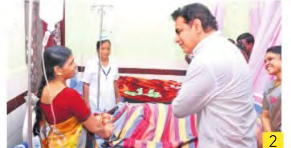
శుక్రవారం రాజన్న సిరిసిల్ల జిల్లా కేంద్రంలోని దవాఖానలో పరలక్షికి పుట్టిన పాప ఆలోగ్యం గురించి ఆమె అర్థం అయితే మాట్లాడి తెలుసుకుంటున్న కేటీఆర్