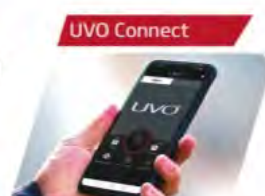
Remote Start & Voice Recognition with 37 Connectivity Features