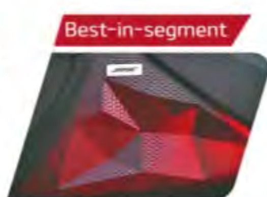
BOSE Premium Sound System with 8 Speakers & LED Sound Mood Lights