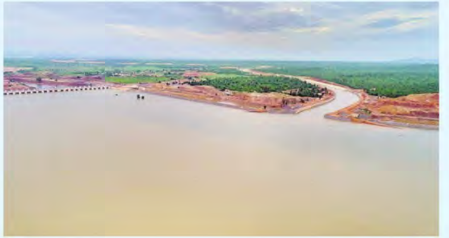
శుక్రవారం జయశంకర్ భూపాలపల్లి జిల్లా మహాదేవపూర్ మండలంలో నిడుకుండలా మారిన అన్నారం బరాజ్

ఉరకలేస్తున్న కృష్ణమ్మ రెండు లక్షల క్యూసెక్కులకుపైగా వరద అల్పట్టి నుంచి శ్రీశైలం దాకా అదే ఉధృతి వేగంగా పెరుగుతున్న శ్రీశైలం నీటిమట్టం 35 గంటల్లో జలాశయంలోకి 25 టీఎంసీల నీరు కల్వకుర్తి లిఫ్టుద్వారా 2400 క్యూసెక్కుల ఎత్తిపోత జారాల, శ్రీశైలం పరిధిలో జోరుగా వ్యవసాయ పనులు