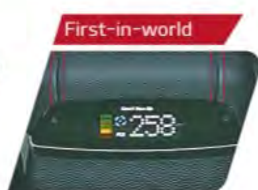
Smart Pure Air Purifier with UVO Controls