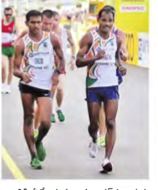
న్యూఢిల్లీ: ఏదేండ్ల తర్వాత భారత్ కు అదృష్టం తలుపు తట్టింది. రష్యా వేదికగా 2012 లో